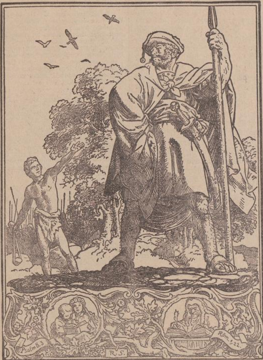
David und Goliath.

und dem Herrn Jesus Christus steht. Sowohl bei den kämpfenden Soldaten, wie bei den Heerführern und Politikern, wie bei den miteinander ringenden Völkern insgesamt. Wir kämpfen mit Gott und, recht verstanden, auch für Gottes Sache. Wir streiten für Wahrheit und Gerechtigkeit gegen Lüge und Trug, Falschheit und Hinterlist, Verrat und Lücke, Roheit und Grausamkeit, und so gegen ein ganzes Heer von Bosheiten und Sünden, mit denen sich unsere Feinde immer wieder wappnen. Darum aber kann auch der Sieg nicht mit ihnen sein, und ebensowenig ein gutes Gewissen.