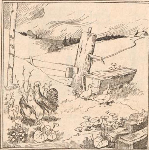
Wo ist das Vieh?