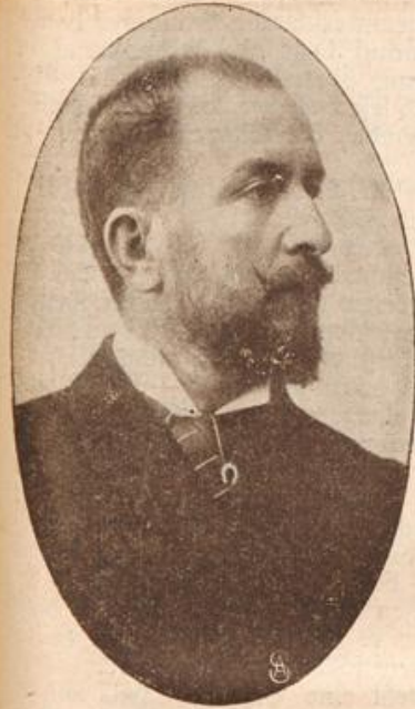
Marchese di San Gintiano †. (Mit Text.)

für durchaus notwendig. — Fris mußte sofort zur Stadt fahren, um Doktor Wadenroder zu holen. Der war denn auch bald zur Stelle, bestätigte Martins Annahme, legte einen kunstgerechten Verband an, verschrieb Fiebermittel und anderes und erteilte Lottchen, die ihm erklärte, die Krankenpflege allein übernehmen zu wollen, Ratsschläge und Verhaltensmaßregeln. Nachher hatte er mit dem Oberförster in dessen Bureau noch eine längere Aussprache wegen der in der Stadt alle Gemüter erregenden Standalgeschichte. Aus dem, was