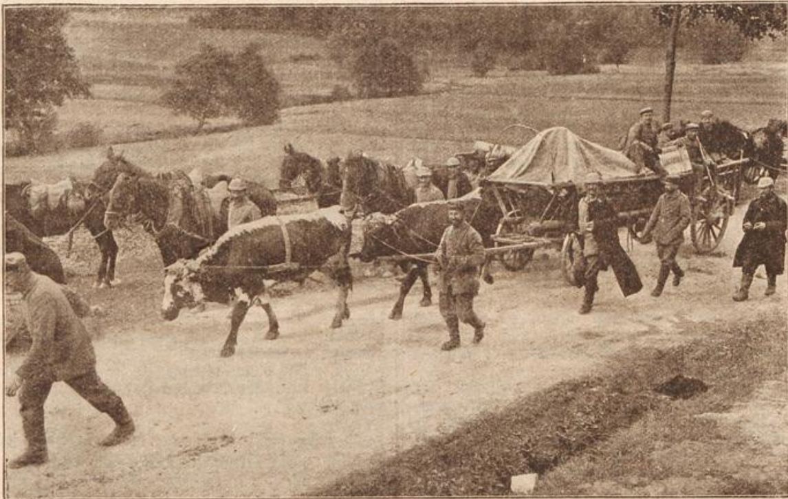
In den Vogesen: Eine bayerische Fuhrpartkolonne mit requiriertem französischen Schlachtvieh, das zum Ziehen des Wagens benutzt wird.

Schon lächelte Fräulein Amalie Röder wieder verjöhlich, gelobte strengstes Stillschweigen und erfuhr, daß ihres Bruders