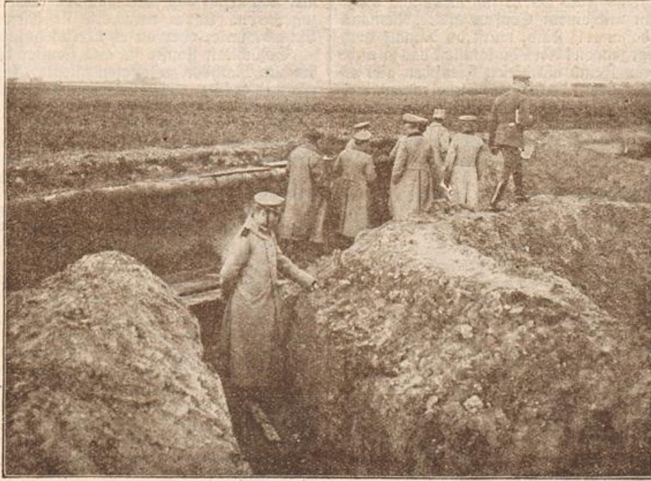
Nach der Einnahme von Antwerpen: Besichtigung eines deutschen Schützengrabens vor Antwerpen durch die Kriegsberichterstatter und Militärattachés.

Da nahte Hilfe: des alten Martin Riesengehals tauchte in der Ferne auf, und wie einem von Gott gesandten Engel jubelte