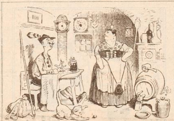
Auf der Tour. Tourist: Frau Wirtin, das Bier ist aber matt! Wirtin: Das glaub' i gern; wenn Sie so lang g'laufen wären wie das Bier, täten S' aa matt sein.

Überhaupt ist der Fortschritt ungeheuer, welcher auch für den Krieg die Beförderung mittelst der Autofahrzeuge gebracht hat. Es wird ja alles und alles mit diesen neuesten Fahrzeugen vor und hinter der Linie befördert. Truppenteile in gepanzerten Autos, welche möglichst reich vorwärts gebracht werden sollen. Die Heerführer selbst sind in der Lage, mit den Schnellfahrzeugen in kürzester Frist von einem Flügel ihres Heeres bis zum andern sich vom Stand der Sache zu überzeugen. Verwendung werden mit ihrer Hilfe hinter die Linie und reich in das nächste Lazarett gebracht. Schiefmaterial und Proviant wird den Truppen nachgeführt. Liebesgaben gelangen durch sie in die Front und dahin, wo bestimmte Truppenteile ihren Standort haben. Ja selbst die fürchterlichsten Kriegswerkzeuge, wie die sogenannten Motorbatterien, werden auf diese Weise in verhältnismäßig kurzer Zeit und mit verhältnismäßig leichter Mühe in den Kampf gestellt. Wer hätte es gedacht, daß die noch so junge Automobilindustrie zu solchen Leistungen fähig machte, und daß sie, die bisher nur dem Sport und ruhigem, friedlichem Verkehr diente, nun auch im Ernstfall, im Krieg sich so sehr bewährte!