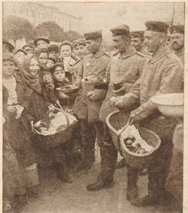
In Russisch-Polen: Deutsche Soldaten kaufen bei der Bevölkerung Lebensmittel.

men, umfaßte den fast erstarrten Körper mit ihren beiden warmen, weichen Armen, rüttelte ihn, richtete ihn ein wenig auf und hörte etwas wie leises Stöhnen über seine Lippen kommen.