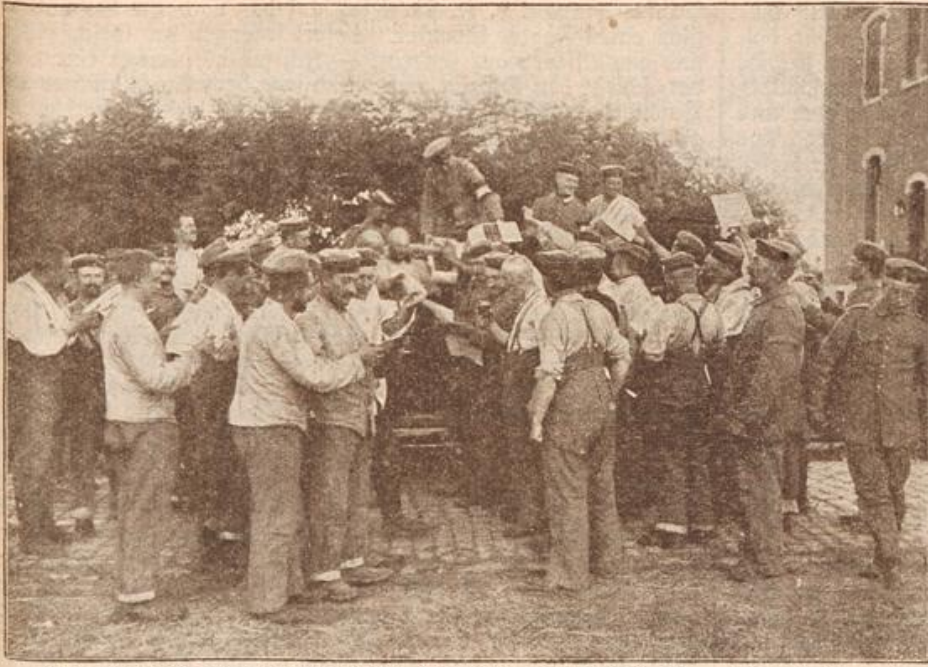
Vom Kriegsschauplatz in Frankreich: Verteilung von Liebesgaben.