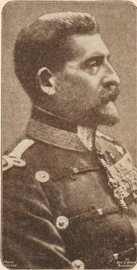
König Ferdinand von Rumänien, Nachfolger und Neffe des verstorb. Königs. (Mit Text.)