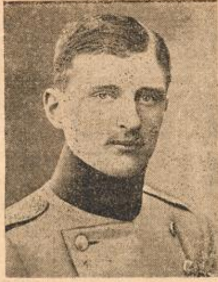
Prinz Heinrich von Bayern griff in einem der jüngsten Gefechte mit seiner Eskadron eine Abteilung französischer Dragoner an und vernichtete sie.