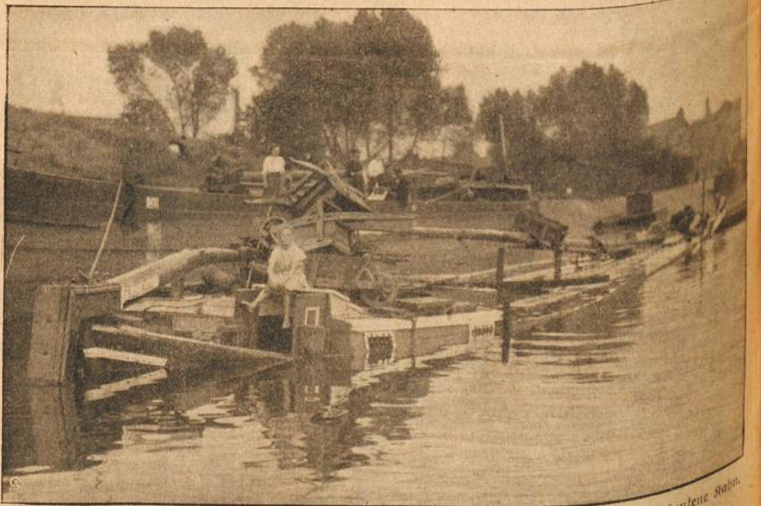
Ein Schiffsunfall auf der Spree. Der am Habsburger Ufer in Charlottenburg gesunkene Kahn.