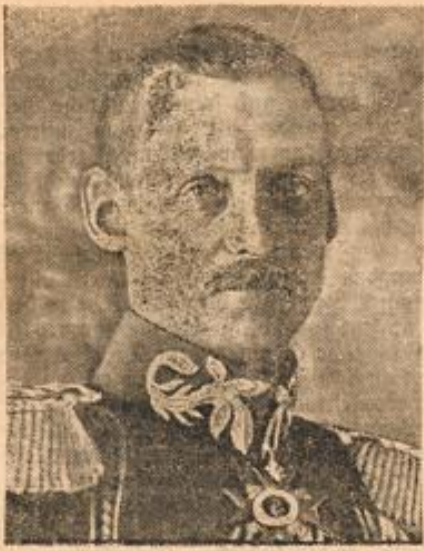
Kronprinz Rupprecht von Bayern der Führer der deutschen Armee in der Schlacht bei Metz.