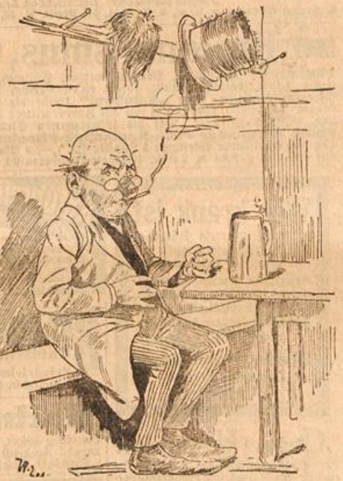
Der zerstreute Professor.

„Wüßte doch nur wissen, was die Leute über mich zu lachen haben!“