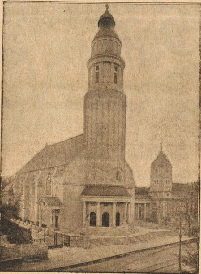
Die jetzt 150 Jahre alte ehemalige Dorfkirche (x) neben der modernen Paul-Gerhardt-Kirche in Berlin-Schöneberg.

Nachricht von Sinskes Sturz aus Göbrow gekommen war. Kein Mensch wußte aus und ein. Annemarie wurde frühmorgens vom „Futtermeister“ — dem ältesten Spannknechte — darüber interpelliert, ob er selbst das Futter an die Gespanne ausgeben solle. In ihrem Eifer hatte sie sich selbst mit dem alten Lohiu auf den Kornboden begeben und das Verteilen der Futter-