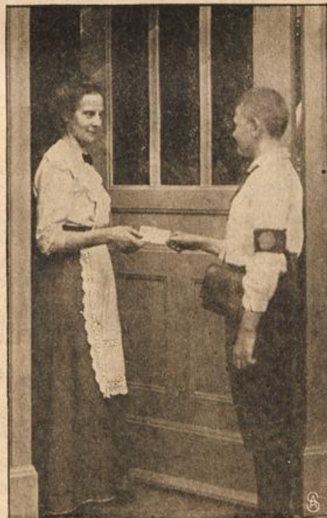
Ein Gymnasiast als Telegraphenbote.