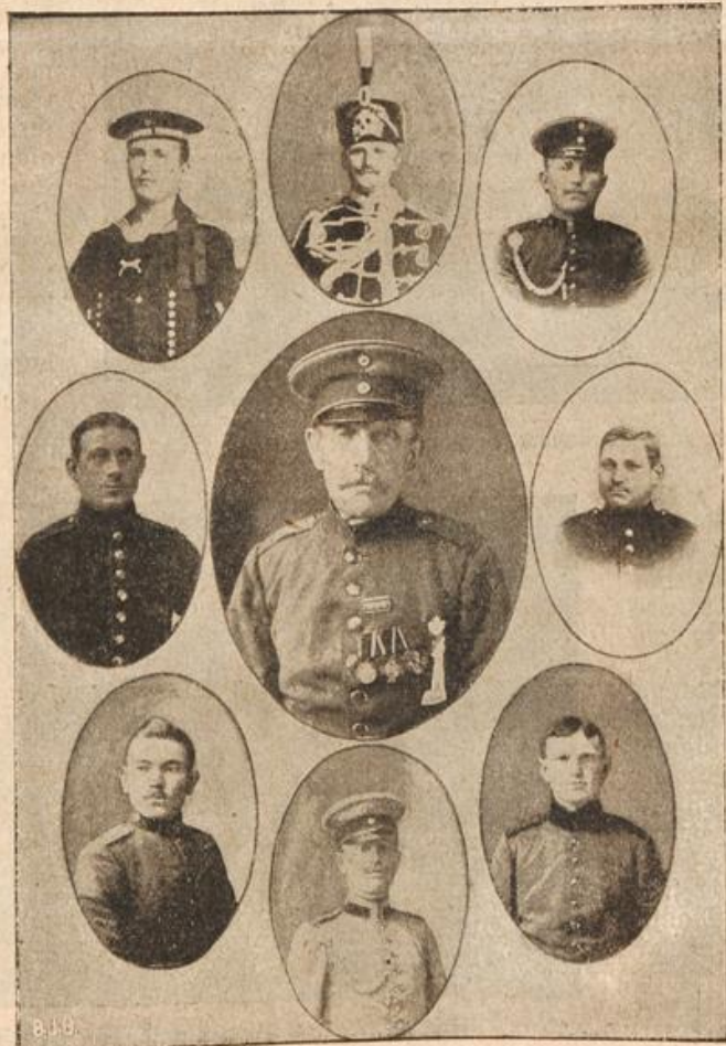
Acht Söhne kämpfen für Kaiser und Reich.

... von Hans N. Osman. (Nachdruck verboten.) 9. ... von Kocziorowski stand im ... Zinsfischen Wohnzimmer, ... als Arbeitszimmer benutzte, ... einen Schreibtische und blickte ... eine elegante Einladungskarte ... Konsul Freiland, der Be- ... von Stebenhagen, gab sich die ... zur Hirschjagd Herrn Jan ... Kocziorowski einzuladen. Die ... hagenener Jagd war berühmt ... die meisten der prachtvollen ... die in der Halle des Mal- ... Herrenhauses hingen, ... aus den ausgedehnten ... des schönen Waldgutes — ... seiner Zeit her, wo Steben- ... ebenso wie Schlarentin den ... wagens gehörte. ... Jagdeinladung des Stet- ... Großkaufmanns, dem Steben- ... jetzt gehörte, waren deshalb ... ganzen Provinz sehr begehrt, ... der Malchentiner Verwalter ... wohl trotz aller Anerkennung, ... der Gegend durch seine Tüch- ... abgerungen hatte, faun ... solchen Ehre zuteil geworden ... wenn der Konsul nicht Reserve- ... der selben Regiments ge- ... wäre, dem auch er angehörte. ... hatten sich kürzlich in Stettin ... wohin Kocziorowski ab- ... zu einmal fuhr — um „Luft