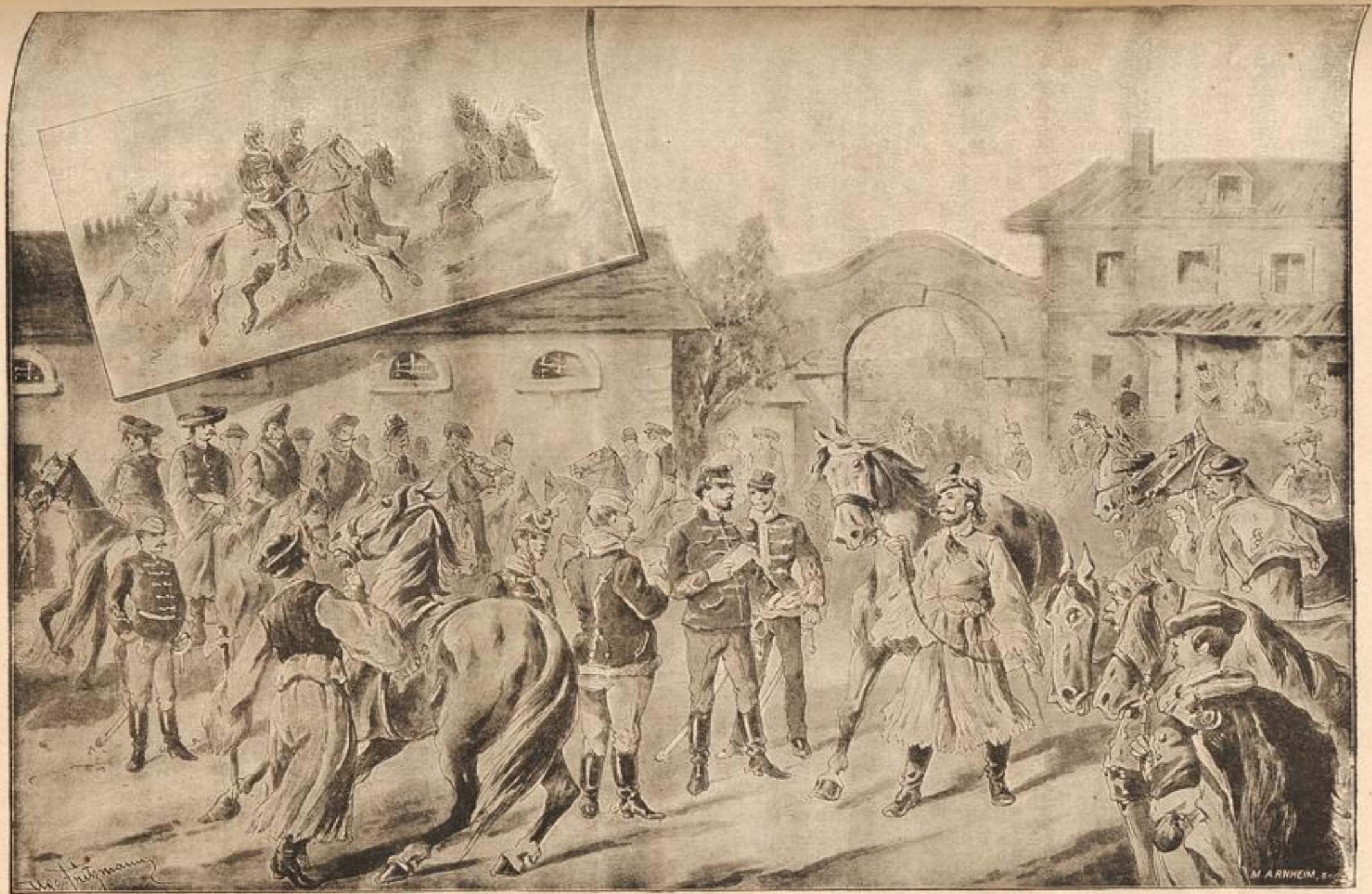
Hushebung zu den ungarischen Honved-Busaren und Attache gegen die Russen. Nach dem Gemälde von Frigmann.