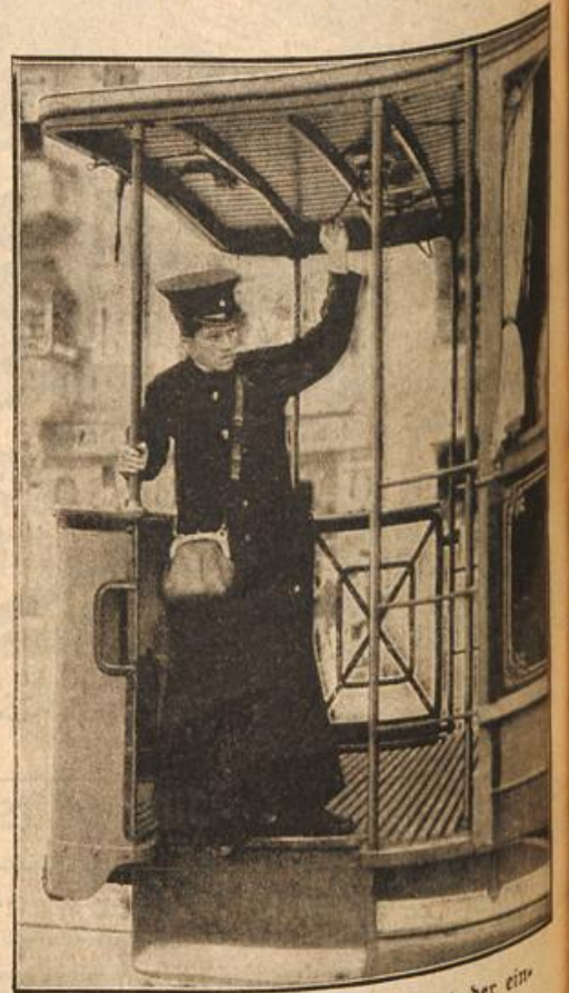
Straßenbahn-Schaffnerin als Ersatz der eingezogenen Schaffner.

„Abend für Abend mit meiner steinernen Braut und dem alten Manne zusammen Trübsal spinnen zu müssen,“ gähnte er jetzt vor sich hin, „das halte ein anderer aus. Daß sehen — der alte Boitek wird heute mit den Vorberei-