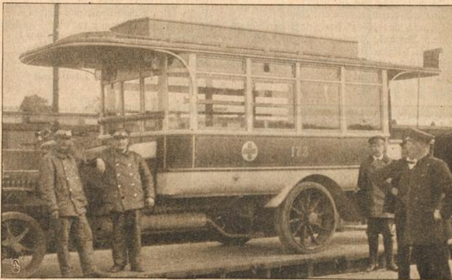
Ein Automobil-Omnibus, der zum Transport Verwundeter hergerichtet ist.

als er anfangs zu hoffen gewagt hatte. Sein Freund hatte ihm, als er ihm von seiner Verlobung und seinen infolge dessen veränderten Zukunftsaussichten Mitteilung machte, in so selbstloser und so selbstverständlicher Herzlichkeit Glück gewünscht — ja, er hatte sich ihm sogar, falls er seiner irgendwie bedürfen sollte, in jeder Weise zur Verfügung gestellt, daß Koczjerowski sich doch etwas beschämt gefühlt hatte, weil er gegenüber Annemarie gewissermaßen mit seiner Abhängigkeit von Neufkirch kokettiert hatte. — Aber er war nicht derjenige Mann, sich nachträglich unnötigen und unbequemen Gefühlen zu überlassen.