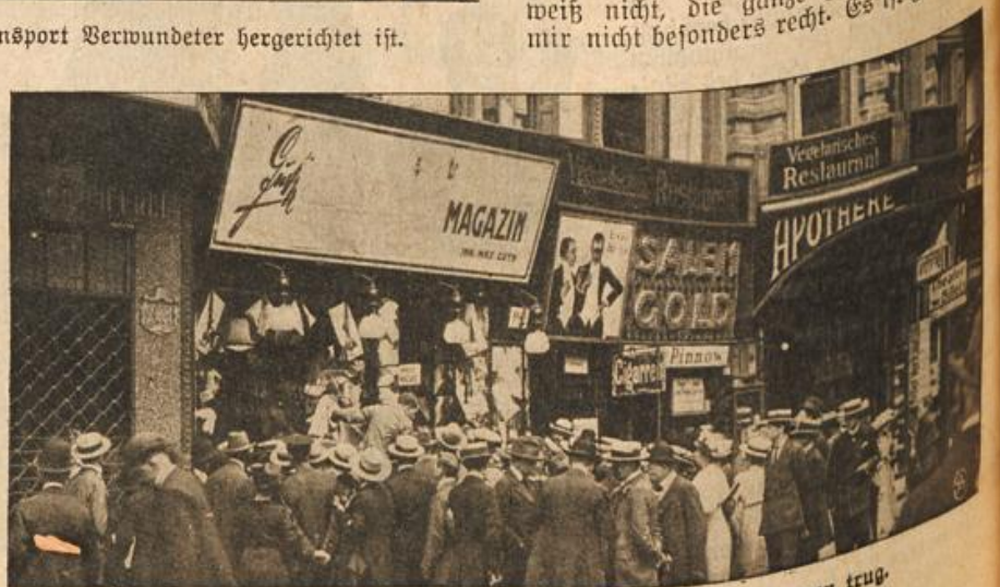
Ueberstrichenes Firmenschild, das fremdländische Bezeichnungen trug.

„Nun ja,“ knurrte der Baron, „ich weiß nicht, die ganze Heimlichkeiterei ist mir nicht besonders recht. Es ist gut, daß