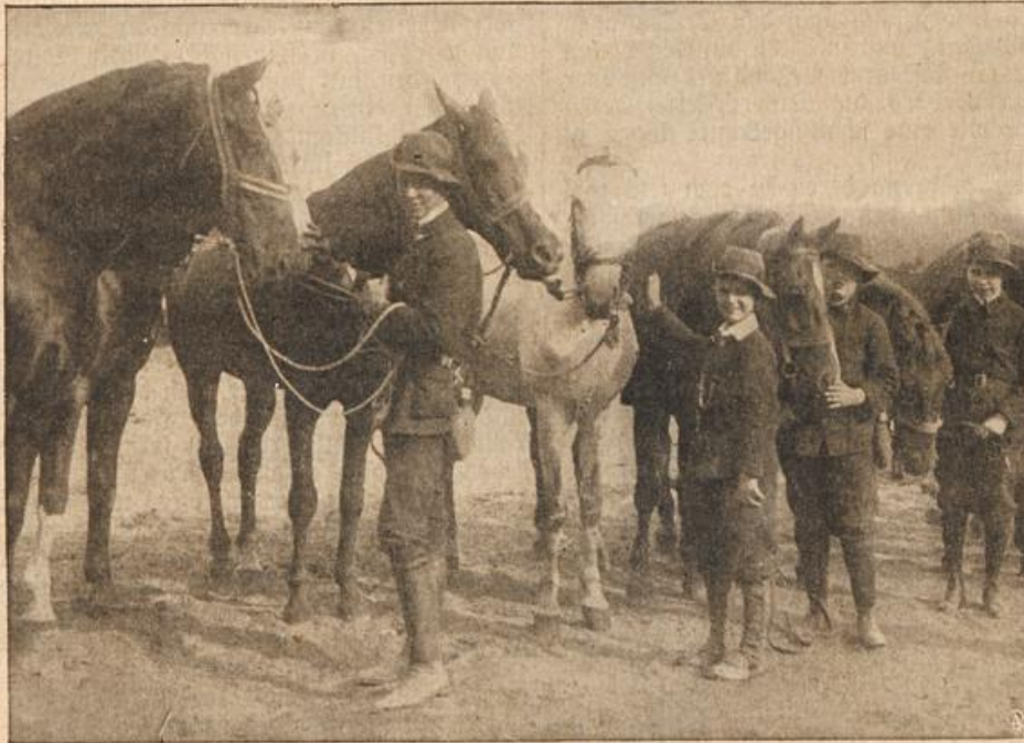
Schüler im Dienst des Vaterlandes: Pfadfinder als Pferdehalter.