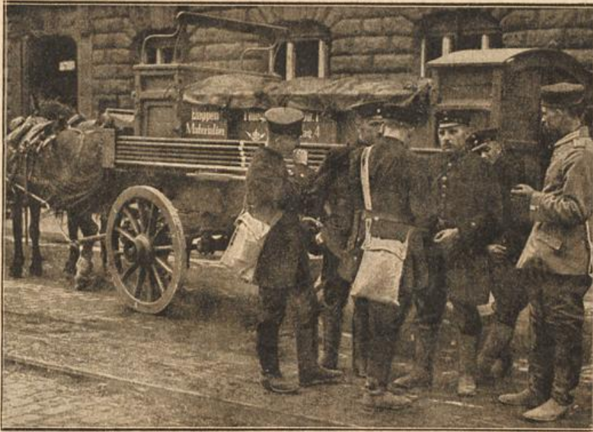
Etappenwagen der Feldpost mit Briefträgern.

als er anfangs zu hoffen gewagt hatte. Sein Freund hatte ihm, als er ihm von seiner Verlobung und seinen infolge dessen veränderten Zukunftsaussichten Mitteilung machte, in so selbstloser und so selbstverständlicher Herzlichkeit Glück gewünscht — ja, er hatte sich ihm sogar, falls er seiner irgendwie bedürfen sollte, in jeder Weise zur Verfügung gestellt, daß Koczjerowski sich doch etwas beschämt gefühlt hatte, weil er gegenüber Annemarie gewissermaßen mit seiner Abhängigkeit von Neufkirch kokettiert hatte. — Aber er war nicht derjenige Mann, sich nachträglich unnötigen und unbequemen Gefühlen zu überlassen.