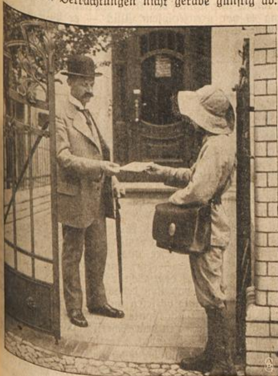
Pfadfinder im Dienste der Reichspost.