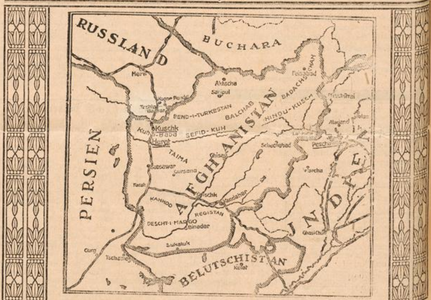
Aufstände aus allen Gegenden des russischen und englischen Reiches werden gemeldet. Besonderes Interesse wird

Ver. Staaten. England stellte an die neutralen Schiffe das Ansinnen, eine absolute Garantie abzugeben, daß die auf diesen Schiffen befindlichen Güter auf keinen Fall für Kriegführende bestimmt seien. Das bedeutet naturgemäß eine schwere Schädigung des amerikanischen Ausfuhrhandels. Deshalb verlangt man vom Staatsparlament, daß es gegen dieses Vorgehen Englands protestiert.