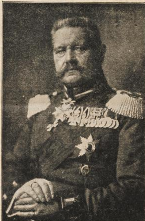
Generaloberst v. Hindenburg Schlug die russische Armee in Ostpreußen.

Recht wie ein Hofes des Glückes steht dort eingebettet in saftiges Grün, ein kleines, idyllisches Schloßchen. Der Blut der Sonnenstrahlen beschütten es die rauschenden Palmen. Seine blinzelnden Fenster schauen auf das weite Meer und glimmern im dunklen Nächten den vorbeiziehenden