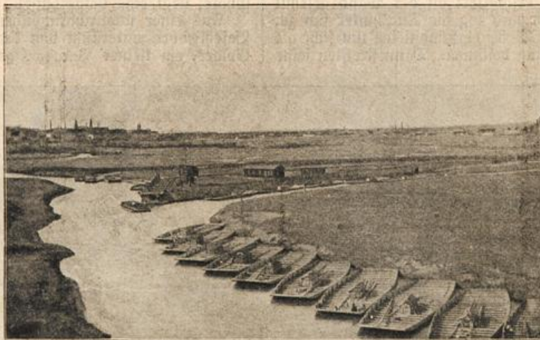
Die Drei-Kaiser-Ecke bei Myslowitz,

„Iwan, — mein armer, armer Iwan, kennst du mich noch? — Seele meiner Seele, schau mir in das Auge. Es ist ja deine Färschinka, deine Maus, die zu dir gekommen ist! — So lange warst du fort — so lange! — Aber ich hab' dich nicht vergessen — nie! Du Armer, was haben sie dir getan? Ach, ich hab' dir ja nicht helfen können. Ins Kloster haben sie mich gesperrt, und wenn ich vor Sehnsucht schrie, dann haben sie mich verlacht, verspottet!“