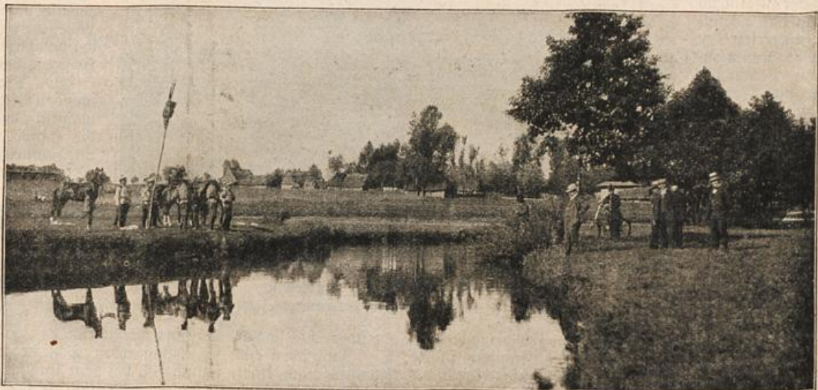
Deutsch-russische Grenze, die in der Mitte des Flüsschens Prosna liegt. Links russische Grenzwahe.

enden Schiffen einen Gruß des Friedens. Und Frieden, heitere, beschauliche Ruhe weilen an diesem Plätzchen, wohin die Großfürstin ihren Jugendgeliebten gerettet hat vor dem Haß, der Bosheit der Menschen.