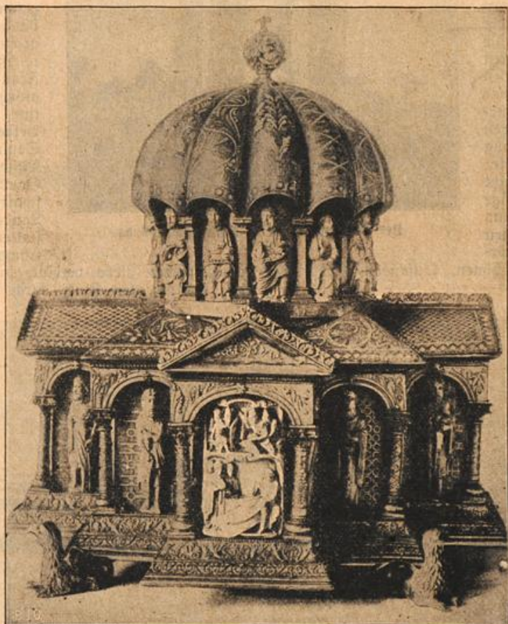
Das grosse Kuppel-Reliquiar.

Dieser war ein ernster Junge, der ein glänzendes Beispiel männlicher Charakterfestigkeit an seinem Vater