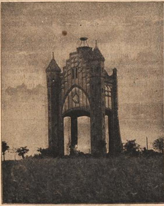
Der Bismarck-Turm in Rathenow. (S. 2.)

liegende Osterien. Doch gerade diese Gräberlandschaft aus allüberall historischer Boden, fernab noch immer, wie einst, das ewige Brauseliend und die liebliche Bläue des Tyrrhenermeeres, prägen sich unauslöschlich der Seele des Reisenden ein.