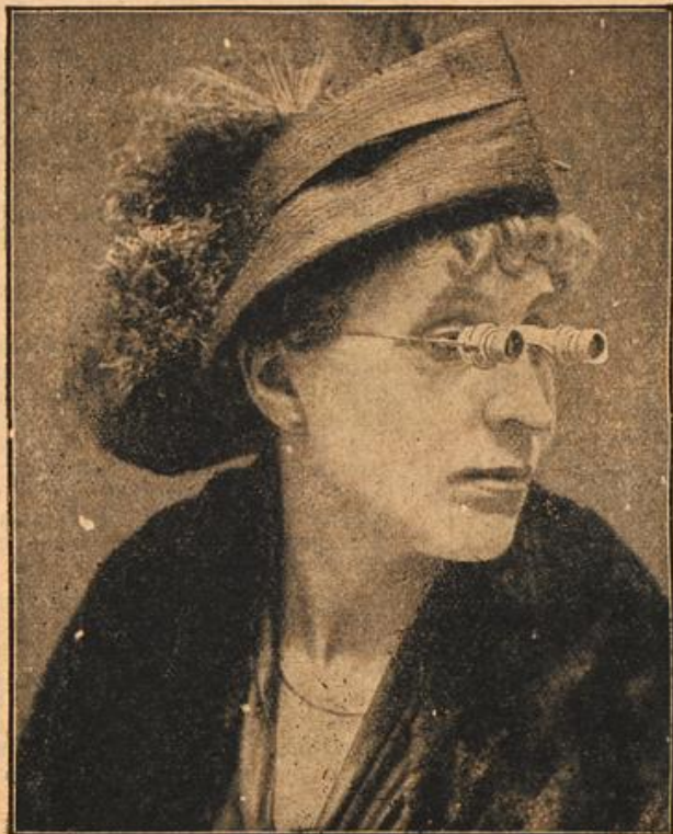
Eine Opernglasbrille als Neuerung für Theater- und Curbesucher.

An einem Juliabend klopfte es an Muzattis Thor: Fahrendes Volk begehrte Einlaß. Es waren Zigeuner. Zwei Männer und eine Frau. Sie baten den Bauer um Obdach. Als Lohn