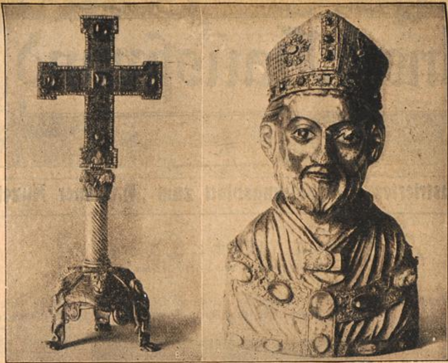
Das Welfenkreuz und die Ferme des Heiligen Blasius.