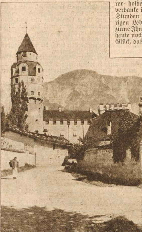
Der Münzturm in Hall am Inn. (Mit Text.)

Dieser Brief hatte mich tief ergriffen: ich wollte ihn sogleich beantworten, ihn meiner unveränderten Liebe — aber da stiegen wieder neue Zweifel in mir auf. Er hat Vorwürfe benützt, sagte ich mir, um unsern Herzensbund zu und nun verböt mir mein Stolz, auch nur ein Wort zu Bekannte, und In Marienbad angekommen, trafen wir Bekannte, und hatte das brillante Badeleben mich derart gefesselt, daß ich von dem ich nichts weiter hörte, vergaß. Ich lernte unter