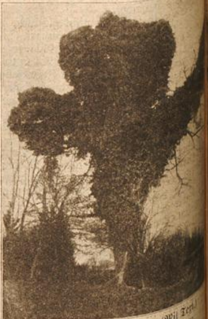
Ein seltsamer Baum. (Mit Text.)

Flehen Sie um Sie um Geben. Vertrauen in mich, in die Zukunft. Sie haben beides verloren! Sie begreifen