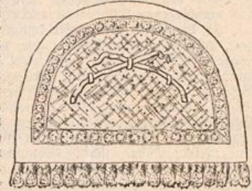
Innenansicht des Häubchens.

zu einer vollen duftigen Schleife gebunden werden, bestehen ebenfalls aus Clif- fon. Die zweite Abbildung zeigt an dem ausgebreite- ten Häubchen die Innenansicht. Es sind hier drei Osen genäht, durch die zwei schmale weiße Bänder geführt werden, welche rechts und links angenäht wurden. Zieht man diese Bänder an und bildet sie zu einer kleinen Schleife, so entstehen die an dem Häubchen sichtbaren Tollen. Man kann beliebig weit binden, je nach der Größe des Köpfchens. In der Wäsche werden die Bänder aufgebunden, und hierdurch sind die Mäuschen äußerst praktisch, denn man hat ein glattes Stück zu waschen und zu bügeln. Im Hochsommer zu den weißen oder hellen Wäschelein- dern sehen diese Mäuschen stets frisch und hübsch aus.