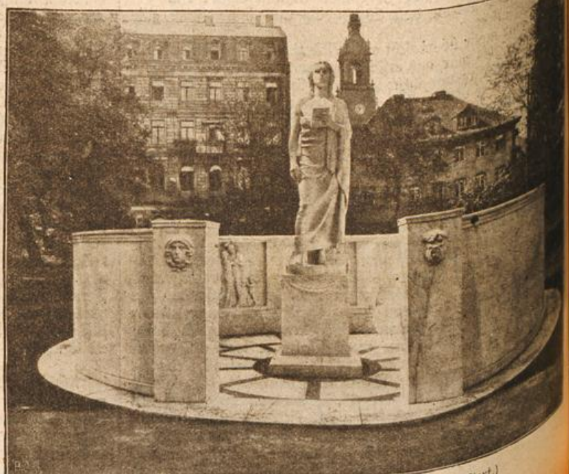
Das neue Schiller-Denkmal in Dresden. (Mit Text.)