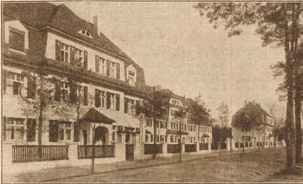
Die neuen Eisenbahnbeamtenhäuser in Coswig i. S. (Mit Text.)

Ich war zu jung, zu frivol, um ihn zu verstehen, ich wollte ihm alles sein, sein Gott, seine Welt, er sollte außer mir nichts denken und nichts wünschen. Und so quälte ich ihn und mich, da ich an seiner Liebe zu zweifeln begann. Und nun hier sein letzter Brief: