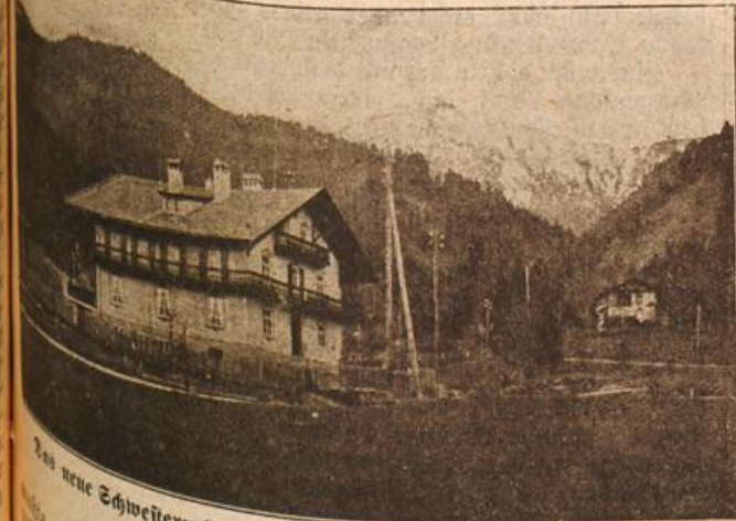
Das neue Schwestern-Erholungsheim am Walchensee. (Mit Text.)