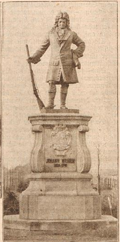
Das Johann-Wilhelm-Denkmal zu Mülheim a. Rh. (Mit Text.)