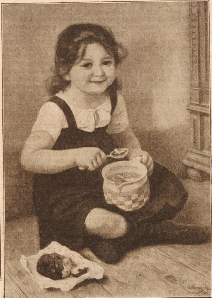
Morgenbrot. Von C. v. Bergen. (Mit Text.)

...man wußte Liselotte genug. Scharlach hatten die Kleinen ... Das konnte unter Umständen schlimm verlaufen. Sie