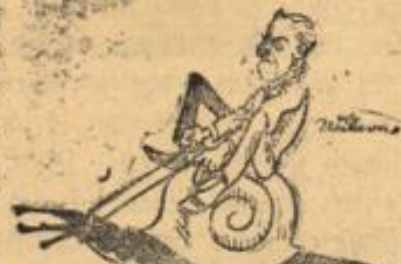
Die Hilfe kommt, die Hilfe kommt, sie ist schon unterwegs!

kurz kommen bei diesem Vertrage, Herr von Verlach, denn mit meiner Weisheit sieht es doch nämlich aus. Und was wollen Sie auf Ihrem strahlenden Sonnenwege mit dem ernstesten Sinnen eines Nachdenkens, dessen Parole Entfaltung heißt?