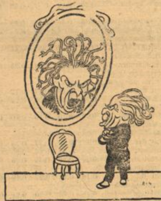
Lloyd George: „Spieglein, Spieglein an der Wand, wer ist der Schlimmste in England?“