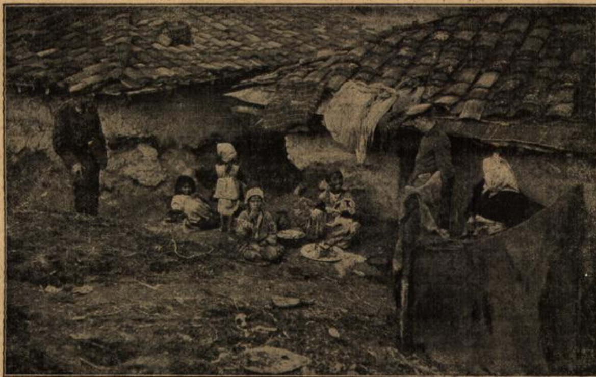
Ein Balkanidyll: Unsere Feldgrauen in einem Albanerdorf im westlichen Mazedonien.

Plötzlich dachte er an seinen alten Arzt daheim und an dessen Worte; — der Born des Lebens ist die Liebe allein; ja, er hatte recht gehabt, der gute Alte. — aus der Liebe allein floß die Kraft,