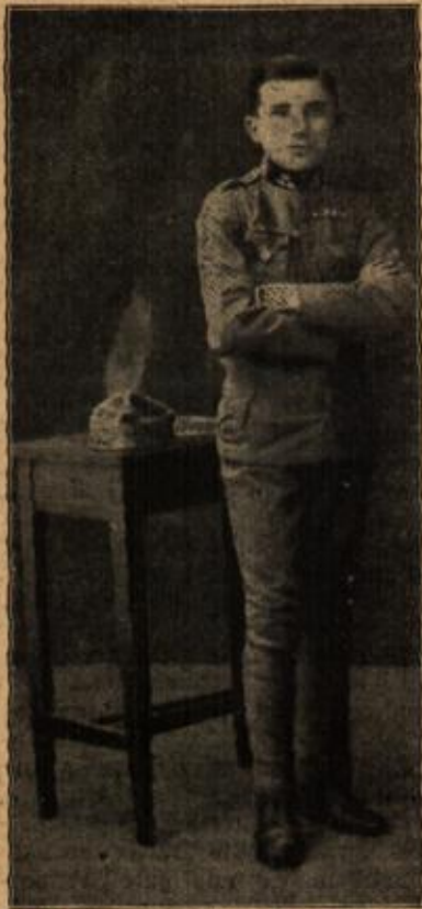
Ein 16jähriger Österrich. Zugführer. (Mit Text.)

„Jawarum denn nicht, liebste Mutter? — Der dumme Lungenpitzenkatarch ist endgültig und völlig verharrt und verheilt, das hat dir Doktor Kl-