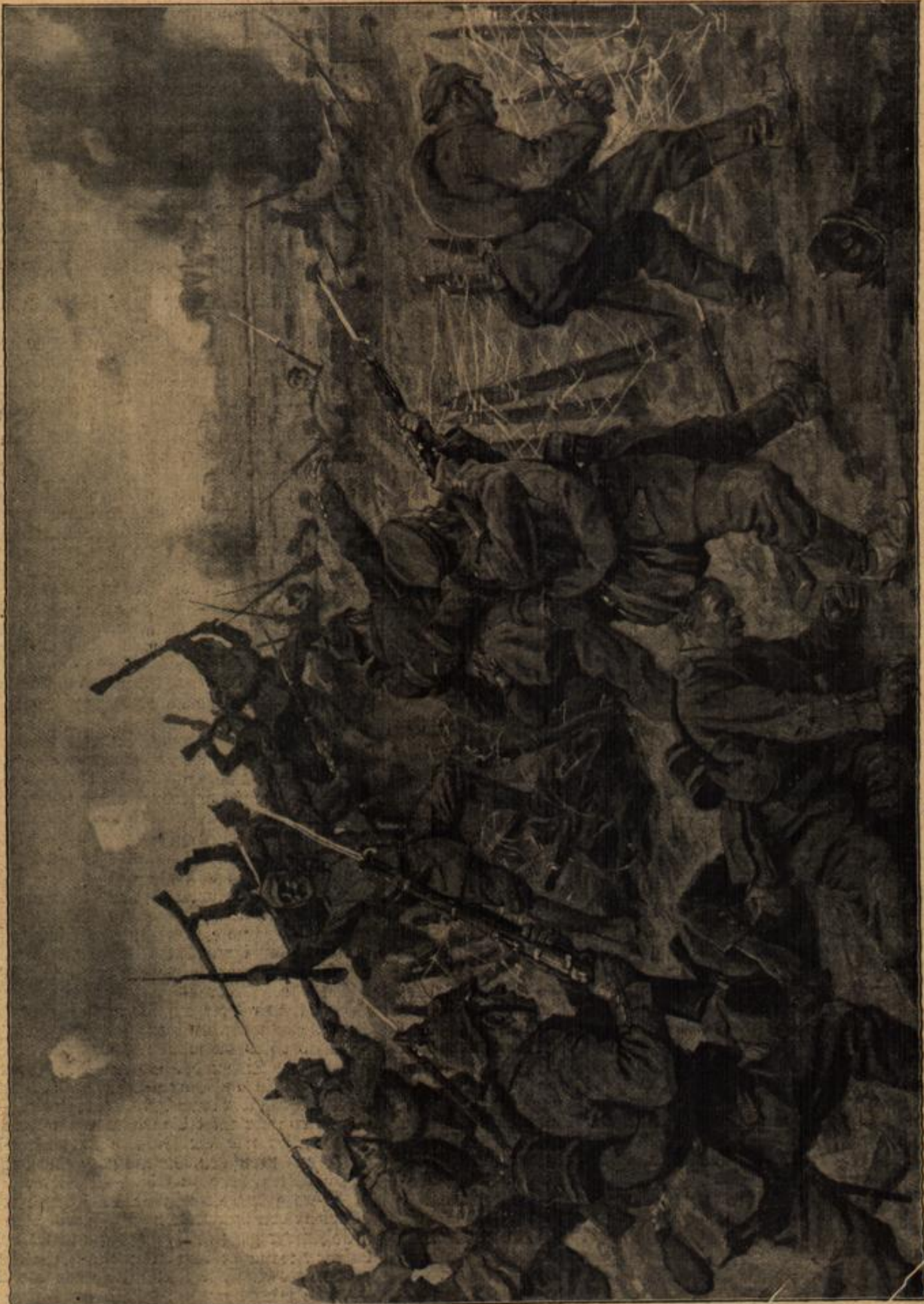
Sturm. Zeichnung von Alfred Hölzl.

Er schlug die Papierhülle auseinander. Eine künstlerische