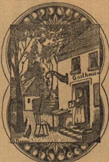
Wo sind die beiden Gäste?

Anlaß zur Blutvergiftung als größere Wunden; denn ihnen fehlt der natürliche Wundschutz, die Selbstreinigung durch das fließende Blut und der nachfolgende, von selbst eintretende Luftabschluß. Der fortwährend an dem Eiterherde vorbeifließende, gewissermaßen ledende Blutstrom führt Teile des Eiters mit Eitererregern fort, oft durch das ganze Adernetz, wobei sie sich an einer beliebigen Stelle, vielleicht aufgehalten durch die geringe Weite kleinerer Äderchen, festsetzen und sofort eine neue Eiterung erzeugen. Derartige Eiterherde können sich oft in kurzer Zeit in großer Anzahl bilden, bald wird das ganze Blut verjaucht und vergiftet. Am schnellsten jedoch verläuft die immer tödlich endende Bildung eines Eiterherdes in einem edleren Körperteile, z. B. im Gehirn.