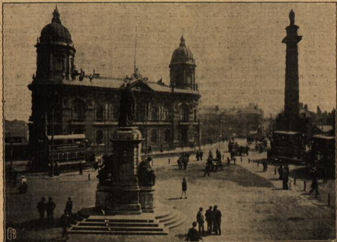
Der Vittoria-Platz in Genua, das Verkehrszenrum der Stadt. (Mit Text.)