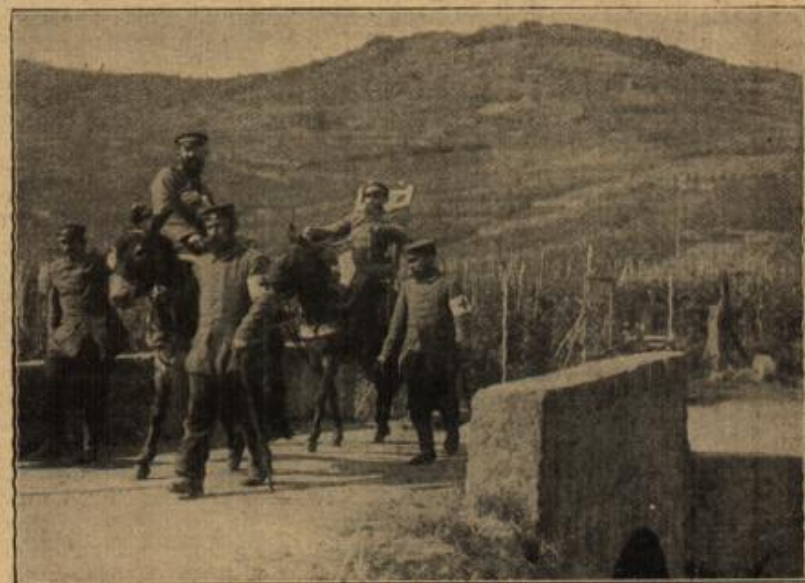
Verwundetentransport in den Vogesen.

sprächen die bärtigen Lippen wie einst: „Im Glück nicht stolz, im Unglück nicht verzagt!“ — Und diese Worte rüttelten ihn auf.