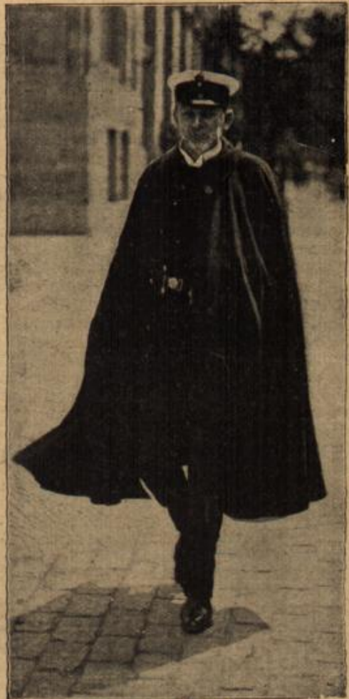
Admiral Eduard v. Capelle, Nachfolger des Staatssekretärs v. Tirpitz. (Mit Text.)