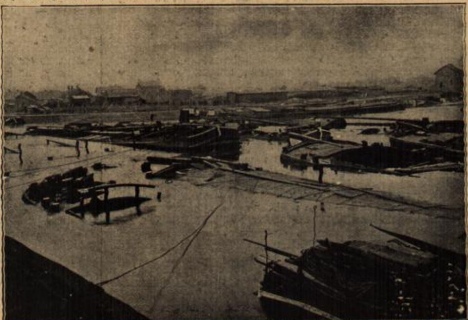
Der Hafen von Channy an der Rione. (Mit Text.)

Sühne würde das nicht sein. Vor kurzem hatte er in Sudermanns „Es war!“ ein Wort gelesen, das sich ihm tief in die Seele prägte: „Nichts bereuen, aber besser machen!“ Und das wollte er, er schwur es sich zu in diesem Augenblicke, wo in der Not und