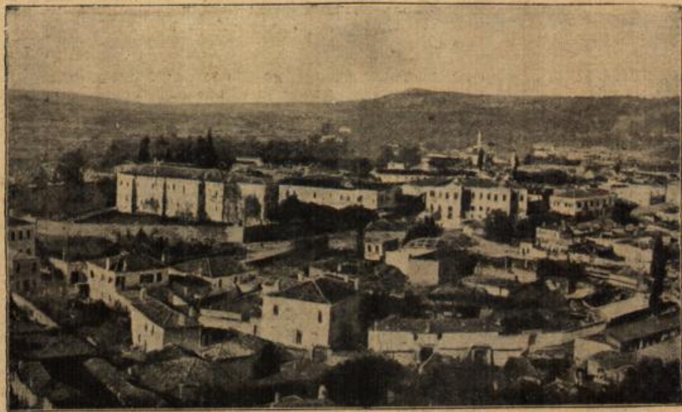
Panorama von Balona in Albanien.

sprächen die bärtigen Lippen wie einst: „Im Glück nicht stolz, im Unglück nicht verzagt!“ — Und diese Worte rüttelten ihn auf.