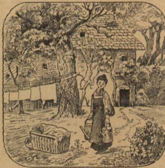
Wo ist das Brot zu haben zum Waschen und Waschen?

das liebe, tägliche Brot verlangt noch andere Rücksicht: „Man soll es nach dem Volksglauben nicht auf seine gewölbte Seite legen“, es darf „nicht in die Stube sehen“, d. h. mit dem Abschnitt nicht über den Tischrand schauen.