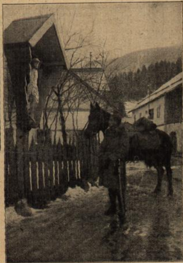
In stiller Andacht.

Bereits zehn Minuten später klopfte an die Tür von Nummer 36 der Zuschneider eines benachbarten Herrenkleidergeschäftes, nahm dem