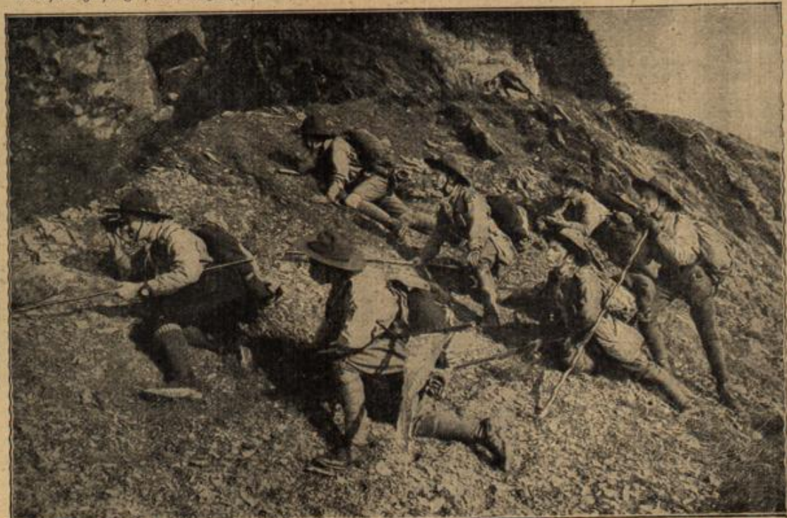
Militärische Jugenderziehung in Österreich: Wiener Pfadfindergruppe bei einer Geländeübung. Altophof, Wien.

— Nach kaum einer halben Stunde war der Herr von Nummer 36 neu ausgestattet. Er schalt zwar noch recht tüchtig, daß er einen sehr schlechten Tausch mache, denn sein Anzug wäre viel gediegener gewesen, auch die Stiefel seien lange nicht so gut, als die feineren gewesen waren. Da indessen der Wirt immerfort bat und ihn beschwor, daß er keinen Skandal machen möge, und da er ihm endlich