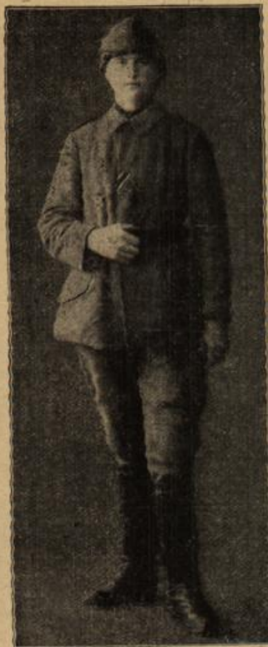
Ein Mehrgeselle, Ritter des Eisernen Halbmondes. (Mit Text.)

mein Herr! Sie stören mir ja alle meine anderen Gäfte! Ihr Anzug wird sich ja finden.“ „Finden? Wo soll er sich denn finden? Ich habe ja bereits alle Sachen durchgesehen, die unten sind! — Sie haben eben einen Dieb im Hause. Wo lassen Sie gefälligst sofort die Polizei holen. Meine Zeit ist nämlich sehr knapp.“