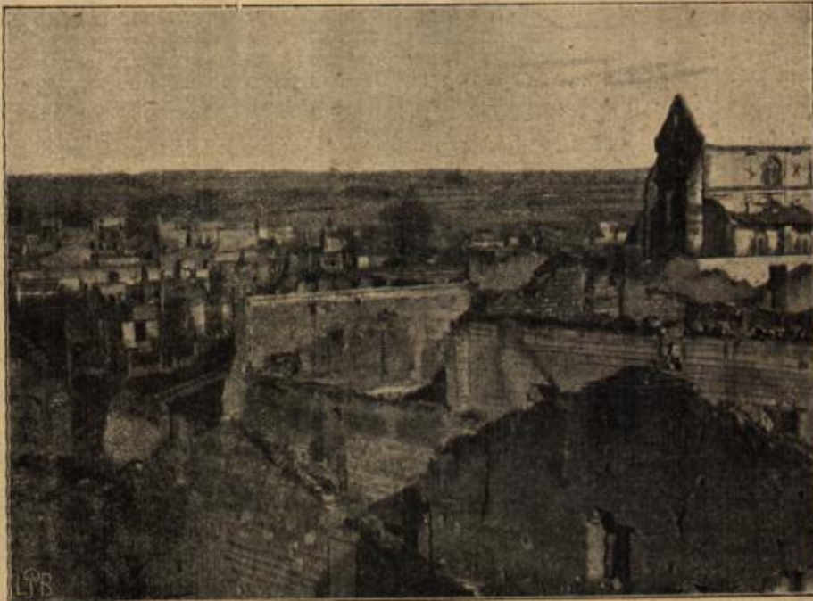
Ansicht von Comme-Py in der Champagne.

mein Herr! Sie stören mir ja alle meine anderen Gäfte! Ihr Anzug wird sich ja finden.“ „Finden? Wo soll er sich denn finden? Ich habe ja bereits alle Sachen durchgesehen, die unten sind! — Sie haben eben einen Dieb im Hause. Wo lassen Sie gefälligst sofort die Polizei holen. Meine Zeit ist nämlich sehr knapp.“