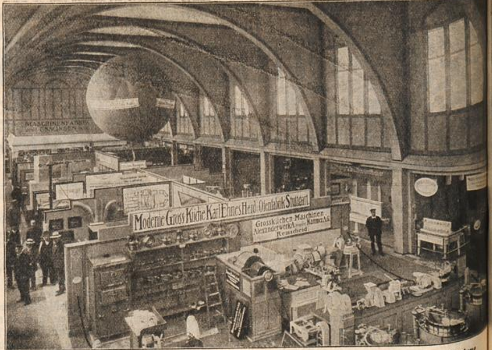
Die Ausstellung für Gesundheitspflege in Stuttgart: Abteilung für angewandte Hygiene in Haus und Wohnung. (S. 112)

Müller legte ihn auf den Boden und schwang sich dann zu der