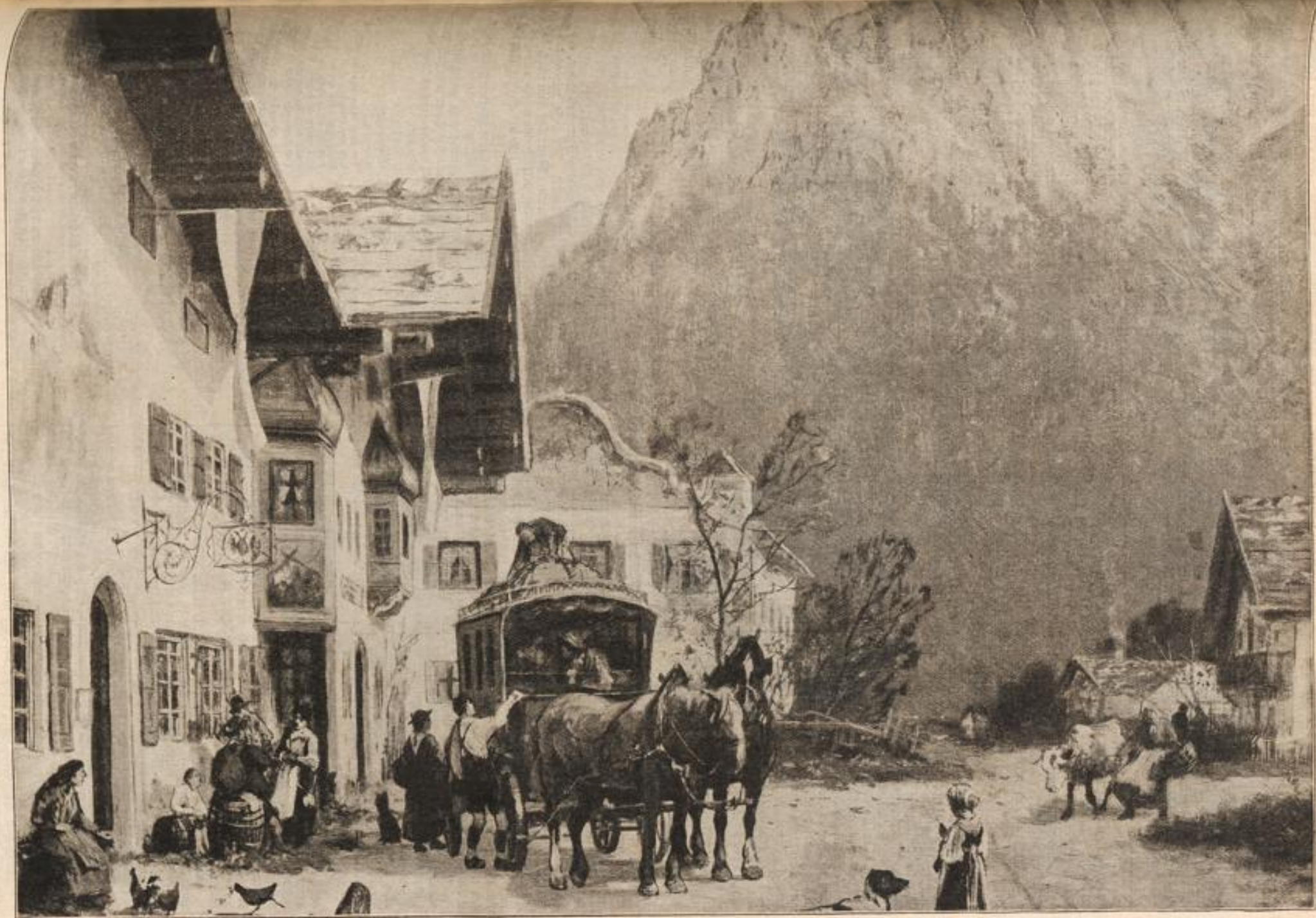
Vor der Abfahrt. Nach einem Gemälde von D. Fedder. (S. 112)