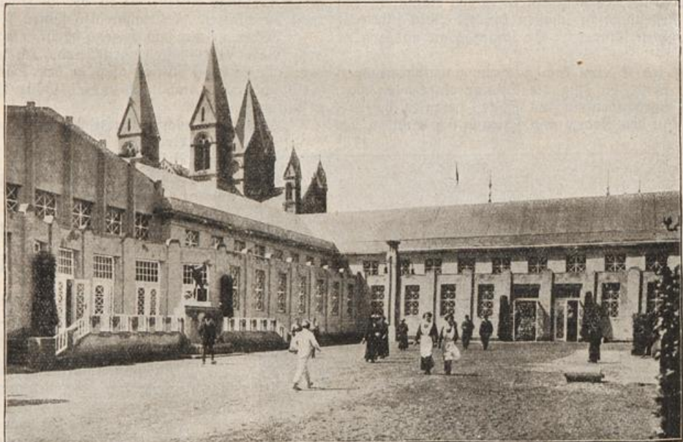
Die Ausstellung für Gesundheitspflege in Stuttgart: Halle für Körperhygiene. (S. 112)

Wieder gab ein Teil der Kohle nach und glitt mit Müller bis auf den Grund hinab. Müller war nicht zu Fall gekommen. Er schaute sich jetzt genauer um und überlegte. „Warum ist der Mann nicht durch das Haustor entwichen? Hat er zu wenig Geduld gehabt, um dessen