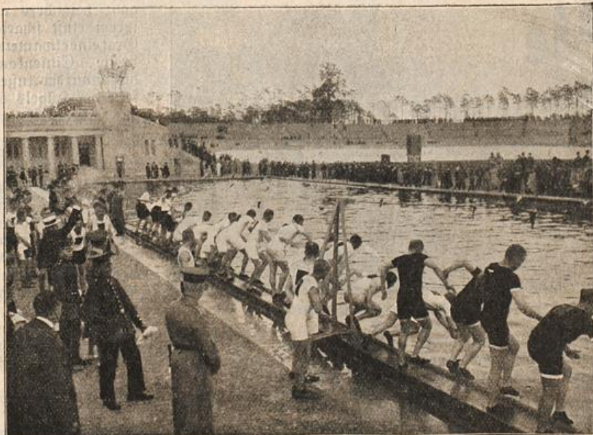
Von den Armeewettkämpfen: Start zum 800-Meter-Mannschaftshindernislauf. (S. 112)

„Da sieht man, daß Sie noch nie einen Mörder“