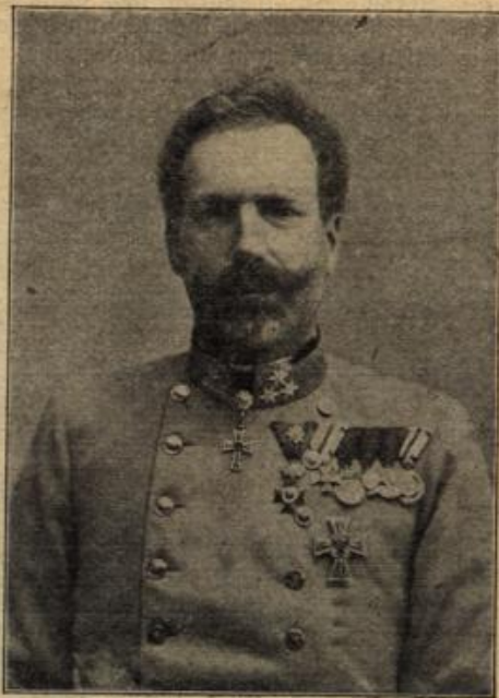
Erzherzog Eugen von Österreich. (Mit Text.)

Und dann wurde sie plötzlich wieder an die Zeit gemahnt, die zwischen ihrem Verlöbniß und dem Heute lag, die Zeit, da sie Richard von Falkenstedt ganz aus ihrer Seele und Erinnerung gestrichen hatte. —