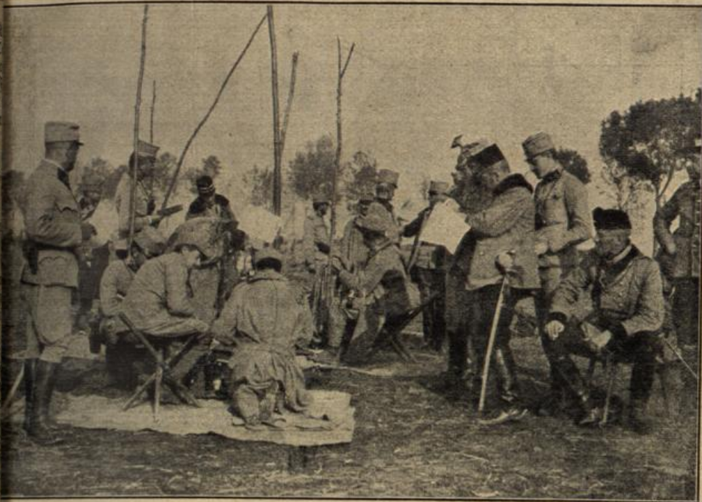
Österreichisch-ungarische Korps-Telephon-Station. (Mit Text.)

jönlichkeit. Und auch Melanie von Falkenstedt fragte beim Abschied nicht nach ihr — die Aufmerksamkeit, die man ihrem stattlichen Mann entgegenbrachte, schmeichelte ihr mit einem Male wieder. Wie damals, als sie sich mit ihm verlobte, war etwas