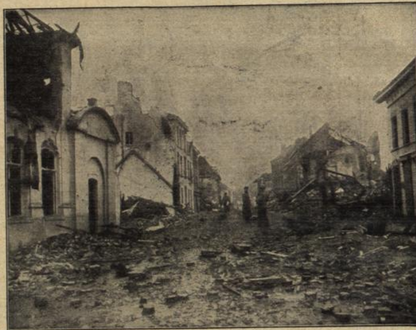
Straße in Dignuiden, das nach heißen Kämpfen von den deutschen Truppen erobert wurde.