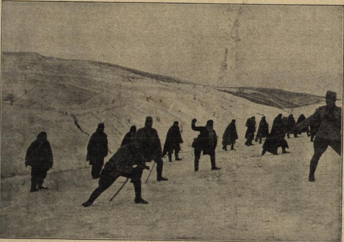
Vom Kriegsschauplatz in den Karpathen: Eine österreichische Erkundungspatrouille in den schneebedeckten Bergen.