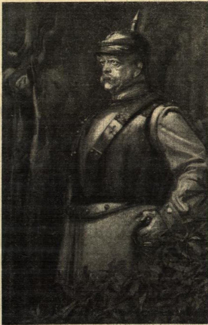
Zum hundertjährigen Geburtstag des Fürsten v. Bismarck (1. April). (Mit Text.)