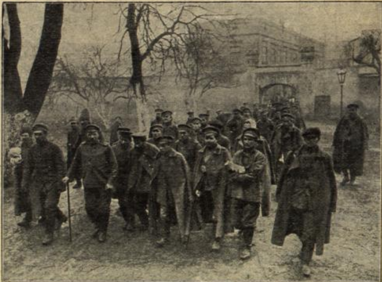
Verwundete Russen werden in ein deutsches Lazarett gebracht.

Testament zu Ihren Gunsten heute vormittag nach erstem Schlaganfall. Soeben zweiter Anfall. Ableben stündlich zu erwarten. Ihr Verwandter wünscht Sie noch zu sehen. Sofort kommen.