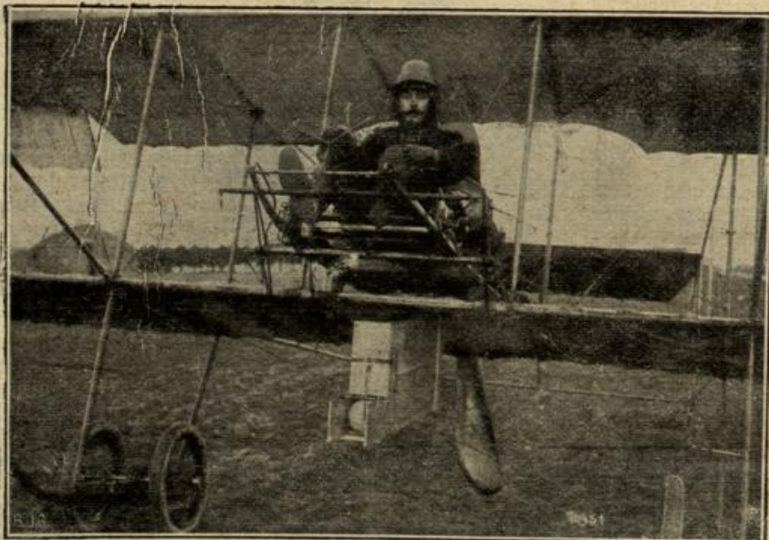
Ein Flugzeug mit Bombenwerfer. (Mit Text.)

Der Nachrichtendienst im Kriege ist von der größten Wichtigkeit. Pferd, Fahrrad, Automobil, Telephon und Telegraphie sind in weitgehendem Maße in seinen Dienst gestellt. Aber es gibt noch ein Mittel, das sich nicht nur Nachrichten im eignen Land möglichst schnell übermitteln, sondern auch dem Ausland die Verbindung sicher zu bieten, aber mit Europa nur einige Kabel für den telegraphischen Verkehr verbunden und insbesondere Deutschland ist in dem günstigsten Fall, in dem Krieg über gar keine direkte, eigene Kabelverbindung mit den Vereinigten Staaten und seinen neuen Kolonien zu verfügen. Es ist der gegnerischen richterstattung gegenüber nun aber äußerst wichtig, daß eigene, direkte Verbindungen auch in neu eroberten Ländern möglichst rasch hergestellt werden. Die Technik hat für schon vor dem Kriege ein Mittel geboten, dessen Hilfe man mit entlegenen Orten verkehren kann, ohne daß eine direkte Verbindung mit demselben notwendig ist, wie die leicht zu schneidenden Kabel es sind. Es ist dies die sogenannte drahtlose Telegraphie. Sie hat schon in den Friedenszeiten den verschiedensten Zwecken gedient, insbesondere dem Verkehr mit See befindlichen Schiffen und der genauen Zeitübermittlung den Sternwarten aus. Jetzt ist sie ein hervorragend wichtiges