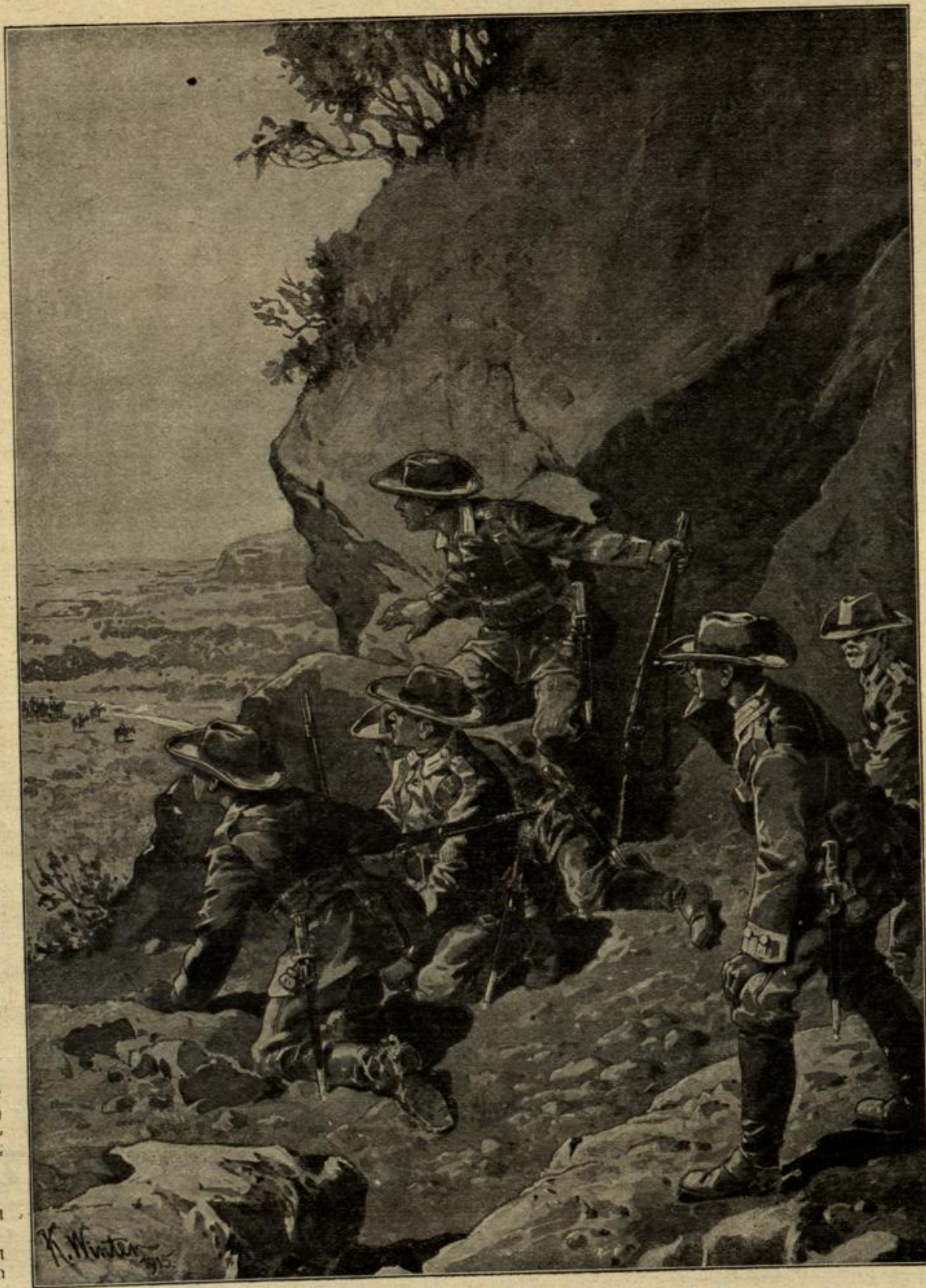
Vom Kriegsschauplatz in Deutsch-Südwestafrika. (Mit Text.)

Wichtig ist nun aber in der Kriegszeit besonders eins. Die Wellen, welche der Sendeapparat als Zeichen abschickt, können eine beliebige Länge besitzen, aber nur ein Apparat, der die bestimmte ab-