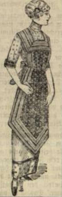
Zierschürzen in weiß und bunt die neuesten Formen.