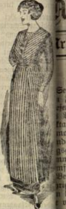
Blusenschürzen in weiß, schwarz, farbig in groß. Ausw.