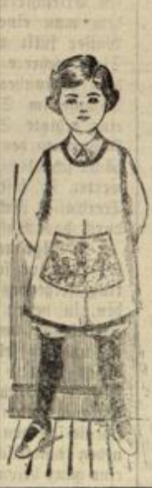
Knabenschürze in allen Größen und jeder Preislage.