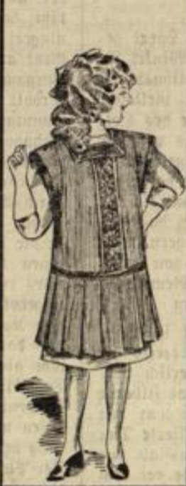
Kinderschürzen stets das Neueste! in allen Qualitäten.