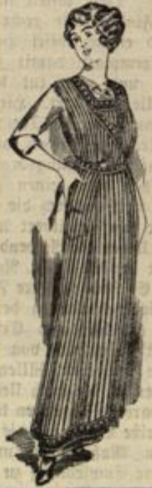
Blusenschürzen in allen Farben und Formen höchst preisw.