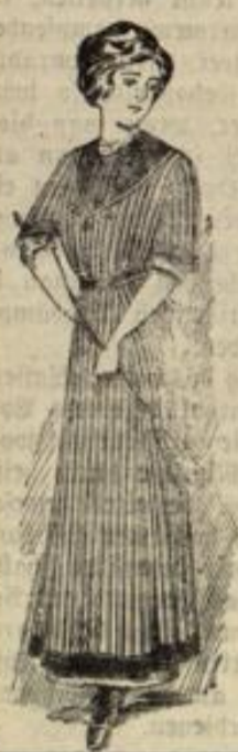
Kleiderschürze mit und ohne Ärmel in allen Preislagen.