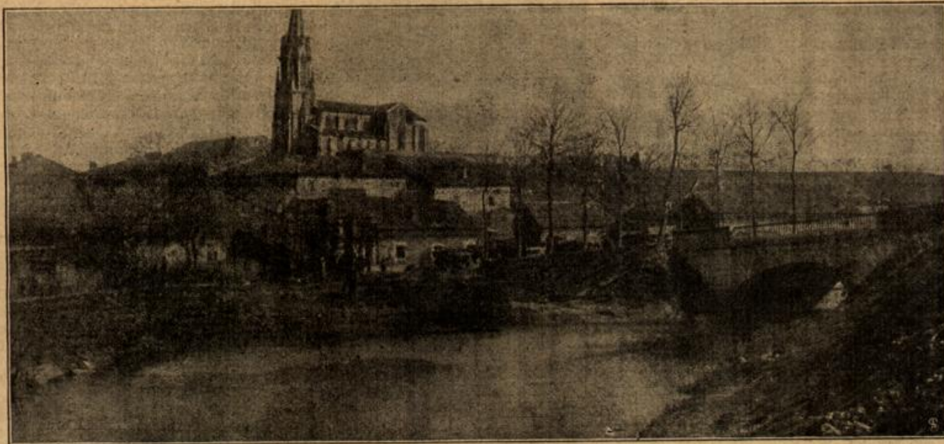
Aus dem Gelände von Verdun: Die Ortschaft Pannes im Woëvregebiet.

Aufnahme aus dem Feld von einem Feldgrauen.