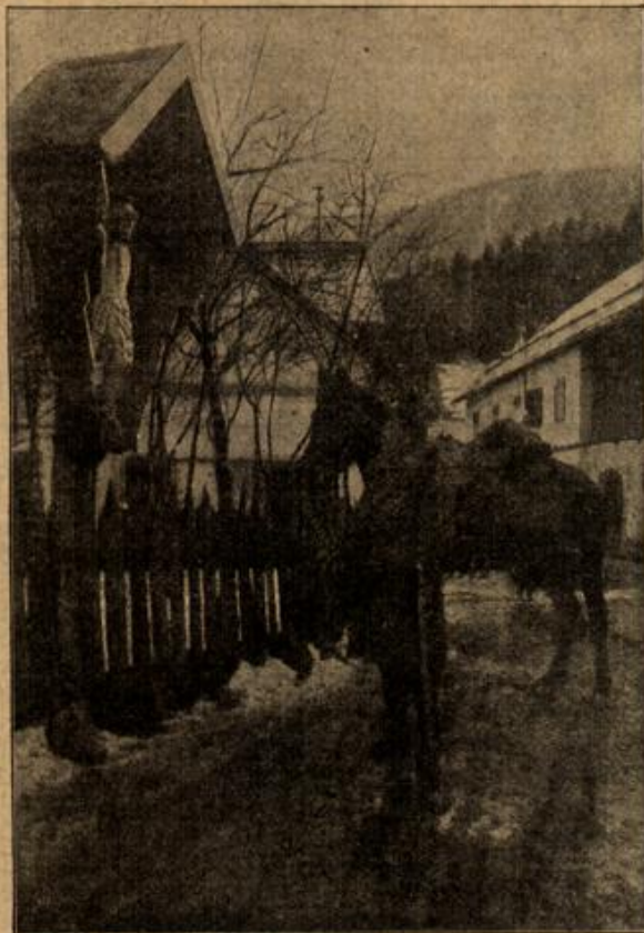
In stiller Andacht.

In dem stillen, schönen Ladinertal endlich hatte Eugeniens