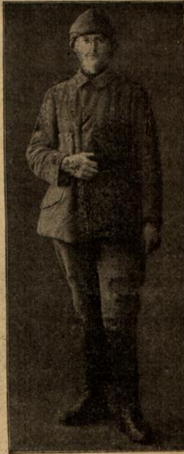
Ein Mehrgeselle, Ritter des Eisernen Halbmondes. (Mit Text.)

heutigen Theaterpublikums begründet, aber für Sie war er doch ein solcher, daß Sie jener „Landaradei“ erzeugenden Augenblicksstimmung dankbar sein dürfen. Ich darf aber wohl annehmen, daß Sie uns dies alles nicht erzählt hätten, wenn Sie als guter Menschkenner nicht sofort herausgefunden hätten, wie wir darüber denken. Wir unterhalten uns dann und wann