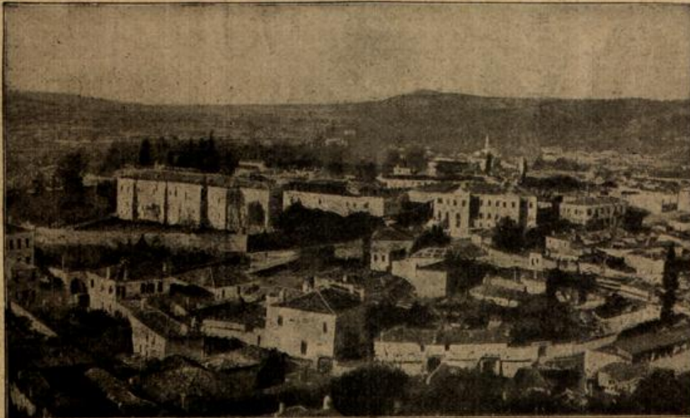
Panorama von Valona in Albanien.

Eugenie war in so froher, glücklicher Stimmung, daß man das ruhige, ernste Mädchen kaum wieder erkannt hätte. Sie war entzückt über die hübschen Pferde, den Wagen, über die Fahrt, und als sie dann Hohen-Eggstein an der Seite ihres Vaters und Bräutigams betrat, als sie die prächtigen Räume mit den alten, gediegenen Möbeln und dem reichgeschmückten Getöse durchschritt, als sie vom Fenster des Speisenzimmers einen Blick in den Park werfen konnte und als sie dann auf der Terrasse stand, von der sich ein unbeschreiblich schöner Blick über die Stadt, weit ins herrliche Etschtal und in die Dolomiten bot, da wurden ihre Augen feucht vor Glück und Freude.