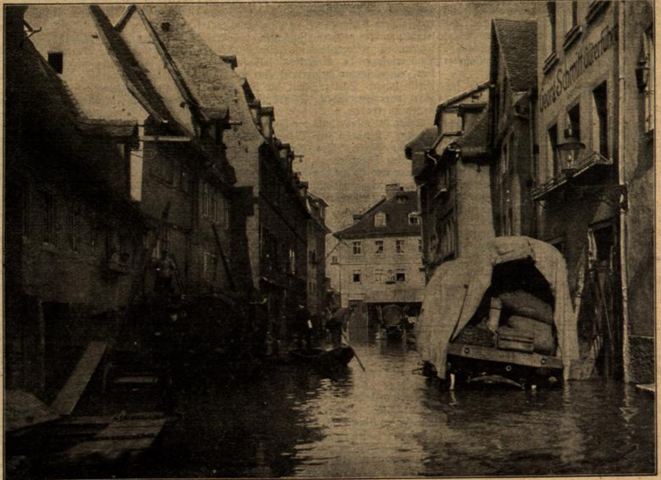
Vom Hochwasser in Würzburg: Die überschwemmte Kärnergasse.

Der durch das Hochwasser an den Gebäuden angerichtete Schaden ist ziemlich bedeutend.