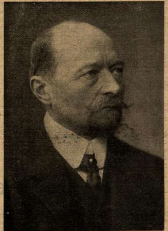
Virkl. Geh. Rat Prof. Dr. v. Behring, der Marburger Hygieniker und Erfinder des Diphtherieheilserums, beging seinen 60. Geburtstag.

Das Hochwasser in Würzburg. Mächtige Dimensionen hatte der Main in dieser Hochwasserperiode; er glich fast seinem Vater Rheiu an Ausdehnung und Tiefe. Malerisch spiegelte sich ferner die „altwürzburger“ Häuserpartie vom Wellenbad bis zum alten Zollamt in den Fluten, die dort den niederen Raibau rasch überschritten hatten. Den eigenartigsten Anblick aber gewährte die Kärnergasse im Hochwasser. Dort war „Venedig“ imitiert, indem der Verkehr mit Rähnen von den dortigen Häusern nach der Stadt vermittelt werden mußte. Der durch das Hochwasser an den Gebäuden angerichtete Schaden ist ziemlich bedeutend.