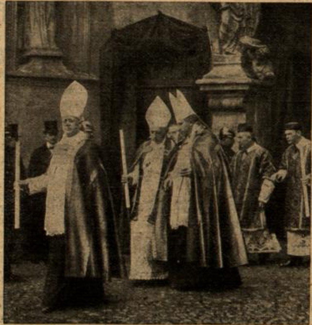
Die hohen geistlichen Würdenträger bei der Ueberführung.

Don der Ueberführung der Leiche des Kardinals v. Kopp von Troppau nach Breslau.