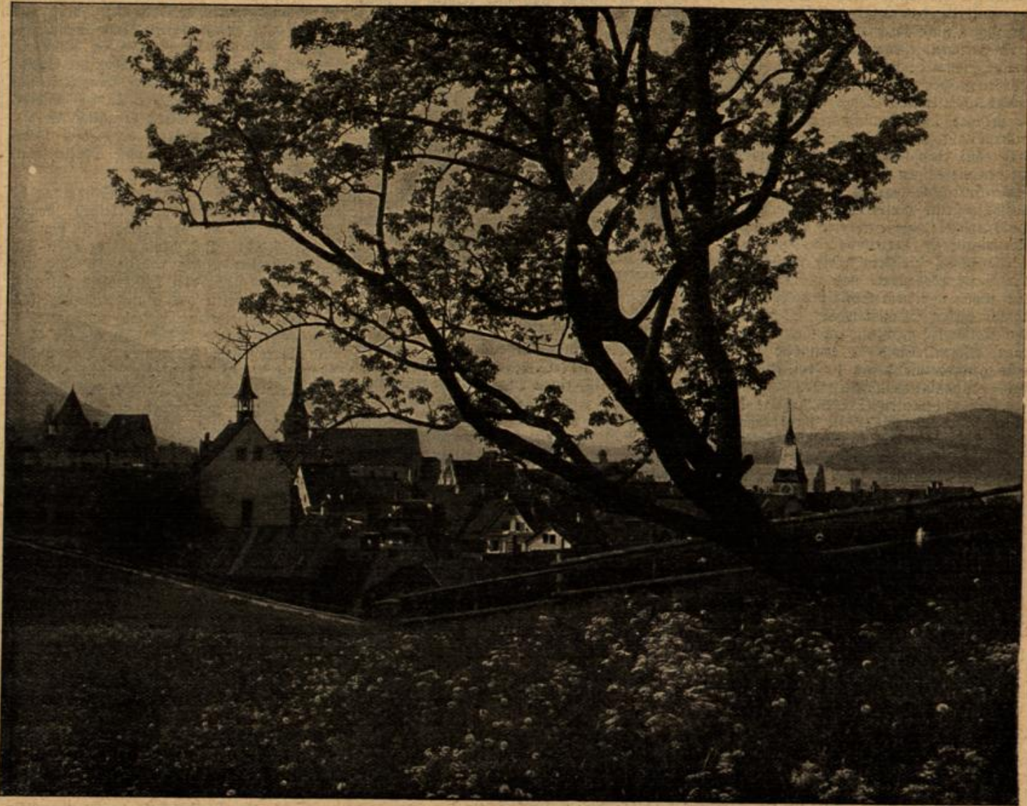
Frühling am Zugersee. o Phot. von H. Rupp, Saarbrücken.