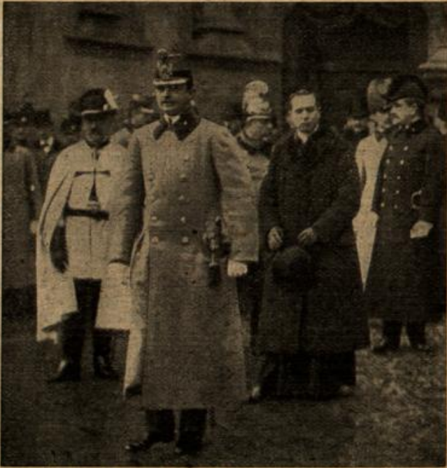
Der künftige österreichische Thronfolger im Trauergesolge.