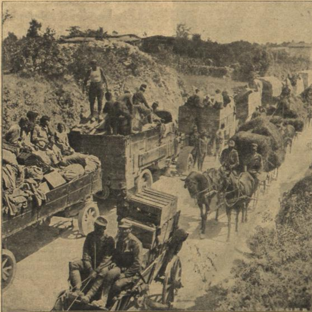
Leben und Treiben auf einer Etappenstraße am Isonzo. Auf den Kraftwagen die flüchtende Bevölkerung.

Seine Schulbildung erhielt Erzherzog Karl Franz Joseph nach den Plänen des Obergymnasiums und genoss einen Teil seines Unterrichts in dem altberühmten Gymnasium des Schottenstifts in Wien. Im Jahre 1903 trat er in die Armee ein, juristische und kunsthistorische Studien an der Universität Prag folgten in den Jahren 1906 bis 1908. Im Frühjahr 1909 lernte der Erzherzog die damals kaum siebzehnjährige Prinzessin Rita von Parma kennen und vermählte sich mit ihr am 21. Oktober des gleichen Jahres. So hat die Doppelmonarchie jetzt wieder eine Kaiserin und Königin und einen Kronprinzen, den am 20. November 1912 geborenen Erzherzog Franz Joseph Otto. Bei Kriegsausbruch war Karl Franz Joseph Oberstleutnant in einem Wiener Infanterieregiment und kam zunächst in das Hauptquartier des Oberkommandanten Erzherzog Friedrich. Die Maioffensive gegen die Italiener 1916 führte den Thronfolger auf den Kriegsschauplatz in Südtirol; später führte er eine Armee in Galizien und hatte zuletzt das Kommando in Siebenbürgen. So hatte er seine Truppen und das Kriegshandwerk in eigener Mitarbeit und persönlicher Anschauung kennen gelernt, als ihn das Schicksal zum obersten Kriegsherrn der Heere Österreich-Ungarns berief.