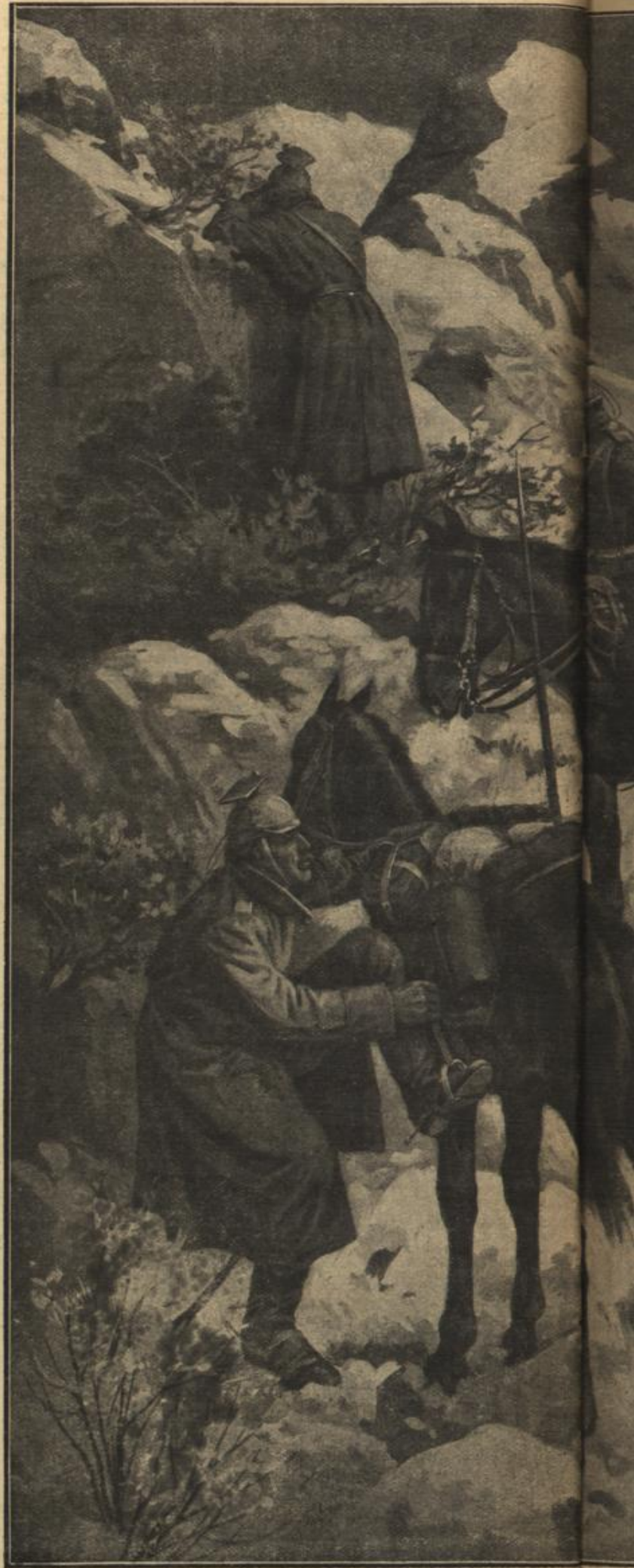
Originalzeichnung von Hans Treiber.

„Ich verwalte meinen ausgedehnten Besitz selbst, da bleibt wenig Zeit.“