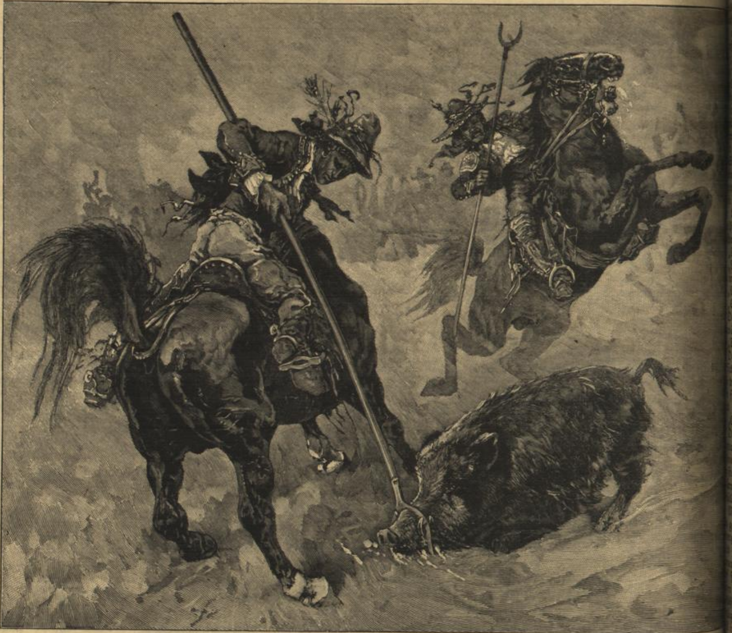
Sauhaß mit Gabellanz, ein andalusisches Jagdspiel (S. 120).

Während Muriel noch in den Sitzungssaal blickte, hörte sie ganz in ihrer Nähe entrüstet aufschreien. Die blutrote Schrift auf der weißen Wand war bemerkt worden. Alle drängten sich vor. Die Anwesenden las jetzt selbst die Worte, schalt mit drohend erhabener Stimme und sprach seine Vermutungen über den frechen