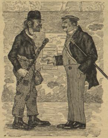
Strolch: Uhr her, oder ...! Student (einen Pfandschein aus der Tasche hotend): Bitte sehr!