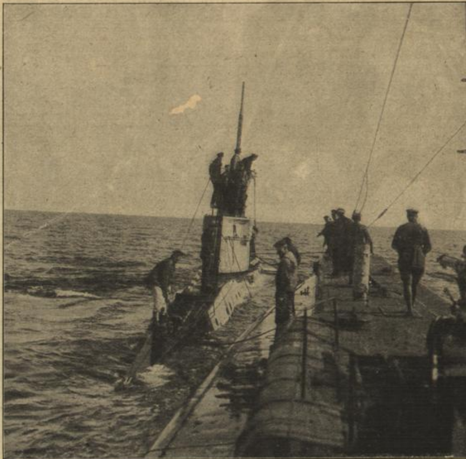
Begegnung zweier deutscher Tauchboote auf hoher See.

„Was wollen Sie tun?“ fragte Mrs. Baker gespannt. Sie war zwar die Vorsitzende, aber trotzdem fügte sie sich stets Muriels Ratschlägen und Anordnungen.