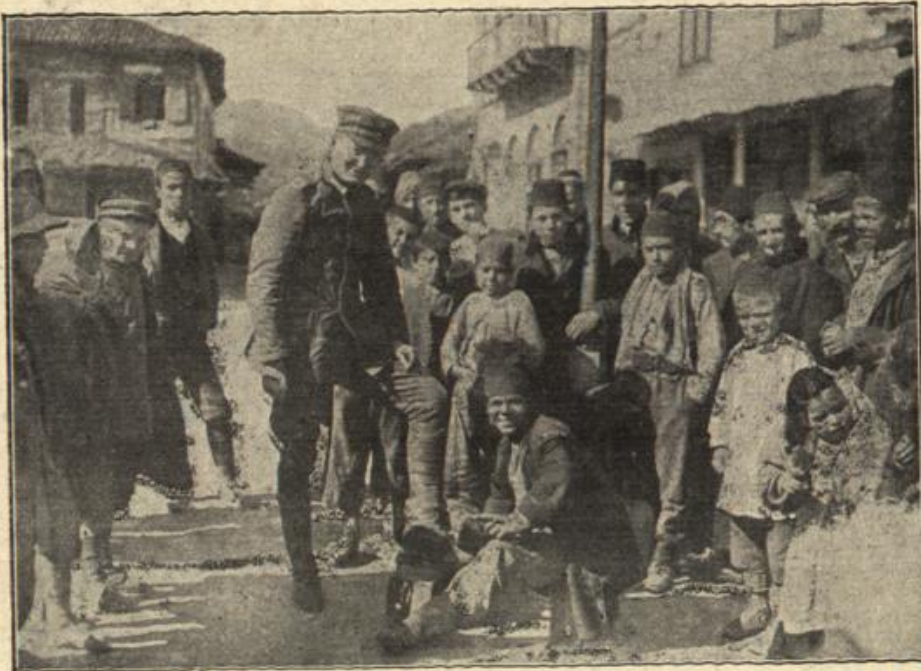
Ein seltener Kunde, Straßenbild aus Smyrna: Ein deutscher Soldat läßt sich von einem türkischen Stiefelputzer die Schuhe reinigen.

Ein wehes Schluchzen erschüttert den zarten Körper, doch mit größter Selbstbeherrschung vermag Stella der Tränen Herr zu werden, sie erhebt sich.