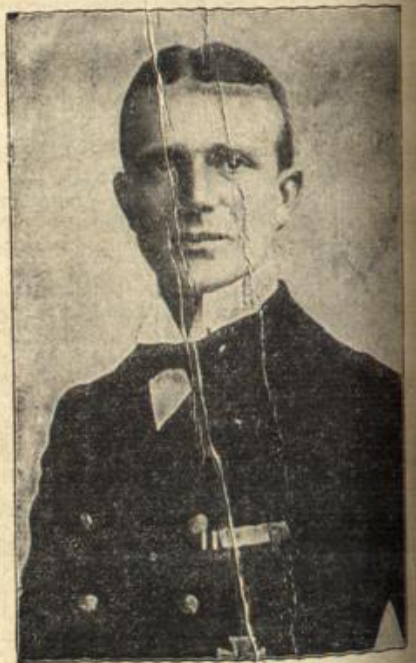
Kapitänleutnant Georg, einer unserer erdgeächsten U-Boot-Kommandanten.

atmend, die von dem nahen See herübergeweht wird. Kurz entschlossen wendet sie sich jetzt zum Gehen.