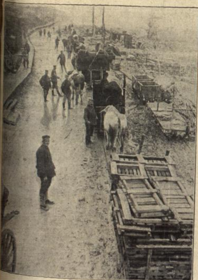
Vom westlichen Kriegsschauplatz: Material-Transp. von bis in die vord. ersten Linien mittels Schussgespannen auf Militär-Strassenbahnen.

Sie sang vor ausverkauftem Hause. Und auch an diesem Abend schlug sie wieder aller Herzen in Bann. Die große Arie im ersten Akt mußte sie wiederholen. Sie wurde mit Blumen überschüttet.