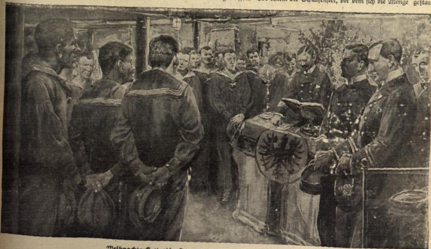
Weihnachts-Gottesdienst an Bord eines deutschen Kriegsschiffes.