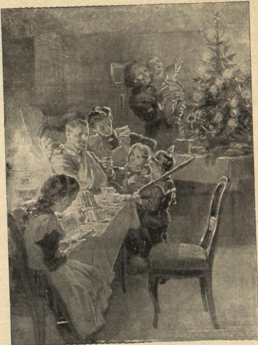
Weihnachtsfeier in der Familie des Kriegers.