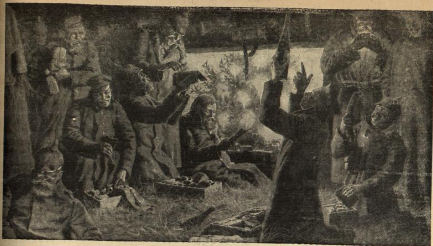
Weihnachten im Schächelgraben.