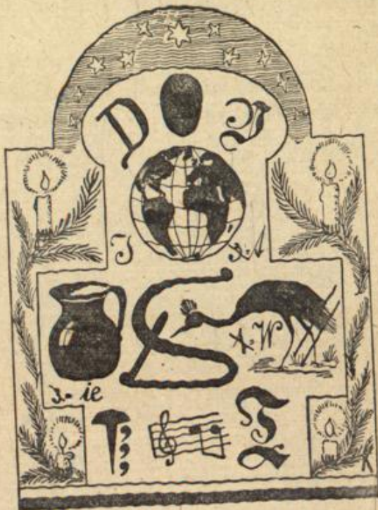
Möge es die letzte sein!

„Je vous prie de la grâce d'une fusillade!“... Trug es der Wind herüber? War's eine Täuschung meiner Sinne?