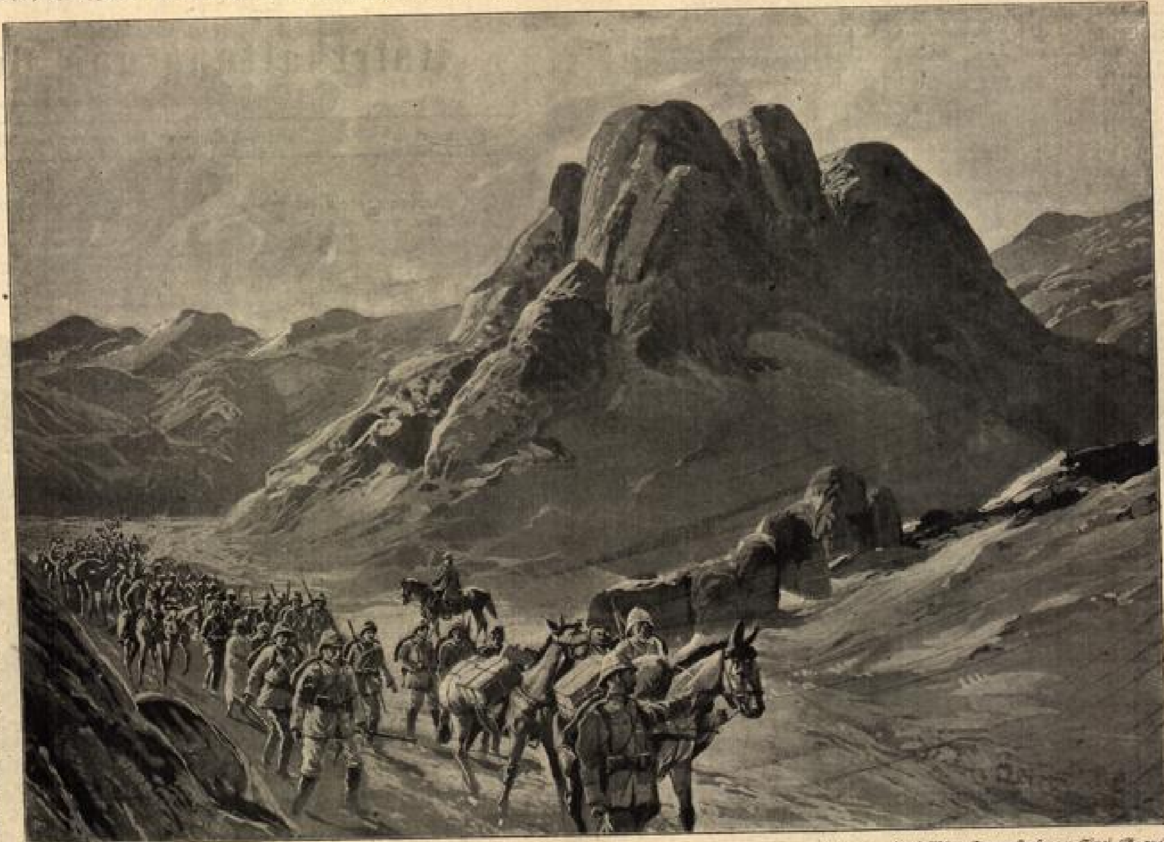
Nach einer Originalzeichnung von G. Martin.

„Sie wollen auch in die Stadt? Ja Susi!“