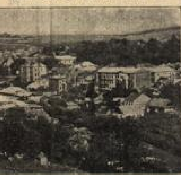
Übersicht über die Stadt Dury, wo die Russen wiederholt durchgehenden versuchten. (Nach einer Luftaufklärung von deutscher Seite gefahren)

„Klein Eusebe bezeugen. Dann würde Doktor sagen: Leben Sie wohl, daß ich recht hatte —“