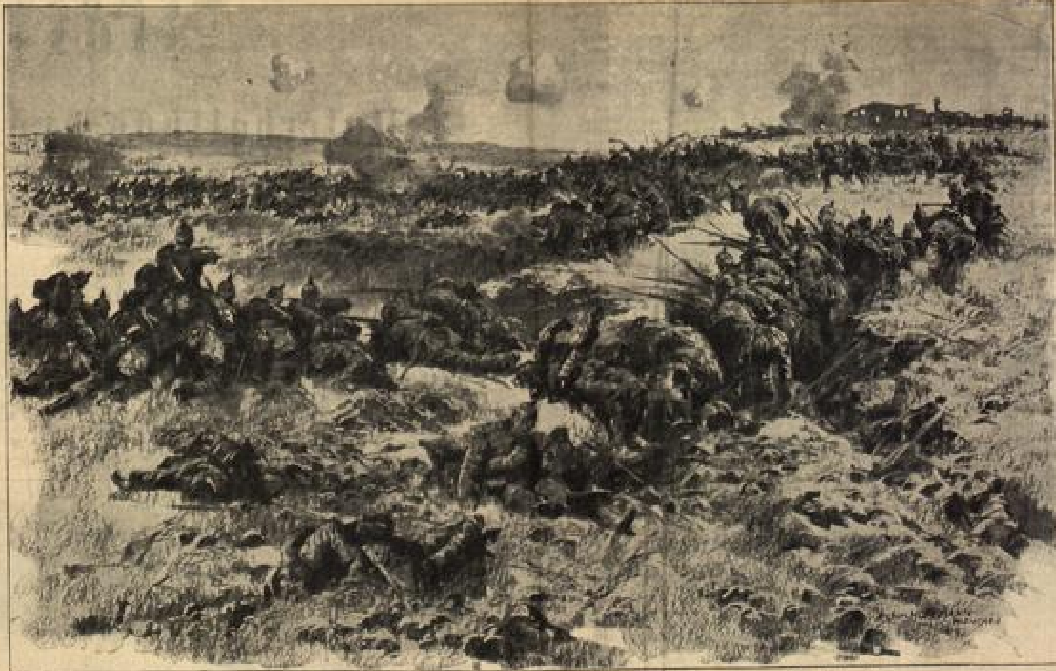
Strecke eines starken französischen Angriffs an der Somme durch Artilleriebeschuss und vorgehende deutsche Infanterie. (Nach einer Luftaufklärung von deutscher Seite gefahren)

„Eine heilige Mutter. Es ist alles Ursache und Wirkung auf der Welt. Unvernünftige Eingriffe gibt es nur im Hirn von Menschen, die nicht klar zu Ende denken. Unrecht! Überzeugen Sie sich.“