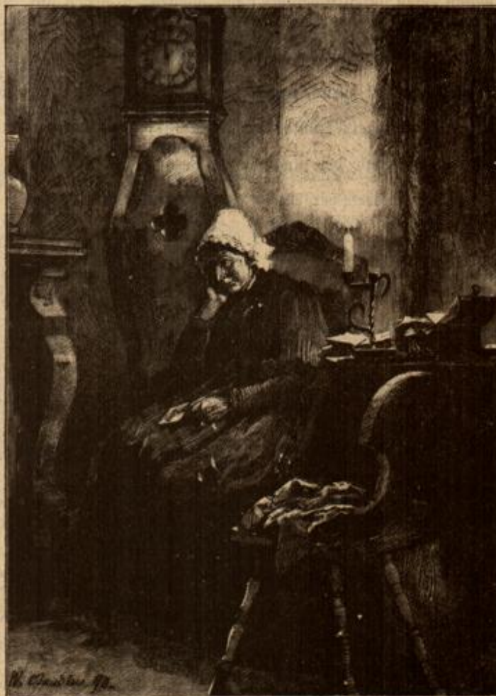
Silvesterträume. Von W. Claudius. (Mit Text.)

hatte das Tier? Sollte es in dem aus der Ferne herüberklingenden Hundegebell eine Gefahr vermuten, oder waren Raubtiere in der Nähe? Suchend ließ der Reiter die Blicke über die Hänge des Tales schweifen, nach der Seite hin, wo welcher das Hunde-