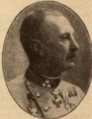
Feldzeugmeister Potiorek. (Mit Text.)

Aber kurz vor Silvester schlug das Wetter um. Es schneite die ganze Nacht und den ganzen Tag, dazu kam Wind, der den Schnee stellenweise fußhoch zusammentrieb, und so ge-