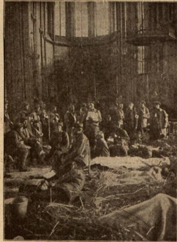
Von den Kämpfen um Gjern:

„Nun habe ich nicht wieder recht gehabt, du böser Mann?“