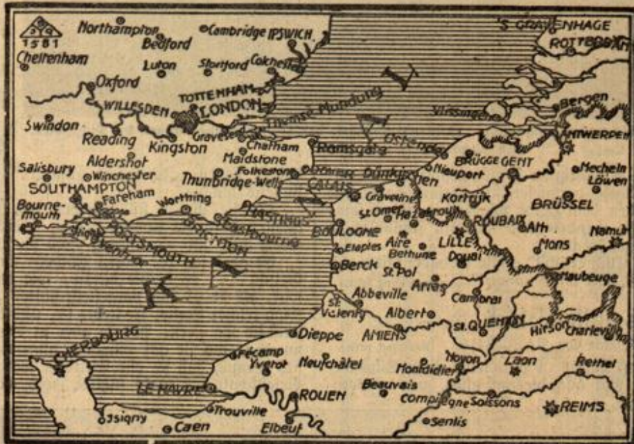
Karte vom Kanal zum Vordringen der deutschen Truppen.

Dumpf kurrend richtete sich bei dem Eintritt des Ritters ein gewaltiger Wolfshund in die Höhe, wurde aber sofort von der