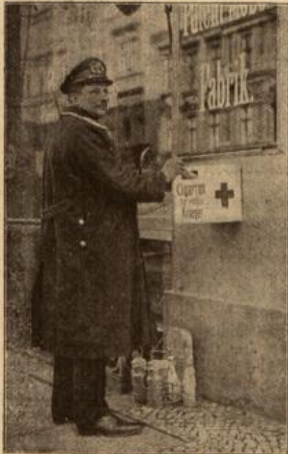
Einer, der auch weiß, was für den Mann im Felde eine Zigarette ist, am meisten dann, wenn er sie lange entbehrt.

Die Kirche von Dabizele, als Truppenverhandlungsplatz eingerichtet.