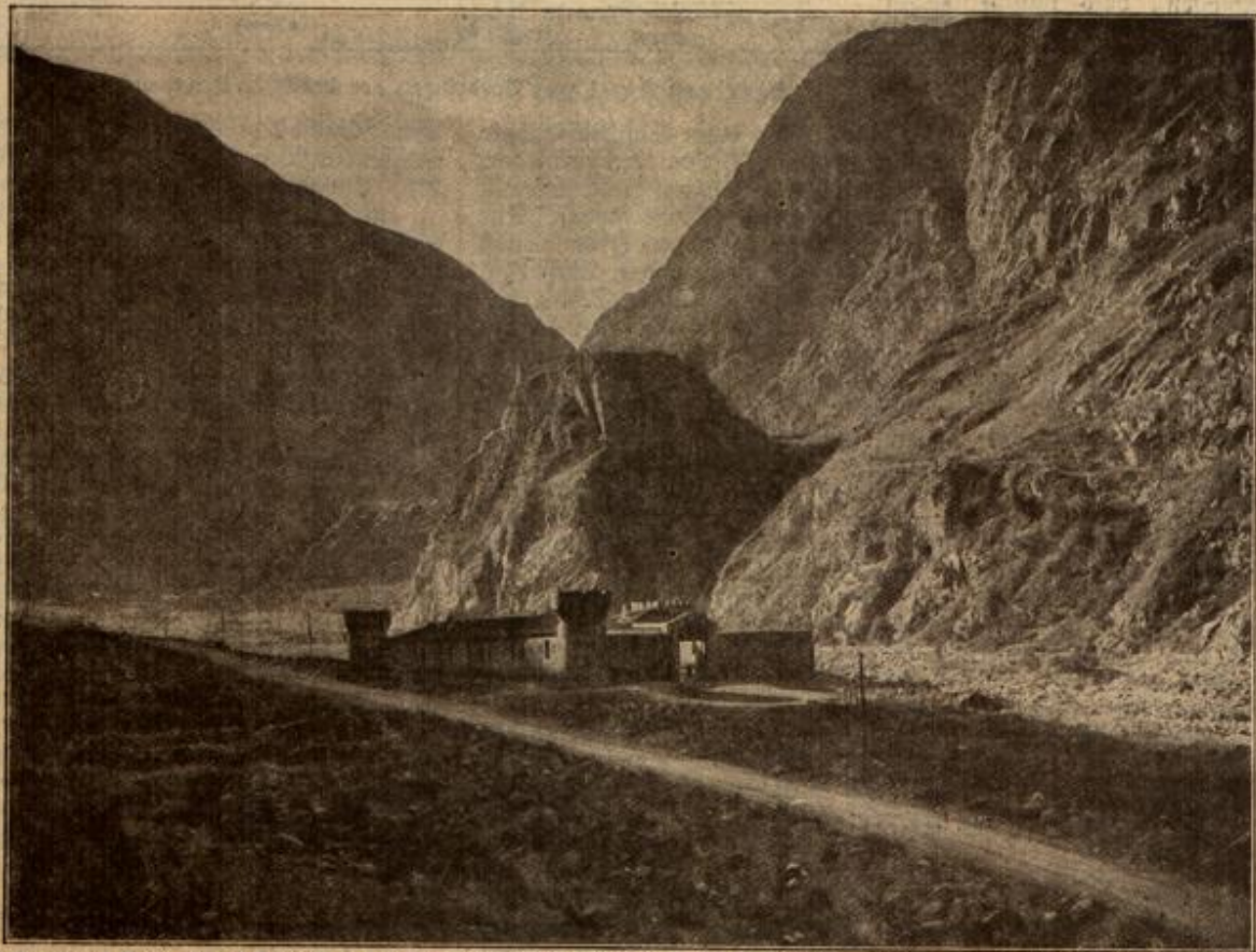
Eine alte Festung bei Zistis an der grusinischen Seeresstraße im Kaukasus. Diese mehr als 220 km lange Gebirgsstraße, die bis zur Höhe von 2432 m aufsteigt, bildet eine Hauptverbindung zwischen Rußland und der Türkei.

Da zuckte er die Schultern und sagte leichthin: „Nun gut, du sollst deinen