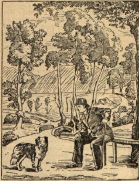
Wo ist Frauchen?

bolde? Vielleicht in einer Tarnkappe! Der Schlussatz hat gezogen, kleiner Wichtelmann. Die im Irrtum beharren, sind halt die Narren! Nein, eine Närrin ist Frau Adele noch lange nicht! Es wird also losgereist — mit Geduld und Humor!“