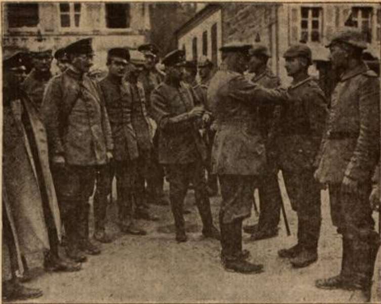
Der Lohn der Tapferkeit.

Der Oberst eines in den Kämpfen bei Solsona durch seinen Heldennut ausgezeichneten Regiments heftet seinen braven Leuten das Eiserne Kreuz an die Brust.