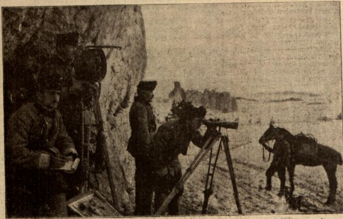
Osterreichisch-ungarische Kavalleriepatrouille bei Starcee gibt eine Meldung durch Lichtsignale ab.

Und da griff er nach der Hand des Freundes und rief mit zitternder Stimme: „Karl, wenn ich morgen falle, dann ...“