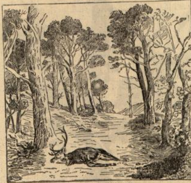
Wo ist der Weidmann?