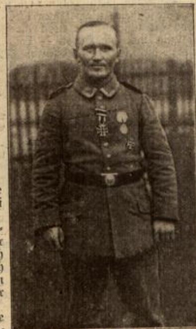
Ein sächsischer Hornist.