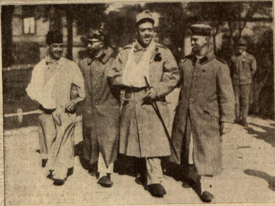
Waffenbrüder — deutsche, österreichische und ungarische Verwundete in einem ungarischen Lazarett.

Weiter kam er nicht, denn die Angst schnürte ihm die Kehle zu. „Unfimm!“ rief der Freund, „weshalb solltest denn gerade du fallen? Red' dir doch nichts ein, Mensch! Die Rothosen können ja alle nicht schießen.“