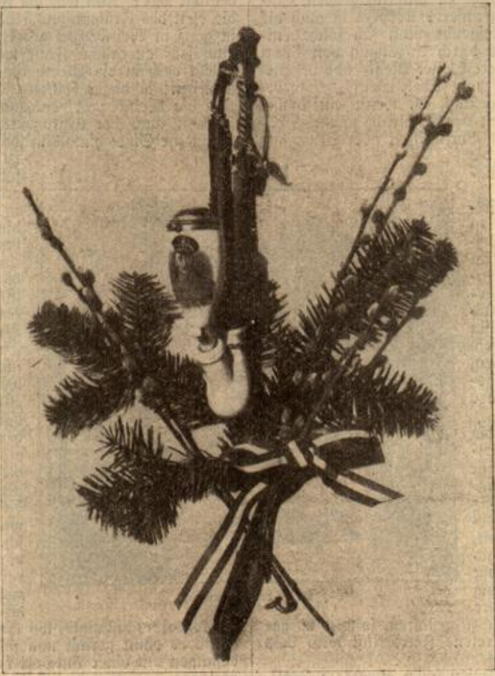
Weihnachtsgeschenk des deutschen Kronprinzen an seine Armee. (Mit Text.)

Weihnachtsgeschenk des deutschen Kronprinzen an seine Armee. Eine reizende Weihnachtsüberfischung hat der deutsche Kronprinz für seine Soldaten erdacht. Er hat in Berlin 220 000 Tabakpfeifen anfertigen lassen, welche auf der Vorderseite sein Bild und auf der Rückseite die Widmung „5. Armees Weihnachten 1914“ tragen.