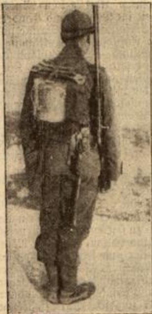
Frankreichs neue Felduniform: Rückenlicht. (Mit Text.)

tat einen tiefen Zug daraus, ihm wurde wirklich besser, er fühlte ordentlich, wie ihm die Wärme durch den Körper rieselte. — Dann ging er zurück ins Lager und legte sich wieder nieder, um vielleicht jetzt den ersehnten Schlaf zu finden. Und wirklich, nach fünf Minuten schlief er ein. Aber entsetzliche Träume quälten ihn. Er sah, wie der Gegner sie überfiel, wie die wütenden Franzosen ein grauenvolles Blutbad anrichteten, er sah sich verstümmelt als Krüppel daliegen und sah die