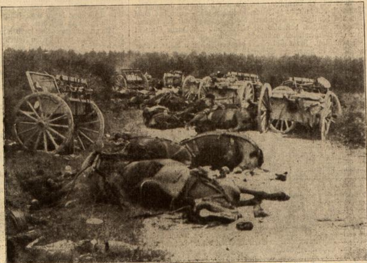
Schrecken des Krieges: Zusammengeschossene französische Batterie.

tat einen tiefen Zug daraus, ihm wurde wirklich besser, er fühlte ordentlich, wie ihm die Wärme durch den Körper rieselte. — Dann ging er zurück ins Lager und legte sich wieder nieder, um vielleicht jetzt den ersehnten Schlaf zu finden. Und wirklich, nach fünf Minuten schlief er ein. Aber entsetzliche Träume quälten ihn. Er sah, wie der Gegner sie überfiel, wie die wütenden Franzosen ein grauenvolles Blutbad anrichteten, er sah sich verstümmelt als Krüppel daliegen und sah die