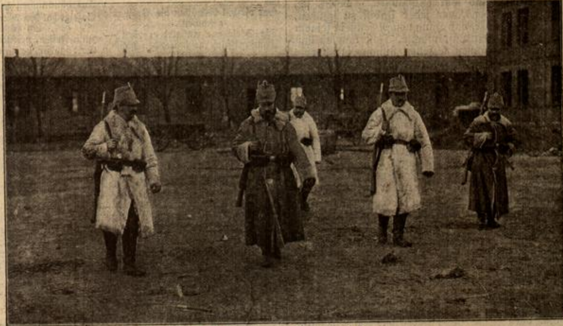
Vom Kriegsschauplatz in Russisch-Polen:

Die Mahnung, Frieden zu halten, hätte vielleicht nichts gefruchtet, denn Ritter Kurt von Lauterburg suchte sich mit Gewalt aus den ihn umschlingenden Armen zu lösen, wenn sich in diesem Augenblicke nicht eine Seitentüre geöffnet hätte und Walburga von Rosenstein, begleitet von einer alten Dienerin, in die Halle getreten wäre. Ihre lichte Erscheinung wirkte offenbar achtunggebietend auf die Männer, denn alle gaben die mehr oder weniger nachlässige Haltung auf, mit welcher sie um den Tisch saßen, und neigten sich grüßend gegen die Jungfrau, vor allen Kurt von Lauterburg, der plötzlich seinen Groll vergessen zu haben schien und über dessen Antlitz es wie freudige Erregung flog. Sein Schwert in die Scheide stoßend, legte er mit einer unbeholfen gezierten Gebärde die Rechte auf die Brust und stammelte: