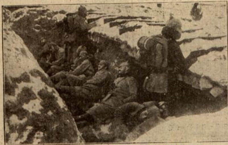
Ruhe nach der Schlacht in einem Schützengraben bei Darschmen.

in Bewegung. Sonderbare Gefühle tobten ihm durch die Brust. Seit heute früh schon wick die Unruhe nicht mehr von ihm. Etwas ganz Eigenartiges, etwas nie Bekanntes durchwühlte seine Seele, die ungewisse Vorahnung, daß er vor einem grauenvollen Ereignis stände. Er wußte, daß morgen eine Schlacht zu erwarten war, alle wußten es, aber keiner von ihnen dachte jetzt daran, sie alle waren von der großen, wohltuenden Müdigkeit übermannt, waren alle schlafend hingefunken und verträumten ihre Todesgedanken, er allein war wach geblieben, ihm allein war die Wonne des Vergessens ver-