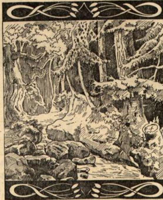
Wo ist der Landschaftsmaler?