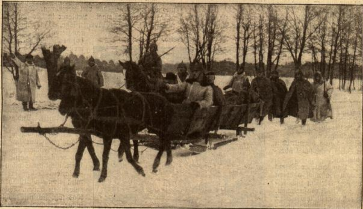
Ein Verwundetentransport auf dem Kriegsschauplatz in Russisch-Polen.

Vorstehendes Bild zeigt uns mehr die heitere Seite des Krieges. Dieser hat ja neben dem blutigen, schicksalsschweren Ernste, der dem Kampf ums Dasein eigen ist, auch seine Freuden. Wir sehen zunächst eine Milchstunde in einem Viehdepot. Dem kämpfenden Heere folgt in notwendigen Abstände Viehherde auf Viehherde, um mit Hilfe der rasch vollstündlich gewordenen Gulaschkanone in den Magen unserer Vaterlandsverteidiger zu wandern. Ob Kuh- oder Ochsenfleisch, darauf kann keine Rücksicht genommen werden. In der Gulaschkanone herrscht allgemeine Gleichheit. Vor dieser Verwandlung aber in Gulaschfleisch werden noch die Nebenprodukte der zur Verfügung stehenden Kühe gewonnen, um für den täglichen Kaffee die begehrte Milch zu liefern.