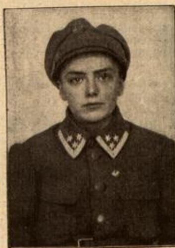
Ein weiblicher Feldwebel. (Mit Text.)

Die eine Pumpe ist beschädigt, die andere aber schluckt wie ein heulender Zyklop. „Zwanzig Faden, Kapitän!“ kommt die Meldung vom zweiten Offizier. „Zwanzig Faden!—Zwanzig Faden!“ — geht es allen durch den Kopf. Wie tief mag das Meer an dieser Stelle wohl sein? „Fünfundzwanzig Faden, Kapitän.“ „Dierunddreißig Fa—“ „Fünfundvierzig Faden, Kapitän!“ „Sechzig Faden!“