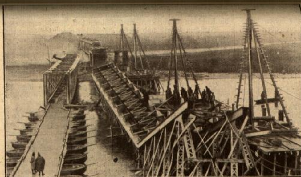
Die gesprengte Eisenbahnbrücke der Linie Kalisch—Warschau.

Der e gaben für gemeindeg z. B. Böden brüngen a Rie Es den Borr sonweit er Bader o abends ober un Bäder für De