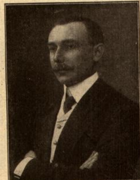
Professor Dr. Helfferich, der neue Staatssekretär des deutschen Reichsschatzamt. (Mit Text.)

tulchendem Sand. Die Nadel am Manometer stockt in ihrem Laufe. „Wir sitzen auf Grund, Kapitän!“ „Wie viel Faden?“ fragt eine zitternde Stimme. Es ist die des jüngsten Matrosen. „Fünfundsiebzig Faden, meine Junge!“ entgegnet der Kapitän. „Also keine Angst, das ist für uns keine gefährliche Tiefe!“ „Obermaat, prüfen Sie die Sauerstoffapparate!“ „Kamerad, die Telephonboje lösen!“