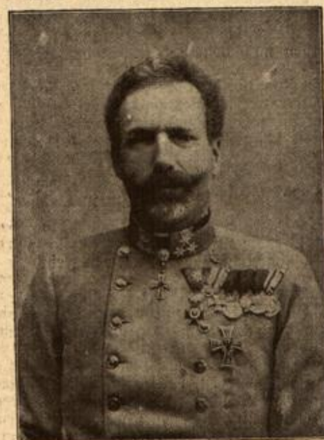
Erzherzog Eugen von Österreich. (Mit Text.)

Der zweite Offizier zieht an dem Hebel, der automatisch den Telephonschwimmer