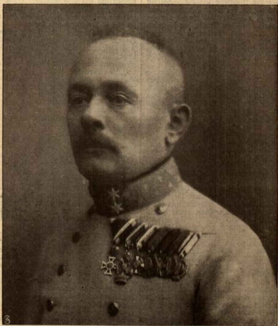
General der Infanterie Zvezozar Boroevic v. Bojna, der Führer der österreichisch-ungarischen Armee, die in den Karpaten Erfolge gegen die Russen hatte.