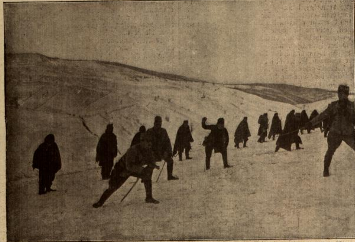
Der Kriegsschauplatz in den Karpathen: Eine österreichische Erkundungspatrouille in den schneebedeckten Bergen.