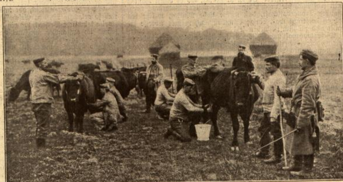
Mellstunde in einem Viehdepot auf dem westlichen Kriegsschauplatz.

„Siebenundsechzig Faden!“ Allen graust es. Der Offizier am Manometer gibt seine Meldung, als läse er einen Zeitungsbericht vor. Teufel, woher mag der Kerl nur seine Ruhe haben! Aber auch die anderen sind Männer. Entsetzen stiert ihnen aus den weit aufgerissenen Augen, aber sie ziehen den Kopf zwischen die Schultern und blicken zu Boden. Nur nichts merken lassen! Seemannsblut! Sie sind ja alle so stolz darauf. Jemandem macht einen schlechten Witz. Seine Stimme klingt erzwungen, gepreßt. Die anderen lachen gequält auf, aber ein wenig erleichtert auch dies Lachen. „Fünfundsiebzig Faden, Kapitän!“