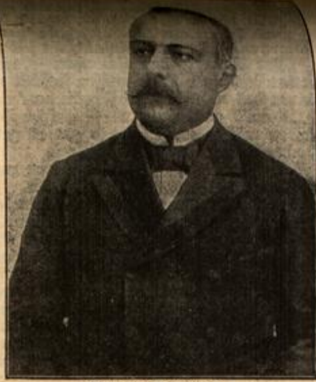
Antonio Salandra, der italienische Ministerpräsident.