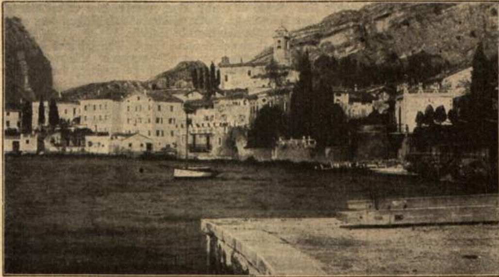
Die südlichste österr. Stadt in Tirol: Torbole am Gardasee, ein beliebter deutscher Erholungsort.