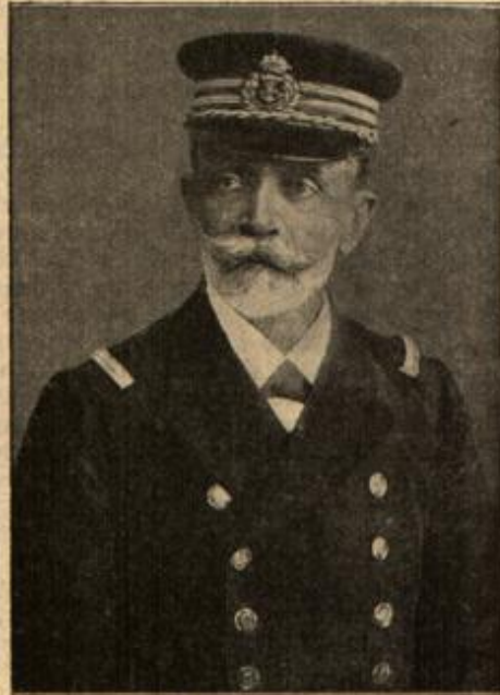
Admiral Hans, der Chef der österreich.-ungarischen Flotte.