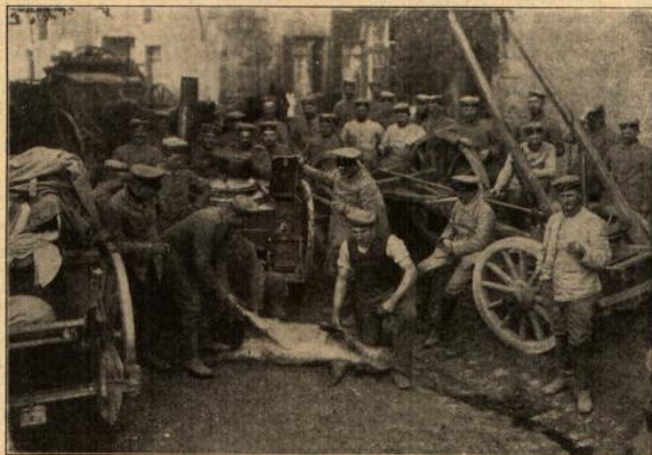
Schweinefleisch in einer deutschen Feldküche.