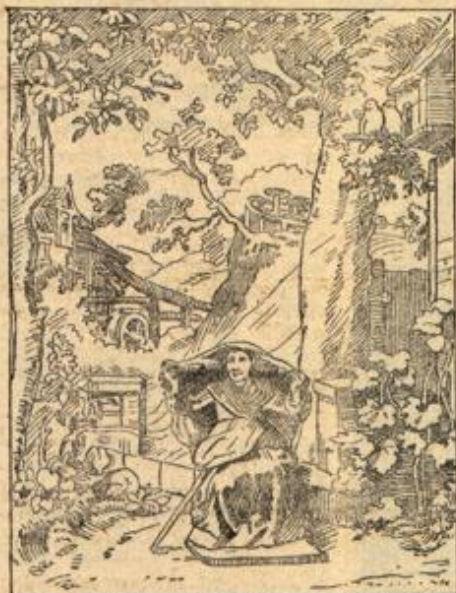
Heute kommt mein Sohn, sollte er nicht schon in der Nähe sein?

Das ging so lange, bis — ja, bis mein Mann die neue Wohnung mietete. Sie war prächtig mitten im Grünen gelegen, aber das Haus war noch vollständig im Rohbau, als wir es ansahen, und nur die starke Nachfrage bewog uns zu schnellem Entschluß. Als ich das erstmal meine neue Wohnung besichtigte, mußte ich noch auf Brettern herumklettern und konnte mir schwer ausmalen, daß aus diesem wüsten Chaos ein menschliches Heim entstehen könne. Aber wie angenehm war meine Überraschung, als ich kurz vor meinem Umzuge sie wieder besichtigte. Sie sah wirklich jetzt wie ein kleines Schmuckkästchen aus. Als gute deutsche Hausfrau schenkte ich natürlich der Küche ganz besondere Aufmerksamkeit. Aber kaum hatte ich sie betreten, als ich mich verblüfft nach meinem Manne umfah. Hatte hier ein neidischer Kobold sein Spiel getrieben? Über den weißen Kacheln des Herdes prangte in großen Buchstaben: