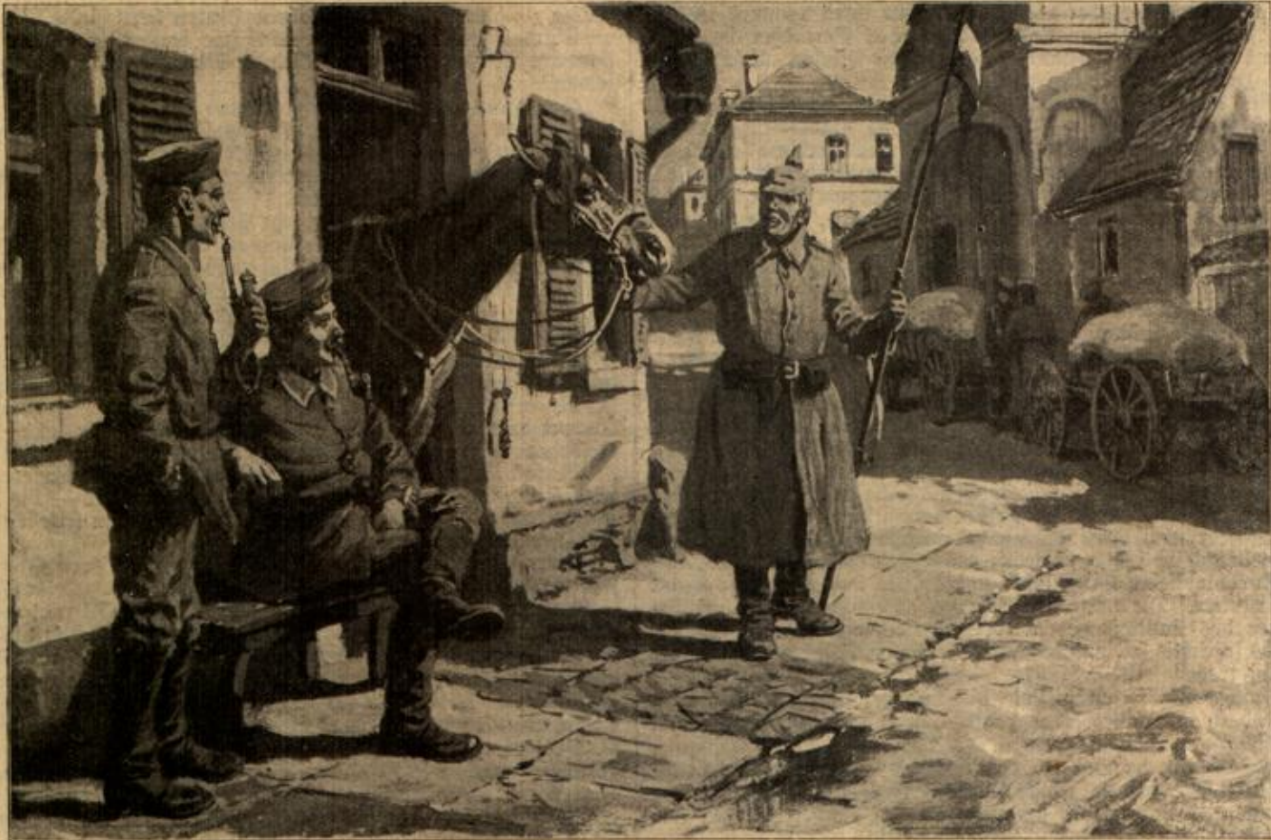
Im Quartier. Von Fr. van der Venne.

Nun strahlte die Frühlingssonne warm vom tiefblauen Himmel herab, und trieb die letzten Spuren von Frost aus der Erde. Die Lerchen stiegen, und emsig trieb Pjotr, die Pflugchar in die schwarze Krume drückend, Jomuschka an, und zog Furche um Furche. Hinter ihm drein marschierten, ausgerichtet wie eine Reihe Soldaten, die Krähcn, und pickten die Engerlinge auf, die die Pflugchar aufwarf. — Gelobt seien die Heiligen, nun war alles überstanden! Saatkorn hatten die Herren aus Moskau auch geschickt, schönes Saatkorn! Heute wurde Pjotr fertig mit dem Pflügen; morgen ging es ans Säen. Und der Himmel würde dieses Jahr ein Einsehen haben und eine gute Ernte senden nach den zwei Jahren Mißwachs! Sie alle würden reichlich zu