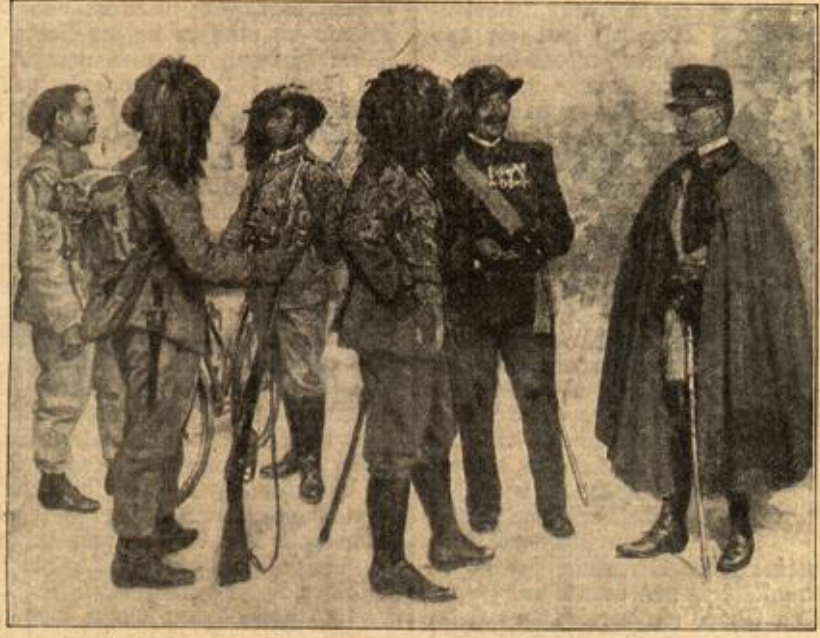
Italienische Truppen: Offiziere und Mannschaften der Bersaglieri.

Die Hausfrau im Juli. Die Hausfrau hat in den heißen Tagen die Aufgabe, für erfrischende Speisen zu sorgen. Das Gemüse darf jetzt auf dem Tisch niemals fehlen. Der Kopfsalat erfreut sich immer noch der größten Wertschätzung. Denn je größer und fester der Lattichkopf ist, desto besser, saftiger und zarter ist er auch. Die Zubereitung hängt natürlich von dem individuellen Geschmack ab, und es ist daher Sache jeder Hausfrau, sich darnach zu richten oder aber den Geschmack der Hausgenossen durch ihre Kunst zu beeinflussen. Neben dem Salat finden auch andere Gemüsearten reichliche Verwendung, namentlich frische Kohlsorten, Schoten und Erbsenarten, junge Schnittbohnen bieten natürlich auch Gelegenheit, die Mahlzeiten abwechslungsreich zu gestalten. Nicht unbeachtet dürfen die verschiedenen Beerenarten bleiben. Die Heidelbeere oder Blaubeere ist gewiß jeder Hausfrau willkommen, da sie zu Suppen und verschiedenen Gebäcken verwendet werden kann. Wegen ihres hohen gesundheitlichen Wertes, der hauptsächlich in ihrem beträchtlichen Eisengehalt zu suchen ist, sollte sie in allen Häusern reichlich genossen werden. Die Wald- und Gartenbeeren sind als Nahrungs- und Genussmittel ebenfalls hochzu schätzen. Da sie sehr aromatisch