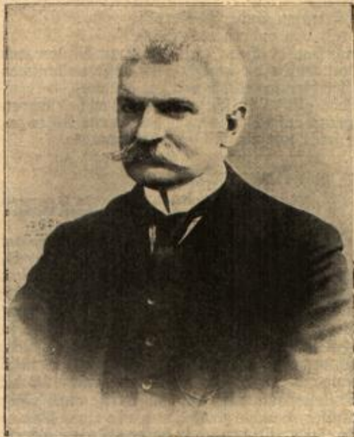
M. Sonnino, der italienische Minister des Auhrens.