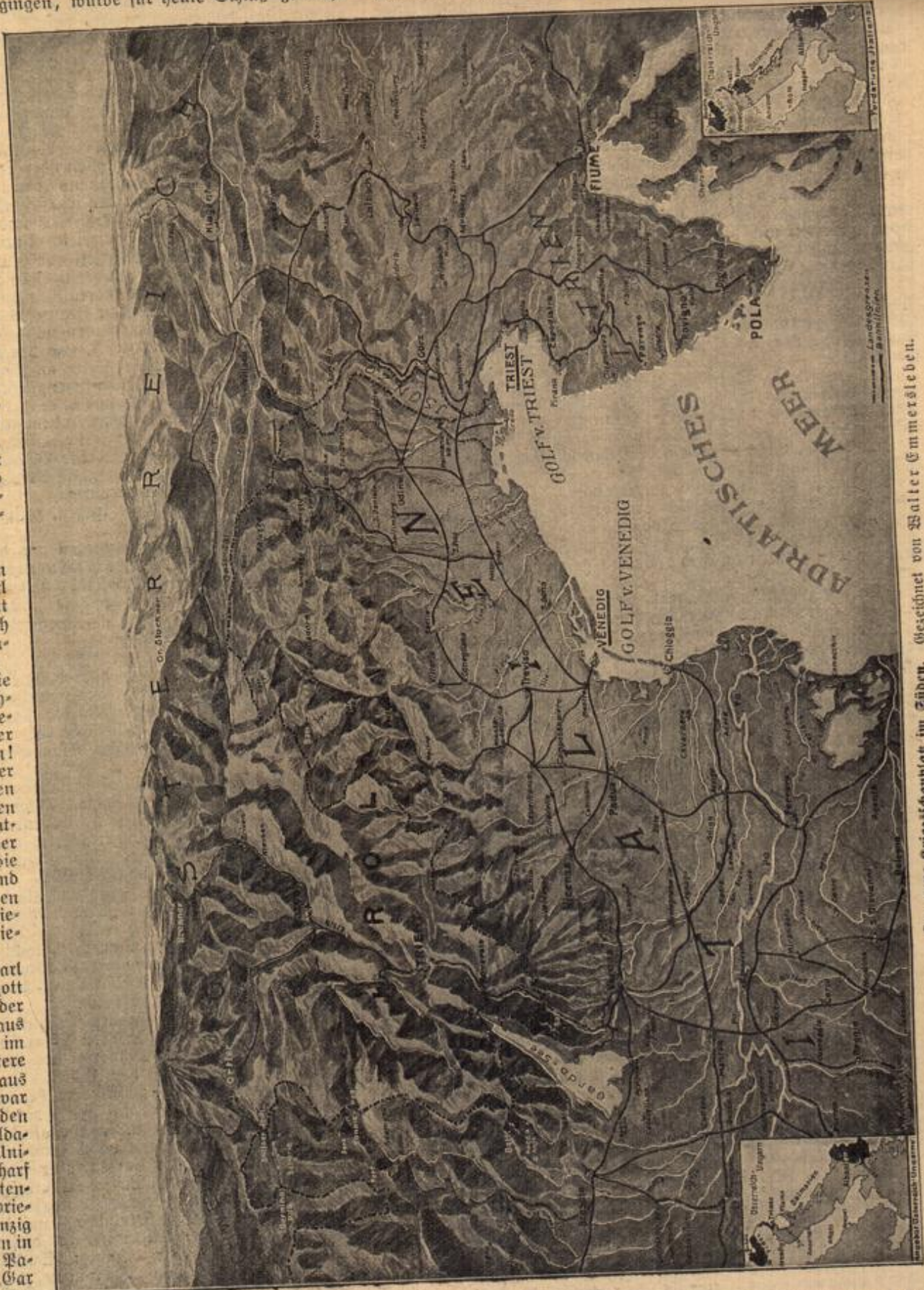
Der neue Kriegsschauplatz im Süden. Gezeichnet von Walter Emmerleben.

mit denen er auf Leben und Tod kämpfen sollte. Und dann war das Land! Sappertot! Hier Souffengärten und da Dünet, mit Reben besaant. Und das Obst! Und nun ging es an ein Marschieren. Gut, wie die Füße summten! Aber wenn da über die Köpfe hinweg etwas anders