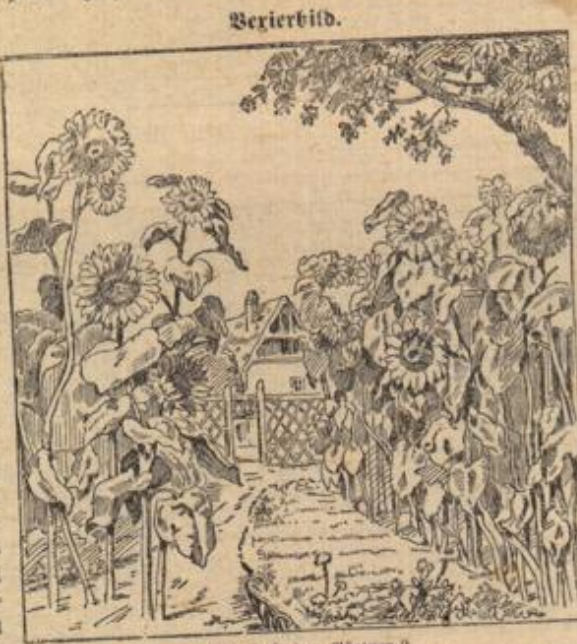
Wo steht der Gärtner?

Wenn wir auch den Ameisen die Achtung ob ihres unermüden Fleißes nicht versagen können, so sind sie doch in Haus und Garten gar ungern gesehene Gäste. Schwächliche Frauen naturen rieselt wohl eine Gänsehaut über den Rücken, wenn sie im Frühjahr die Erfahrung machen müssen, daß neue Einquartierung in Gestalt von Ameisen in Küche und Speisekammer ihren Einzug gehalten hat und sich die dort vorhandenen Vorräte gut schmecken läßt. Sofort wird diesen der Krieg erklärt und nicht eher geruht, bis die letzte Ameise verschwunden ist. Gar verschiedenartige Mittel werden dabei angewendet. Haben sich die Ameisen bereits im Hause, in Küche und Speisekammer niedergelassen, so wird ihre Bekämpfung zweckmäßig von innen und außen gleichzeitig eingeleitet. Außerhalb verzieht man den Hausfodel mit einem etwa handbreiten Streifen Raupenleim, den man während der Sommermonate stets feucht erhalten muß. Hierdurch verhütet man weiteren Zugang von außen, auch wird man gut tun, den sicher in nicht zu großer Entfernung vom Hause befindlichen Ameisenhaufen, der die einzelnen Heeres sätulen aussticht, durch Umwehrung mit einem Gürtel desselben Raupenleims auf seinen Bannkreis zu beschränken.