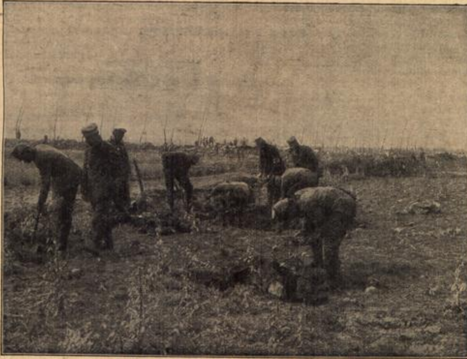
Von den flandrischen Schlachtfeldern. (Mit Text.)

Von den flandrischen Schlachtfeldern. Vor längerer Zeit gefallene französische Soldaten werden von Deutschen nach Eroberung der gegnerischen Stellungen mit Hilfe von präparierten Instrumenten und Gummihandschuhen nach der Erkennungsmarke durchsucht und dann begraben.