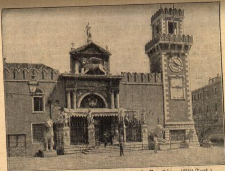
Das historische Eingangstor zum Arsenal in Venedig. (Mit Text.)

französische Wörterbuch hatte er er die zehn Taler entdeckte, war