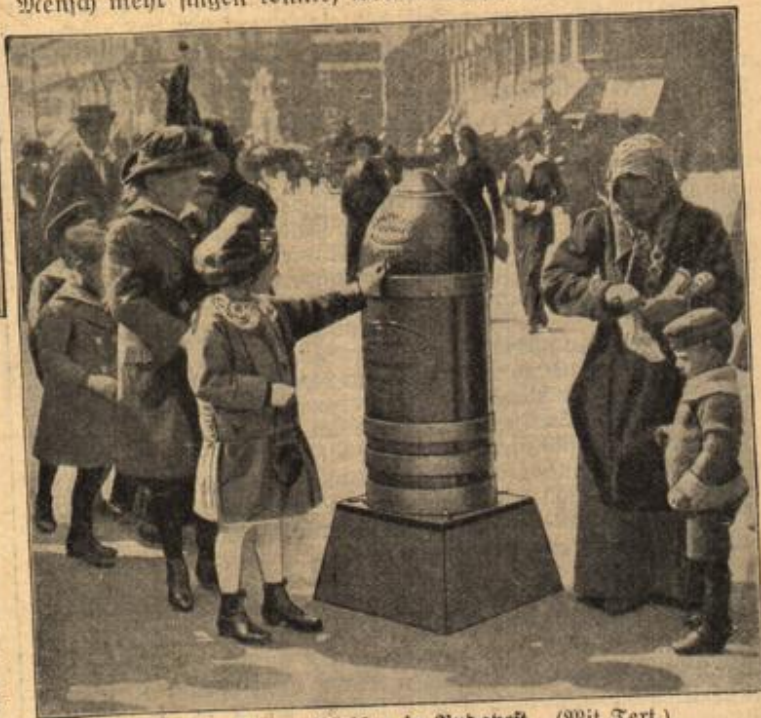
Liebesgaben-Zammelbüchsen in Budapest. (Mit Text.)

Und als er im Viehwagen neben neununddreißig anderen Kameraden hockte und man durch die Fluren rollte, und kein Mensch mehr singen konnte, weil die Rehlen streikten, da packte