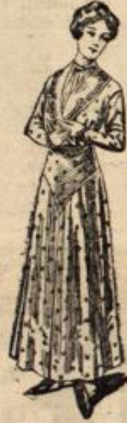
Nr. 4066. Kleid mit kurzen Ärmeln und hohem geradem Bodenkrock.

Nachdem unsere Röcke eine außerordentliche Wandlung durchgemacht haben, werden auch die Hüften und Taillen bald ein anderes Gesicht erhalten. Der eingesetzte lange Ärmel hat ja schon seit geraumer Zeit dem kurzen angeschnittenen Platz machen müssen, aber auch auf den Ärmelnarmel und den durchaus engen, — so eng, daß er zugenähte Nähte schwerlich vertragen würde und deshalb bis zum Ellenbogen geknöpfert werden muß, — können wir uns gefaßt machen. Verbreiterte Schulterteile, wie sie auch unsere Vorlage zeigt, geben den Taillen außerdem ein verändertes Aussehen. Die leicht übereinander tretenden glatten Hüften dieser Vorlage werden durch einen langen, bis zum Taillenschluß reichenden Schalstragen ausgeglichen, der mit schmaler Soutacheorte geschmückt ist. Den gleichen Befehl erhalten auch die über die Hand fallenden Ärmel, sowie die eine Seite der Spitz auf den Rock fallenden Passe. Das einfache, aber trotzdem wirkungsvolle Kleid kann mit Hilfe eines Savoir-faire von jeder Frau selber gearbeitet werden. Schnitt zur Brust unter Nr. 4013 in 42, 44, 46, 50, 52 cm halb. Oberw. 60 Pf., zum Rock unter Nr. 3421 in 98, 100, 104, 108, 112, 116, 120, 125, 135 cm Hüftweite 80 Pf. Muster für Soutacheorte unter Nr. 3361 für Rock und Taille 80 Pf. Zu beziehen von der Modenzentrale Dresden-N. 8. S. 6.