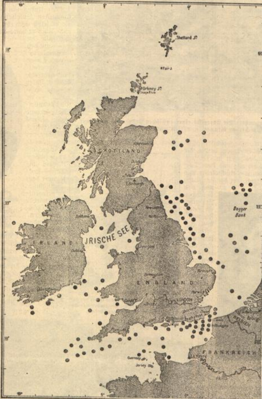
Verluste der Handelsmarine der Gegner Deutschlands an der englischen Küste in der Zeit vom 18. Februar bis 18. Mai 1915. Die Punkte geben an, wo die einzelnen Schiffe versenkt wurden; der Punkt südlich Larenstown bezeichnet die Stelle, wo die „Lufstania“ unterging.

nach Nizza zurückkehrten. Hans fand seine Frau wach. Sie hatte geweint und sich nach ihm gesehnt; sie hatte sich gelangweilt. Sie feierten Versöhnung, und der Friede war geschlossen. "Auf wie lange?" dachte Streblin.