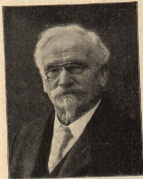
Gustav Libau, der Erfinder der Gussstahl-Kanone. (Mit Text.)

eingesehen, daß die als Barbaren verschrienen Deutschen, was | Kleine aber hat und drängte so lange, bis er es schließlich in die Tasche steckte, mit dem Entschluß, es gelegentlich wieder in den Spielzeuglasten des Kindes zu legen.