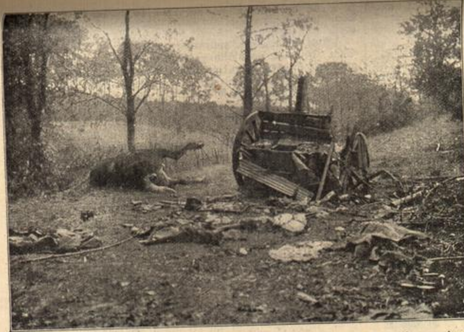
Nach der Eroberung von Przemysl: Die Überreste einer russischen Proze, die von einer großkalibrigen Granate getroffen wurde.

eingesehen, daß die als Barbaren verschrienen Deutschen, was | Kleine aber hat und drängte so lange, bis er es schließlich in die Tasche steckte, mit dem Entschluß, es gelegentlich wieder in den Spielzeuglasten des Kindes zu legen.