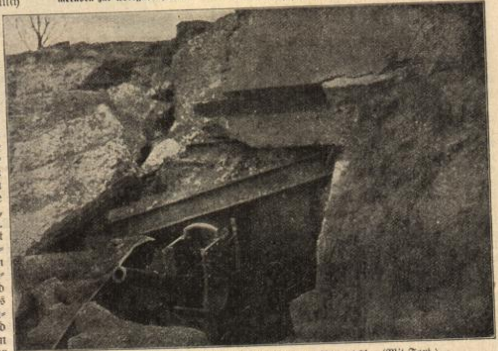
Ein von den Bayern erstürmtes Nordfort von Przemysl. (Mit Text.)

sein Spielzeug verwahrt hielt, und kam gleich darauf mit einem kleinen Gegenstande zurück, den er dem Soldaten in die Hand drückte.