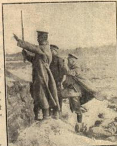
Gefangene Russen winken aus einem von den Deutschen erstürmten Schützengraben ihre Kameraden zur Übergabe heran.