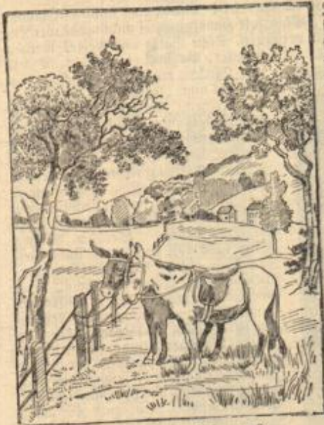
Wo ist denn der Fuhrmann?

Früher bereiteten sich die ärmeren Leute auf dem Lande vielfach selbst den Eichelkaffee von den im Walde gesammelten und daheim gebrannten Eicheln. Es galt als ein besonderes Zeichen von Armut, wenn einer Eichelkaffee trank. Heute wissen wir es besser, daß ein solcher Kaffee auch seine guten Eigenschaften hat, und so dürfte auch heute wieder manche Hausfrau zum selbstgebrannten Eichelkaffee kommen, ohne in den Ruf besonderer Armut zu gelangen. Eichelkaffee wird ja auch schon seit längerer Zeit fabrikmäßig hergestellt, ebenso wird man auch wohl wieder an die Herstellung von Eichelkaffee denken können. Die gerösteten Samen der wildwachsenden gelben Schwertlilie, Iris pseudacorus , kommen dem Kaffeegeschmack sehr nahe und können dem Eichelkaffee beigelegt werden.