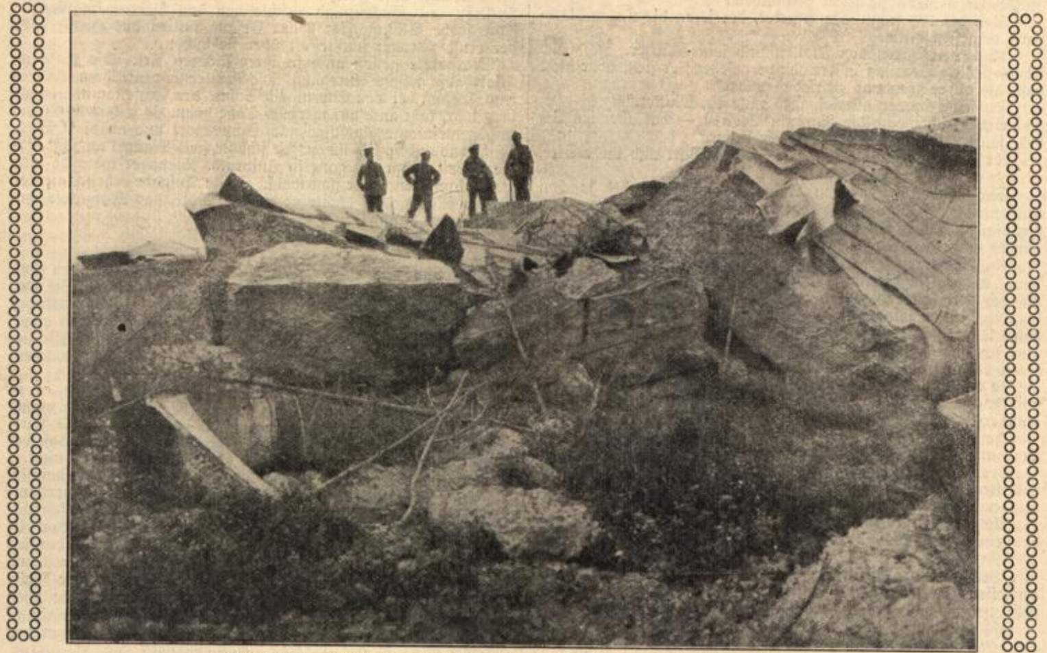
Fort XI von Przemyśl nach der Beschädigung durch schwere Artillerie. (Mit Text.)

„Wir haben zwei Kühe im Stall. Onkel hat für alles gesorgt. Im Dorf bekommt man alle Lebensmittel, und was fehlt, kann der Bote aus Memel holen; er muß dreimal jede Woche hin. Hier ist alles billiger als in Berlin.“ Nach dem Frühstück holte Bernd den alten Jochen aus dem Stall und stellte ihn mir in aller Form vor. In seinem treuherzigen Platt begrüßte er mich und hielt mir die schwierige Rechte hin. „Das ist meine rechte Hand, Mutter,“ sagte Bernd, „unter Jochens erfahrener Leitung hoffe ich, ein tüchtiger Landwirt zu werden. Für Wilkehen habe ich bereits einen neuen, bestempfohlenen Verwalter engagiert, und der scheint ein brauchbarer, ehrlicher Mensch zu sein. Ich setze meine ganze Kraft da-