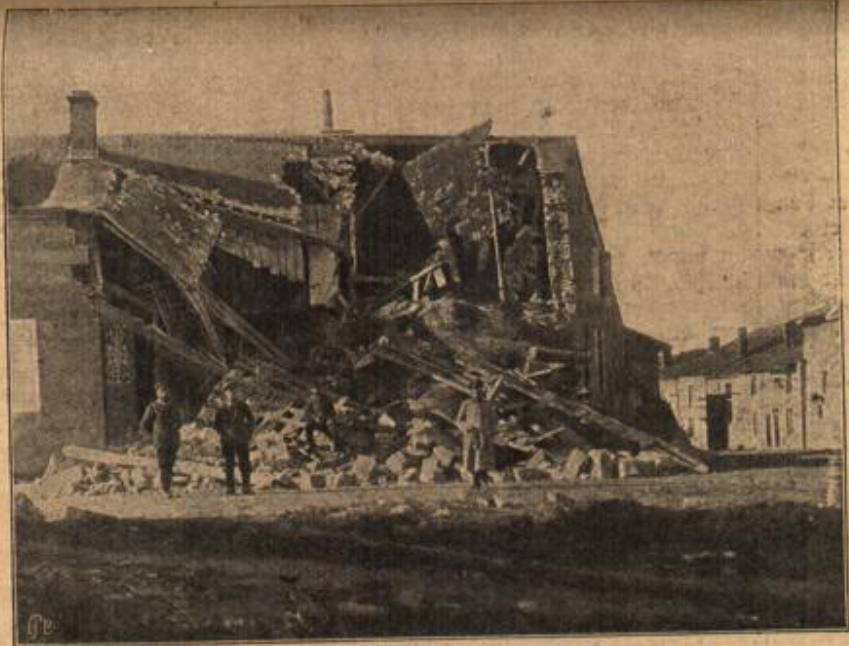
Eine Häuserreihe aus Briantes in der Champagne, an welcher die Wirkungen einiger Vorkämpfer zu sehen sind.