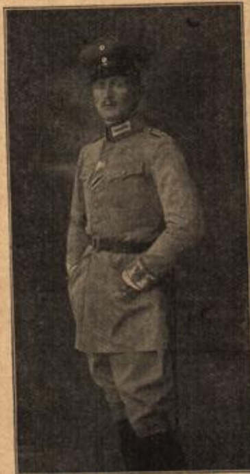
Rittmeister Prinz Heinrich von Bayern. (Mit Text.)

Fast lautlos war Manfred eingetreten, nun stand er vor ihr, marschbereit, vielleicht zum letzten Male!