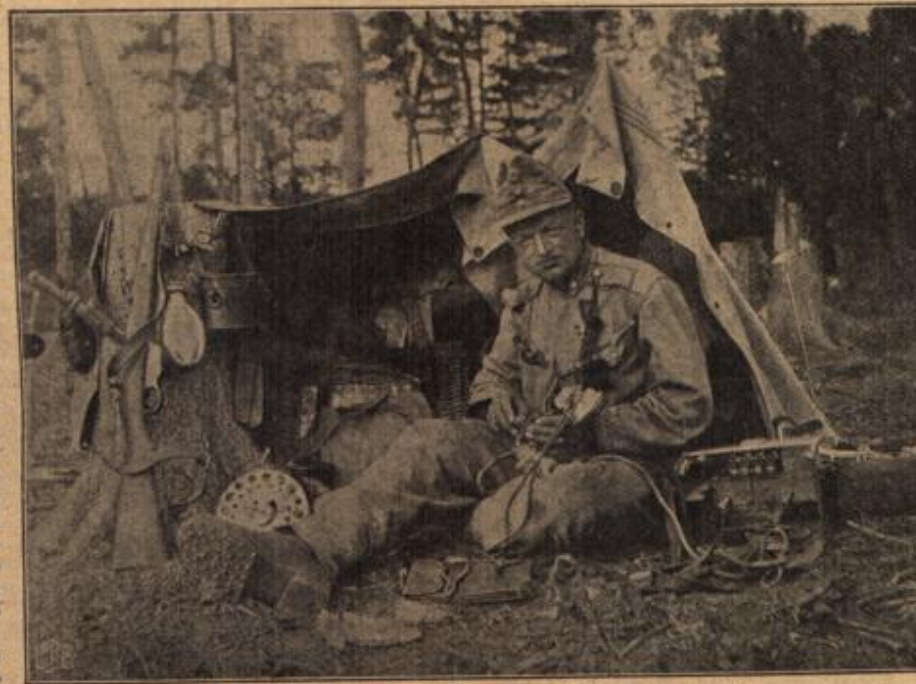
Osterreichische Telephonzelle im Walde vor Pinst. Der diensttunende Soldat ist beim Prüfen der Telephonzellen.

Die Hindenburg-Brücke in Berlin . Ungehindert durch den Krieg gehen in deutschen Landen zahlreiche große Schöpfungen ihrer Vollenendung entgegen. Von den Hoch- und Tiefbauten Berlins wurde in diesen Tagen die neue Hindenburg-Brücke eingeweiht. Die dritte „Millionenbrücke“ in Berlin liegt im Zuge der Vornholmer Straße, führt über das tiefe Eisenbahnhoch der Stettiner Bahn und hat mit Erlaubnis des Generalfeldmarschalls von Hindenburg dessen Namen erhalten.