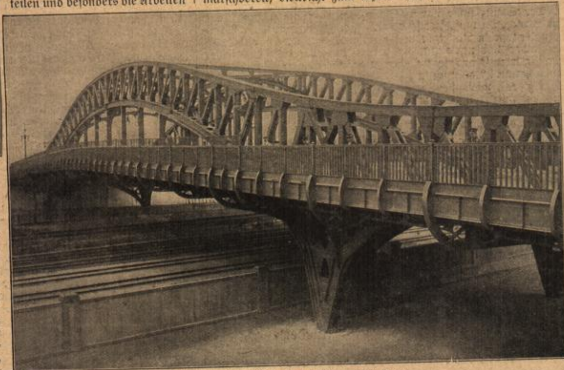
Die Hindenburg-Brücke in Berlin. (Mit Text.)

In den steilen Logesen wird die Post auf Eseln befördert.