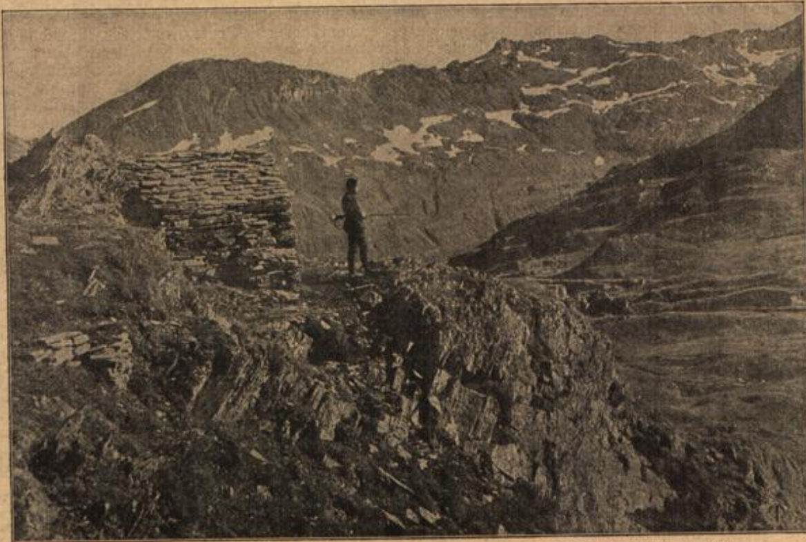
Die bewaffnete Neutralität der Schweiz: Ein schweizerischer Wachtposten im Splügenrebiet.

Ein gutes Mittagessen wurde ihm vorgesetzt und ein Wärter brachte ihm seinen eigenen Anzug. — Mit einer verbindlichen Verbeugung, die etwas wie eine Entschuldigung sein sollte, wurde er, da ja kein Gegen Grund vorliege, entlassen, bis zu einer wei-