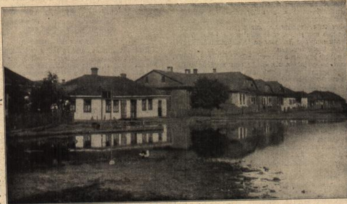
Ein russisches Dorf im Kampfgebiet der Rokitnosümpfe. (Mit Text.)

Da knarrt die alte Pforte und eine mit feinem Geschmack, doch einfach schwarz- gekleidete Dame betritt den Friedhof. Sie erschrickt heftig, als sie den Fremden erblickt, und ihr Fuß stockt einen Augenblick. Sein Herz schlägt langsam und schwer. Träumte er denn?