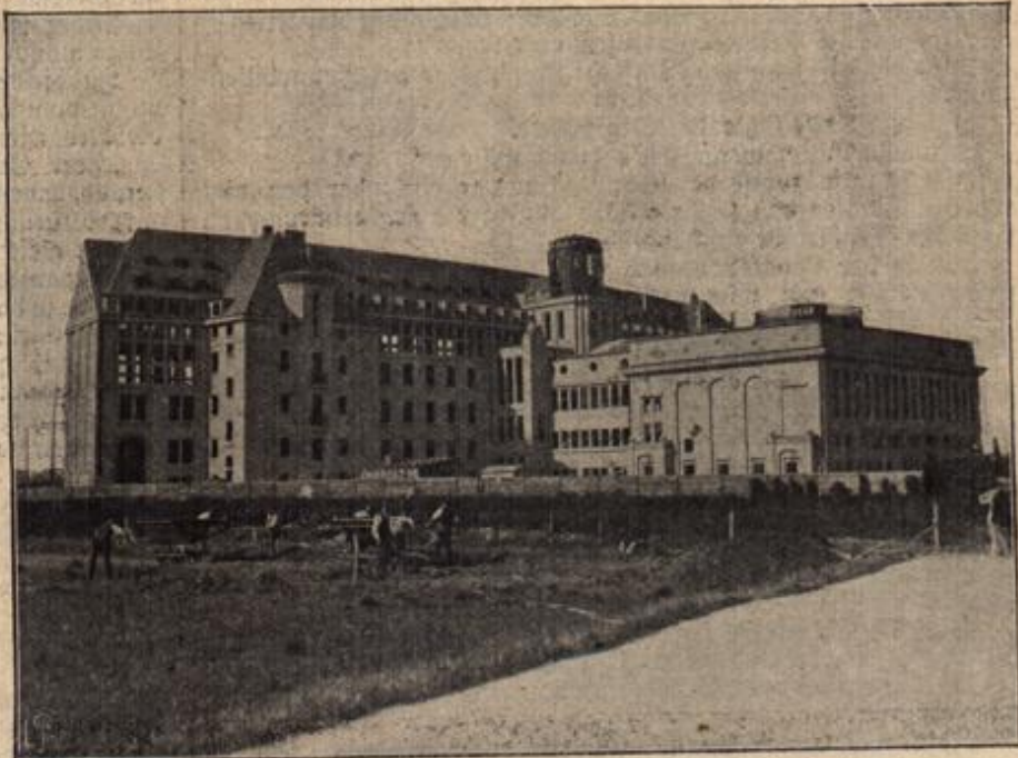
Das Gebäude der deutschen Bäckerei in Leipzig. (Mit Text.)

In all diesen Jahren hörte ich nichts von dir. Niemand vermochte mir Auskunft über dei-