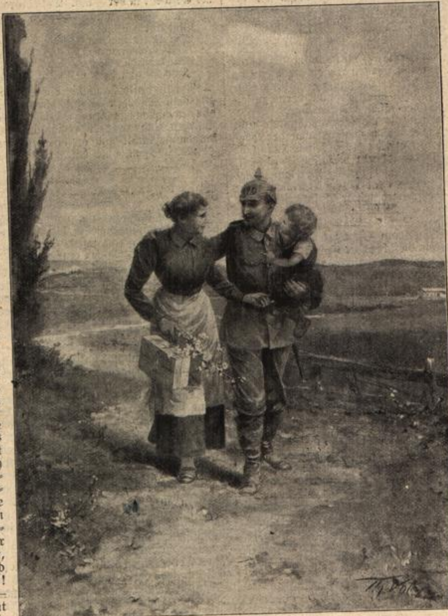
o Heimat, teure Heimat! Originalzeichnung von Th. Volz. (Mit Text.)

„Vergrüß Gott, Marte! Und dir auch so viel!“ rief sie ihm nach.