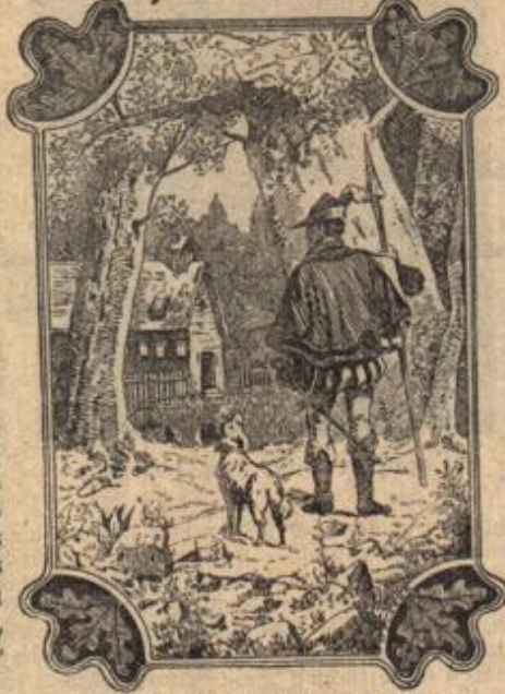
Wo sind die beiden Töchter des Hörners?