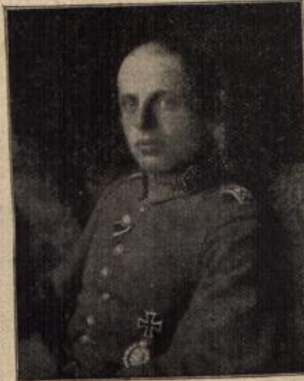
Ein deutscher Fliegerheld. (Mit Text.)

Ein deutscher Fliegerheld. Fliegerleutnant Bödde wurde für sein heldenmütiges Verhalten gelegentlich des letzten Freiburger Fliegerangriffs von der Obersten Heeresleitung mit Auszeichnung erwähnt. Leutnant Bödde, der Ritter des Eisernen Kreuzes erster Klasse ist, hat im Laufe des Sommers drei gegnerische Flugzeuge zum Abschluß gebracht.