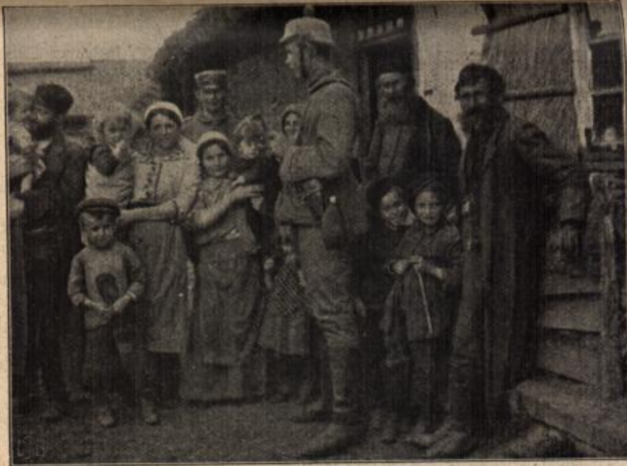
Wie die Bevölkerung in den neubesetzten russischen Orten die Feldgrauen empfängt.

Es kann ja nicht sein, daß sie, mit der sich seine Gedanken soeben beschäftigt, es ist. Doch dieses blonde Haar, die feine, schlanke Gestalt, die ihm nur größer erschien als einst — — „Käthchen!“ Unwillkürlich hat er es gerufen.