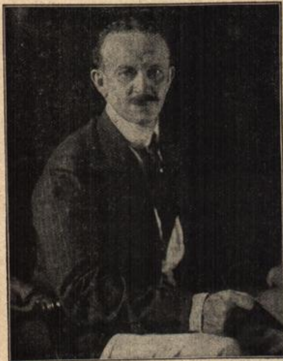
Johann Heinrich Graf v. Bernstorff, deutscher Botschafter in Washington. (Mit Text.)

Schwere deutsche Artillerie auf dem Marsch bei Pinsk.