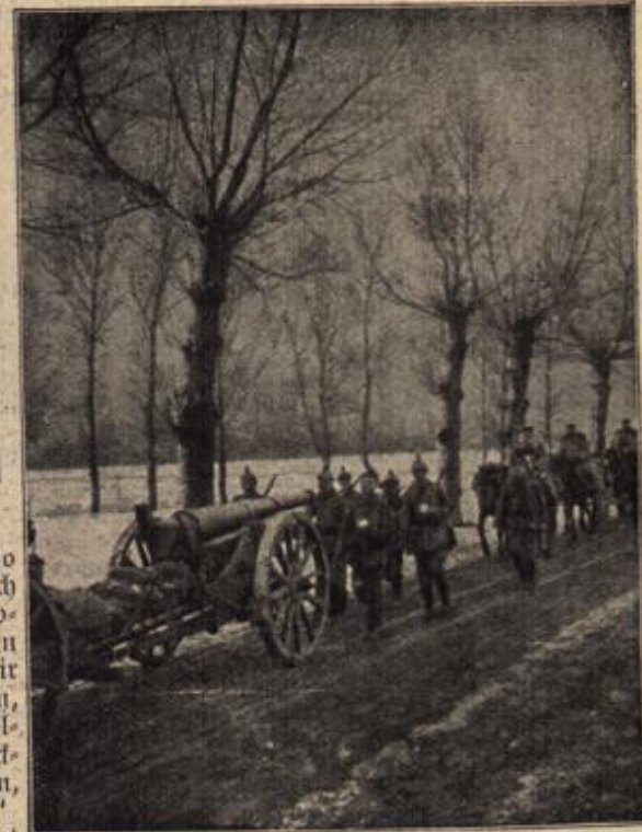
Winteranfang in Rußland:

Immer dichter fallen die Schneeflocken; aber zwei Glückliche wandern fröhlich plaudernd durch das stille Dorf.