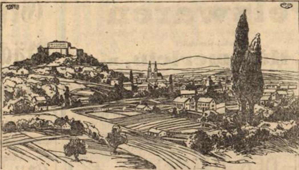
Ansicht von Görz.