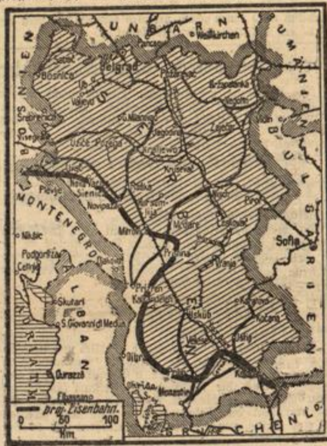
Die Front der Verbündeten in Serbien.

Die serbischen Großmachtsträume sind verdorrt und Serbien, der sich ausblühende politische Ochsenrost, ist flüchtig zusammengeschrumpft. Von dem eigentlichen Serbien ist nur noch der nördliche Teil des Amsfeldes (Kosomopolje) mit Priftina vom serbischen Heer besetzt