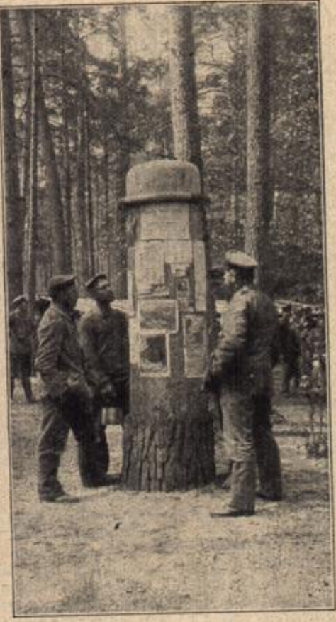
Ausschlagjante im Waldlager. (Mit Text.)

wird hinweggedrängt durch ein Stechen und Wühlen in der wunden Brust, das ihn an das Ende alles irdischen Denkens und Wollens gemahnt. Ein neues Bild entsteht vor dem seelischen Auge des Kranken. Fern von seiner früheren Heimat, auf einem Bauerngut in Hinterpommern beim Großhofel seines verstorbenen Vaters, der seinen einzigen Sohn durch den Tod verloren und ihn, den Neffen, zu sich gerufen hatte, führt er in treuer Arbeit und Pflichterfüllung unter den Augen des alten Mannes ein ernstes, stilles Leben. Es war ihm schnell gelungen, das Vertrauen des Onkels zu gewinnen, und als derselbe starb, setzte er ihn zum Erben seiner hübschen Wirtschaft ein. Mit einem Schlage war der arme Knecht zum wohlhabenden Bauern geworden, dessen Acker- und Viehstand sich wohl messen konnten mit demjenigen seines einstigen Herrn in der Heimat, des reichen Adlerbauern.