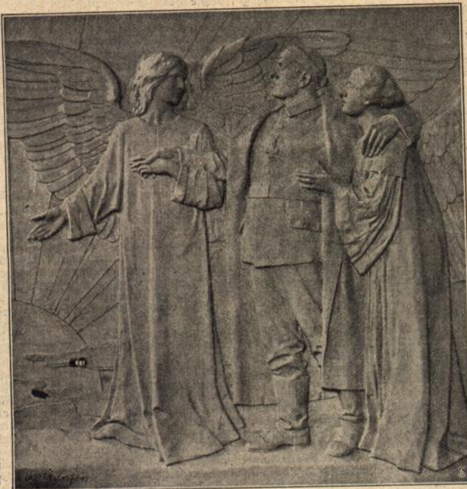
Relief in der Gedenthalle zu Namur, vom Bildhauer Walter Zahnen.

Anna, die er nun vielleicht bald als sein junges Weib würde heimführen können. Vermögen hatte zwar keines von ihnen, aber zur Anschaffung eines bescheidenen Hausrats mochte das beiderseitige, mühsam Ersparte wohl ausreichen. Sie hatte in