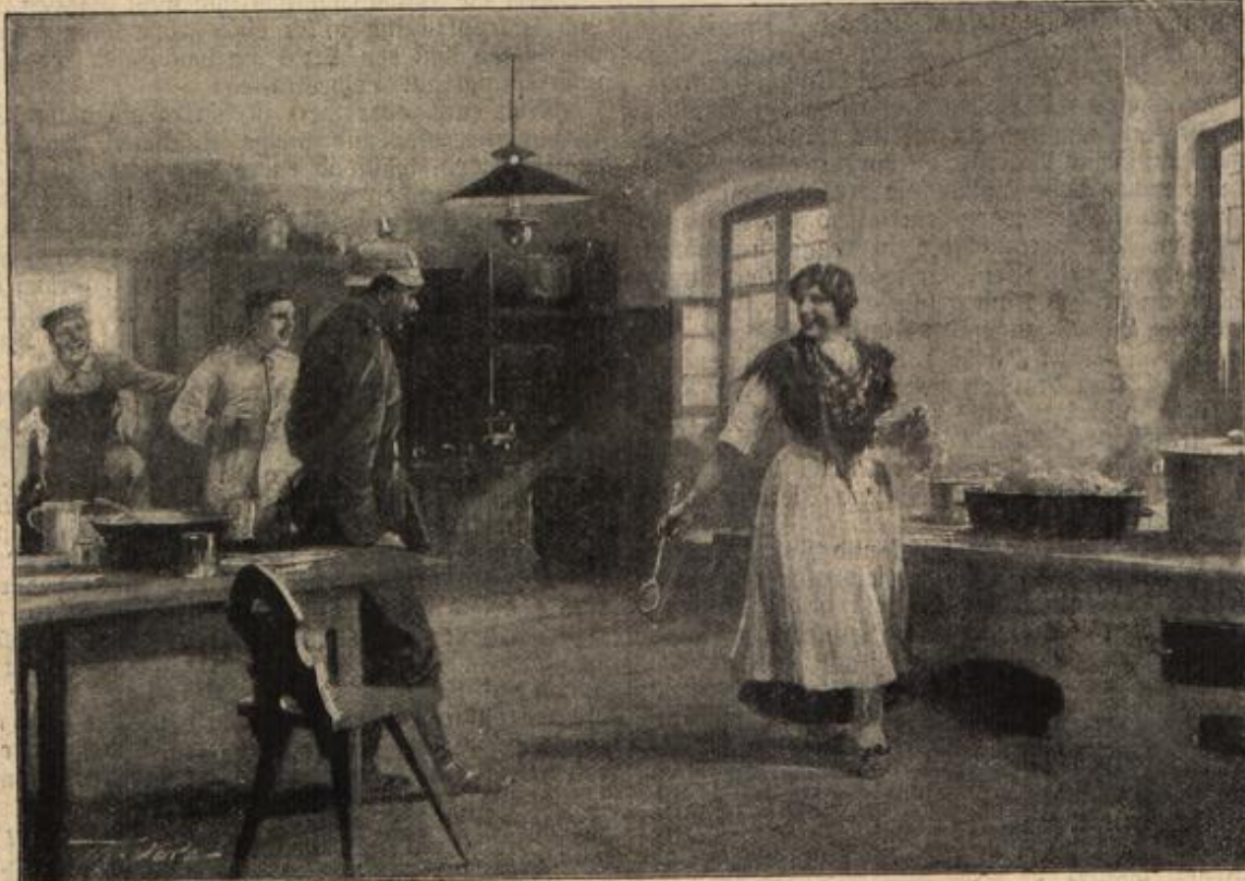
Ein gutes Quartier. Nach einer Originalzeichnung von Th. Volz. (Mit Text.)

Einmal hatte der Martin gesagt: „Lisbeth, mir fehlt ein Gaul! Die kommende Woche ist Mosmarkt in der Stadt. — Es wird kein Fehl sein, ich geh’