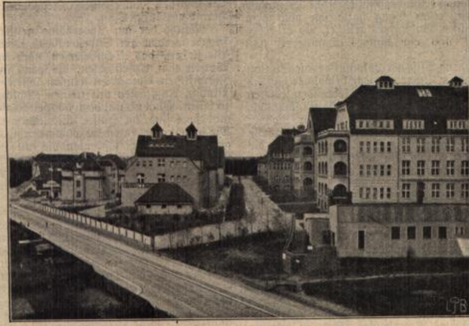
Die neue große Krankenheiseranlage in Chemnitz i. S. (Mit Text.)

Die neue große Krankenheiseranlage in Chemnitz i. S., welche mit einem zehnmilliardenwert das größte soziale Werk der Stadt Chemnitz darstellt und deren Fertigstellung bevorsteht. Unser Bild zeigt den fertigen Teil der aus achtzehn Gebäuden bestehenden Anlage.