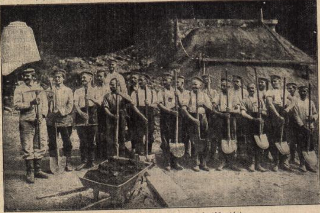
Shipperparade auf dem westlichen Kriegsschauplatz.

verjinstert und als er ihn zu Ende gelesen, war ihm das Blut siedendheiß vor Zorn in die Schläfen gestiegen. Die Anna teilte ihm kurz und bündig mit, daß der alte Adlerbauer nach kurzem Krankenlager gestorben sei und sein einziger Sohn sie, die einfache Magd, zur Herrin seines Hofes machen wolle. Natürlich würde es ihr schwer, ihm, dem Hannes, abschreiben zu müssen, aber das viele Geld, die prächtige Wirtschaft seien doch gar zu verlockend. Noch jetzt, bei der bloßen Erinnerung, will den Verwundeten ein tiefer Groll überkommen, aber er