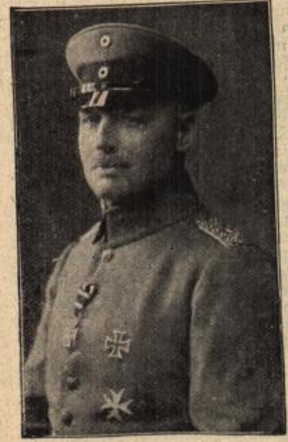
Oberst von Treslow, der Kommandant der Stadt Wilna.

Aber in seiner Seele wollte doch niemals ein richtiges Freuen aufkommen über den schönen Besitz, es war, als habe damals der Treubruch seiner Anna in ihm die Fähigkeit des Glücklichseins getötet für alle Zeit. Um die Frauen kümmerte er sich nicht mehr. Statt der Liebesgedanken fanden jetzt nur noch Haß und Groll Raum in seiner Brust; der heiße Wunsch, Rache zu üben an dem Räuber seines Glüdes, verzehrte ihn. Er nahm seine Mutter, die noch immer als arme Tagelöhnerswitwe in Werblitz gewohnt hatte, zu sich und arbeitete und sparte mit ihr gemeinsam, als gelte es um jeden Preis ein großes Vermögen zusam-