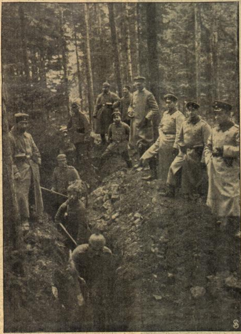
Zu den Kämpfen in den Vogesen: Deutsche Infanterie hebt einen Laufgraben aus.

hält sie Vertreter in allen großen Hauptstädten, und sie muß für diesen Zweck außerordentliche Summen aufwenden. In außergewöhnlichen Zeiten tritt aber eine ganz erstaunliche Erhöhung dieser Ausgaben ein. Der spanisch-amerikanische Krieg kostete z. B. der „Associated Press“ 275 000 Dollar mehr als die gewöhnlichen Ausgaben bereits betragen. Für den jetzigen großen Krieg hat das Unternehmen sein Berichterstatterheer in allen Nachrichtenzentren von London bis Tokio stark vermehren und besonders die Ausgaben für Kabeldepeschen vervielfältigen müssen. Dabei sind die großen amerikanischen Zeitungen, die sämtlich ihren Sonderdienst unterhalten, noch gar nicht berücksichtigt. Diese geben, um ihre Leser möglichst immer mit den neuesten Nachrichten zu bedienen geradezu fabelhafte Summen aus. Sie könnten sich allerdings einen großen Teil davon sparen, wenn sie sich nicht soviel Fügennachrichtertafeln ließen.