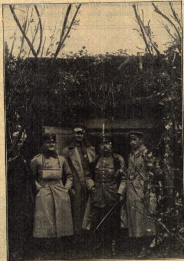
Der Palast des Brigadefeldmarschalls General v. Goltmann auf dem Kriegsschauplatz in Frankreich.

Mißverstehe mich nicht. Wenn ich vom schönen Homburg spreche, so denke ich dabei nicht an das elegante Weltbad Homburg. Ich meine nicht den vornehmen Kurort mit seinen prächtigen Hotelbauten, nicht den großen, herrlich gepflegten Kurpark mit seinen berühmten Tennisplätzen, auch nicht die promenaden-