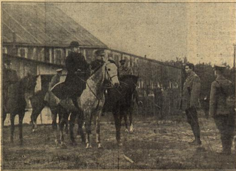
Königin Wilhelmine von Holland mit Gefolge, bei der Besichtigung einer holländischen drahtlosen Telegraphenstation.

„Dafür werden dann wir anderen Sterblichen mehr von Ihnen haben,“ klang es gereizt vom anderen Ende der Terrasse