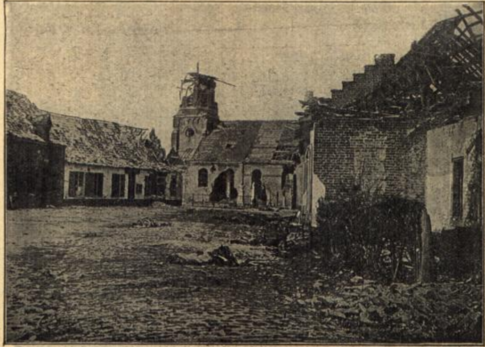
Vom Kriegsschauplatz in Westlandern: Dorfstraße in Gheluvelt nach dem Kampf.

Die Knaben waren plötzlich ganz still und Willi, der Jüngere zerrte die bunte Mütze vom Kopfe, er hatte das unbestimmte Gefühl, sein kriegerisches Aussehen täte der Tante weh, die mit bedenden Lippen zu ihnen sprach.