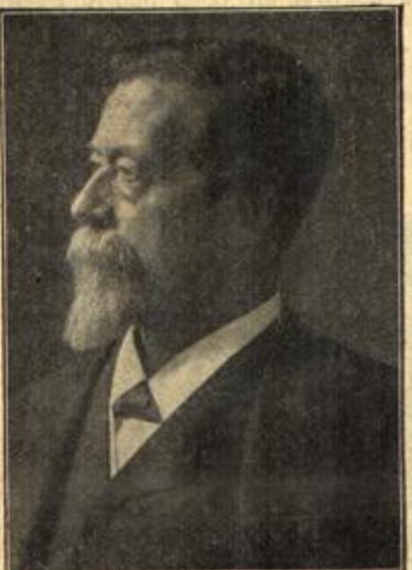
Wirkl. Geheimrat Prof. Anton v. Werner, Direktor der Berliner akademischen Hochschule, erlag im 71. Lebensjahre einem langwierigen Leiden. Er war der Maler des Krieges 1870/71, und seine monumentalen gehaltenreichen Gemälde sind weit bekannt.

„Ja!“ „Und Sie müssen zugestehen, daß Sie die Annahme jener Mensur unter einem Vorwande verweigert hatten, der von dem studentischen Ausschusse nicht anerkannt werden konnte, sondern als Feigheit bezeichnet wurde, so daß Ihnen die Folgen einer solchen Ent- scheidung auch fühlbar ge- worden sein mußten.“