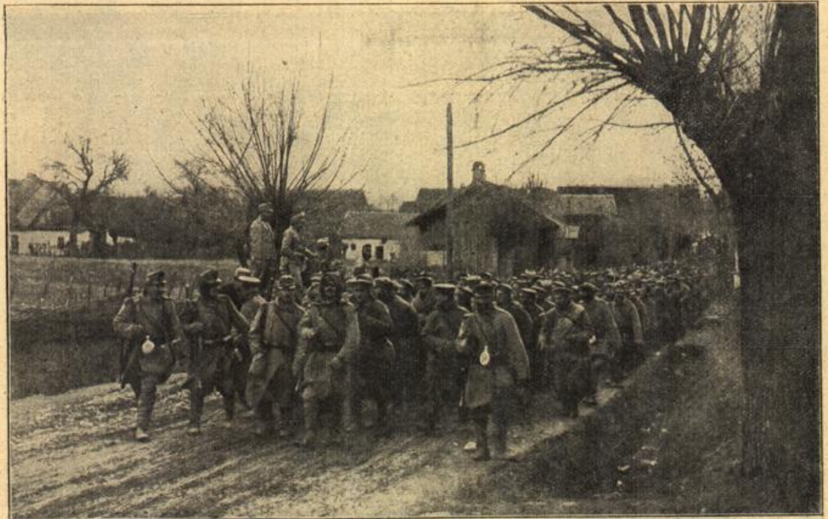
Ein Massentransport russischer Geiseln, die die österröschischen und ungarischen Truppen in den Kämpfen von Dunajec machten.

Um nun einen Weg zu finden, der ihn zu einer Erfüllung führen könnte, suchte er eine Annäherung an den Bruder von Marga von Tondern. Dem Manne glaubte er sich eher anvertrauen zu dürfen, der Bruder würde ihm eher verraten können, ob er an Marga von Tondern selbst die entscheidende Frage stellen sollte. Er wollte erst die Gewißheit, ob seine Werbung nicht als Unbescheidenheit angesehen würde. Fritz von Tondern war älter als seine Schwester und unterstützte diese sicherlich mit seinem Räte, wie Marga von Tondern ohne dessen Einverständnis auch keine Entscheidung fällte. So dachte Martin Holländer.