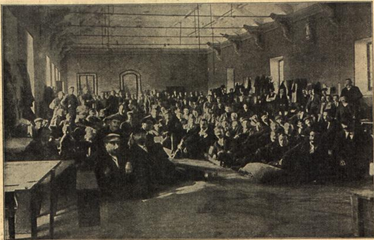
Deutsche Zivilgefangene im Kloster Garaison in Südfrankreich.