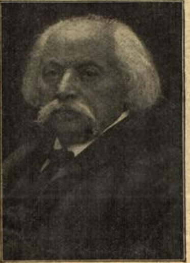
Dr. Karl Goldmark, der Mentor der österreichischen Kom- ponisten und zugleich einer der erfolg- reichsten Fondsdirectoren der letzten Jahr- zehnte, starb in Wien im Alter von 85 Jahren. Seine „Königin von Saba“ und „Das Heimchen am Herd“ haben ihm seinerzeit glänzende Erfolge ge- bracht.

Wieder hatte er es hören müssen; und er hatte doch gehandelt, wie es an diesem Tage von ihm abermals gesehen wäre. Und Marga von Tondern konnte nur eben- so denken wie der Bruder. Wie ein Dieb war Martin Holländer fortge- schlichen.