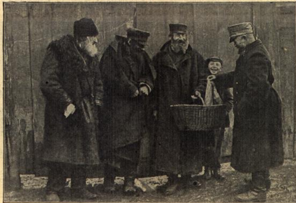
Deutsch-polnische Verständigungsversuche: Der Landsturmann in Lodz.

In der guten alten Zeit konnte man diese moderne Notwendigkeit, um Geld zu verdienen, so gut wie nicht. Die Kunst regelte die Höhe und den Absatz der Produkte. Der Handwerker brachte höchstens über seiner Haustür ein Namenschild, eine Gießkanne, eine Brezel an zum Zeichen, daß hier Blechwaren od. Semmeln oder sonst etwas zu haben war. Da gab es keine Schaufenster, mit dem höchsten Raffinement zu Einkaufszwecken ausgestattet; kein Regier drückte mit freundlichem Grinsen und blendenden Zähnen dem Vorübergehenden einen Reklamezettel in die Hand; keine bunten Plakate zogen den Blick des Beschauers auf sich; an den Türen und Anschlagplätzen der alten Städte und Städtchen konnte man höchstens irgendeine hochwichtige polizeiliche Bekanntmachung oder eine Steuermahnung entdecken. Damals war es noch eine Lust zu leben, die Reklame verfolgte niemanden auf Schritt und Tritt, wie das heute der Fall ist. Löse ein