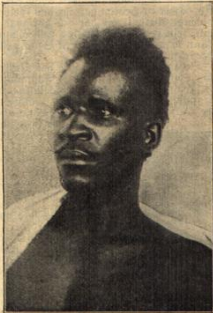
Ein Vorkämpfer für französische Kultur.

„Meine Frau hat immer ihre Geheim- nisse mit Herrn v. Heeren. Seit sieben Jahren ist es ihr höch- ster Ehrgeiz, meine Neugierde wach zu rufen, aber es gelingt ihr nicht.“