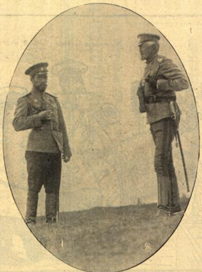
Der Zar Nikolaus und Großfürst Nikolai Nikolajewitsch auf dem Kriegsschauplatz im Osten.

Ein jeder, der die Lage der Vorbereitung und grenzenlosen Spannung erlebt hat, hatte das Gefühl, als wohnte er einer heiligen Handlung bei. In diesen Tagen gab es kein lautes Lachen in den Straßen. Die Luft vibrierte mit der allgemeinen Spannung,