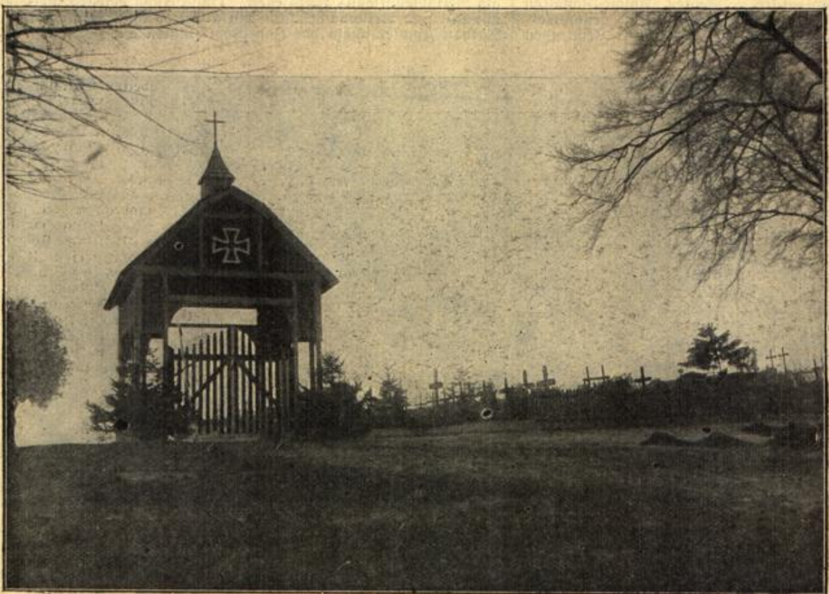
Der deutsche Kriegerfriedhof in Laon.

Der hinter der Allee gelegene Friedhof ist in seiner ganzen Anlage ein neuer Beweis für die Pietät, mit der die deutschen Truppen inmitten der Schrecken des Krieges ihrer gefallenen Kameraden gedenken.