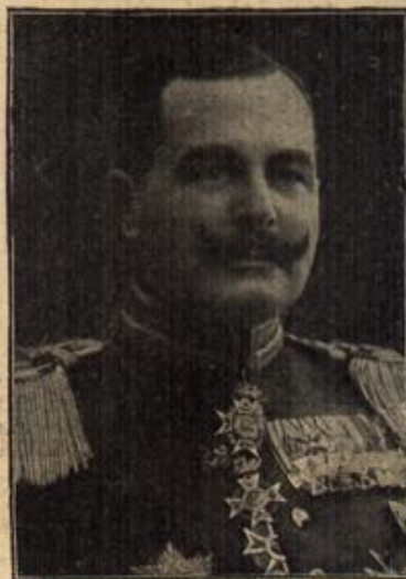
Generalleutnant Wild v. Hohenborn.

Du kennst ja Frankfurt, also brauche ich Dir nicht erst ein Langes und Breites davon vorzuschwärmen. Mit Entzücken nahm ich die Schönheiten der Stadt in mir auf. Diese glückliche Vermengung neuer und alter Kultur, die einem überall entgegentritt, dieses vornehme, ruhig elegante Straßenbild, diese kostbaren Auslagen in den Geschäften, die darauf schließen lassen, daß hier