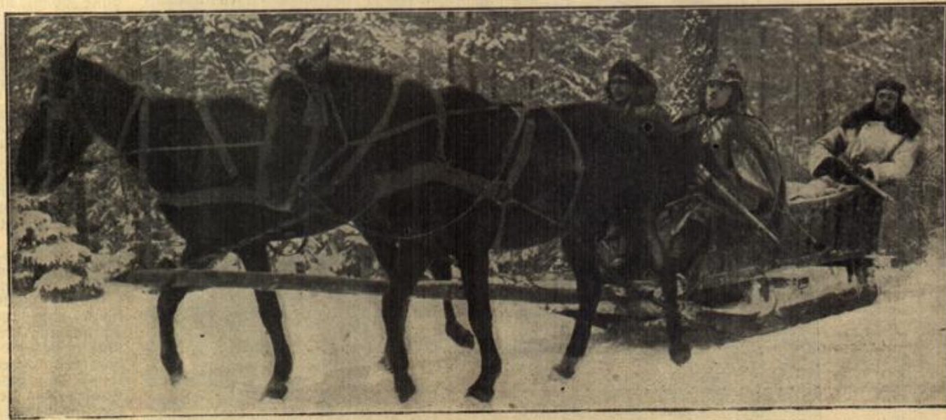
Deutsche Schlittenpatrouille in Polen.