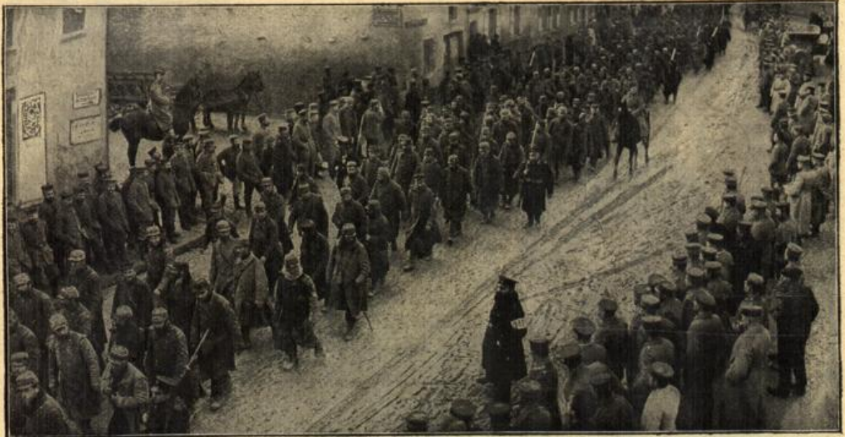
Die gefangenen Garibaldianer.

Daß das heutige Reklamewesen naturgemäß einen hohen Kostenaufwand erfordert, ist klar. Frau Reklame ist eine kostspielige Dame. Für Frankreich hat man die jährlichen Reklamekosten auf etwa 100 Millionen Franken, für die Vereinigten Staaten auf etwa 500, 600 bis 1000 Millionen Dollars geschätzt. In Deutschland hat man 1908 den Anzeigenertrag aus Zeitungen und Zeitschriften auf 412,3 Millionen Mark geschätzt. Bei einzelnen Firmen steigt der Reklamewand bisweilen ins Gigantische. Eine amerikanische Tabakgesellschaft hat im Jahre 1903 allein eine Million Dollars, darunter für die Verbreitung einer Fünf-Cent-Zigarre allein in einem Jahre 400 000 Dollars ausgegeben. Nach den Ermittlungen des Schweizer Hoteliersvereins betragen die Reklamekosten der Schweizer Hotels 1894 1,35, 1905 2,84 Millionen Franken; sie sind also beträchtlich und im Steigen begriffen. Nach Glahn ist in Deutschland bei älteren Detailgeschäften am besten ein Prozentsatz vom Umsatz — etwa 2 bis 3 Prozent — als Reklamewand festzusetzen. Ohne einen eigenen Reklameapparat und Reklamechef kann ein größeres Geschäft nicht leben. Nathan Fowler schätzt das Jahreseinkommen amerikanischer erst-