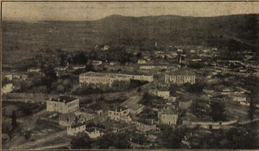
Gesamtansicht von Valona.

Das Schredens- kind. Fräulein (dem Onkel die Zigarre anzün- dend): „Aber steck' sie nachher nicht verkehrt in den Mund!“ — Onkel: „Wie kommst du darauf?“ — Frä- ulein: „Papa sagte neulich, du ver- brennest dir im-