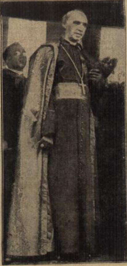
Der belgische Kardinal Mercier.

„Aber warum? Nur um einer Laune willen kannst du es nicht tun. Was nehme ich dir, wenn ich nach meinem Gewissen handle? Dich liebe ich, dich allein! Und von meiner Liebe wird dir nichts genommen, auch wenn ich jemand meine Hilfe leihe. Warum also soll ich eine Einnischung in die Angelegenheit unterlassen?“