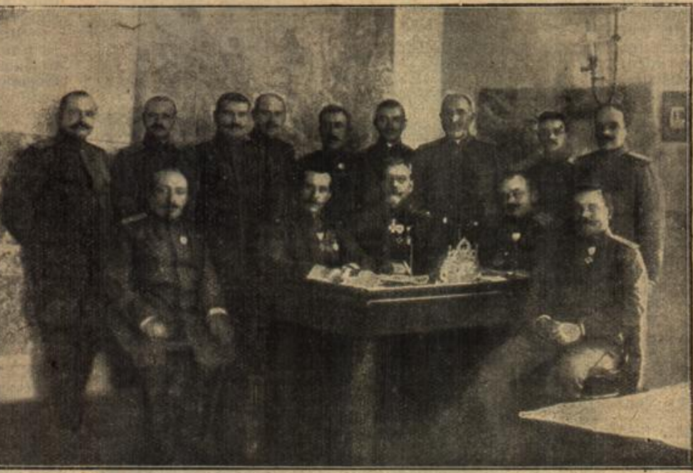
Die neueste Aufnahme des bulgarischen Generalstabes.

Wohl Keime wecken mag der Regen, Der in der Scholle niederbricht, Doch golden Korn und Erntesegeu Reift nur heran bei Sommerlicht.