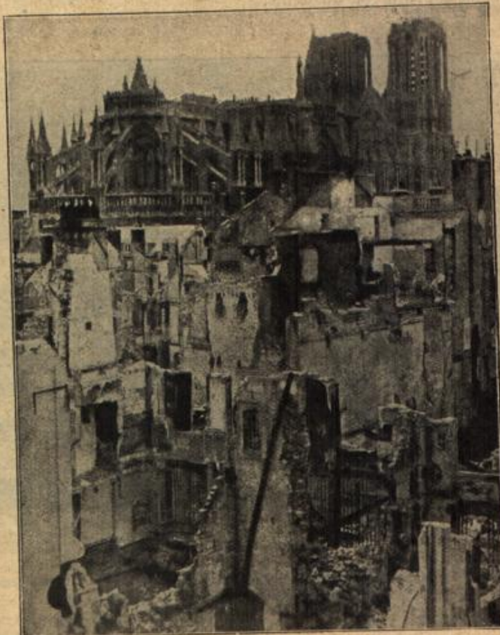
Die Ruinen von Reims.

Nichts Gutes ahnend bei diesem sonderbaren Verhalten der Entführer, blickte Meier XXVI das Spitzenbündel etwas genauer