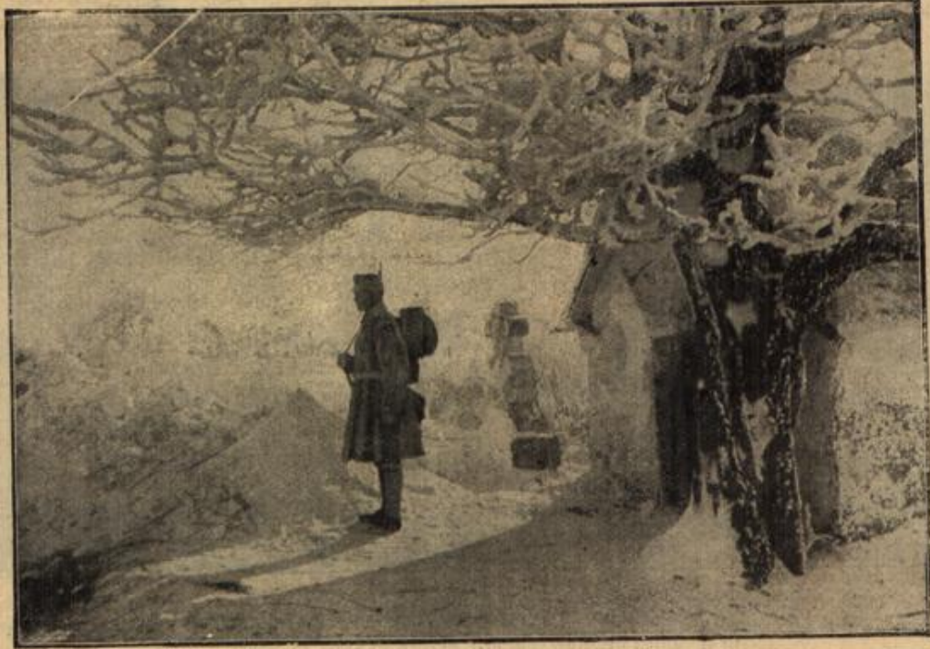
Auf Feldwache in Ser. ient.

„Se 's all wedder näs'wies west,“ sagte er im Niedersetzen, „Micheli mütt Le tred'n.“