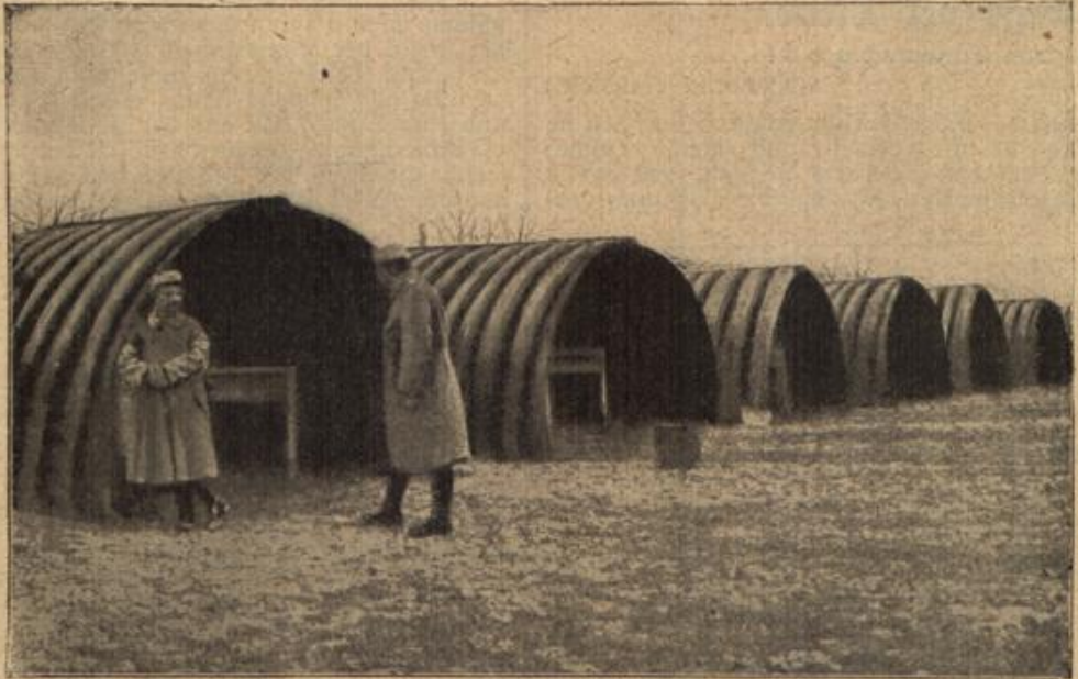
Kriegswohnungen. Wellblechbaracken als Unterstände französischer Offiziere auf dem westl. Kriegsschauplatz.

„O, wie herrlich war's! Ach, Tante ich habe ja gar nicht