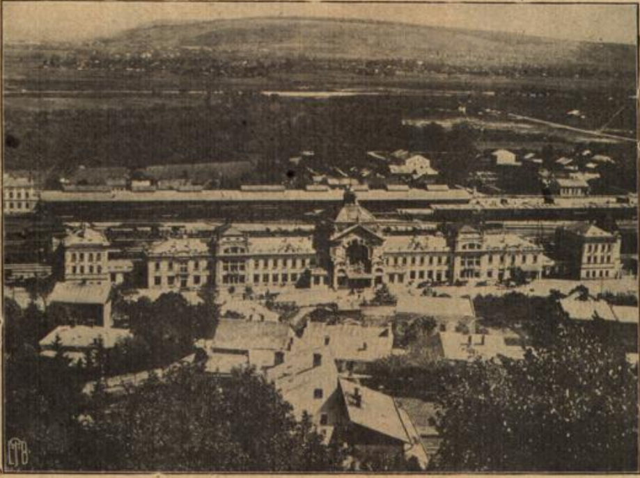
Zernowiz, die Hauptstadt der Bukowina. (Im Vordergrund der Hauptbahnhof.)

Nebenbei war er ein sehr schöner Mann, schlank, hochgewachsen, feurigen Blutes und voll jenes natürlichen Anstandes, wie er in freien Landvolke oft genug gefunden wird. Der Umgang mit gebildeten Männern, den seine Tätigkeit vermittelte, gab ihm auch äußeren Schliff, sodaß er sich leidlich gut benahm. Möglich, daß sein reichlich ausgebildetes Selbstbewußtsein im Verein mit allen anderen guten Eigenschaften die kleine Dita betört hatte. (Fortsetzung folgt.)