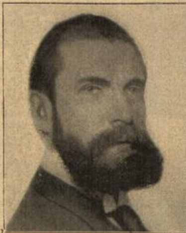
Charles E. Hughes, der republikanische Kandidat für den amerikanischen Präsidenten-Posten. Als Gegner Wilsons wird von der republikanischen Partei bei der nächsten Wahl der frühere Gouverneur von New-York, Charles E. Hughes, aufgestellt.

Man hatte sich die Pflege und Zucht des Viehes besonders angelegen sein lassen, wie überhaupt die ganze Landwirtschaft blühte. Dies war und ist auch deshalb um so eher möglich, weil das Land weder die dörrrende Hitze, noch die furchtbare Kälte wie das Innere Rußlands kennt. Das nahe Meer mildert nämlich das Klima. Von schädlichen, verderbenbringenden Einflüssen der Witterung wissen die Bewohner kaum etwas zu berichten, wie sie sich denn auch arbeitsloser Zeiten oder Notjahre nicht erinnern können. Im Vergleich zu andern Gebieten Rußlands ist Kurland darum ein bevorzugtes Land, und mit einem gewissen Ausbruch des Dankes gegen ihren Schöpfer und Erhalter reden sie von ihrer Heimat gern als von ihrem „Gottesländchen“.