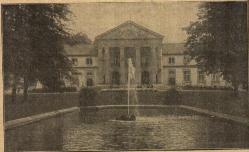
Das neue Aachener Kurhaus inmitten der Anlagen.

Gretl hat vom Vater ein paar Klapsse bekommen. Empört sagt sie zur