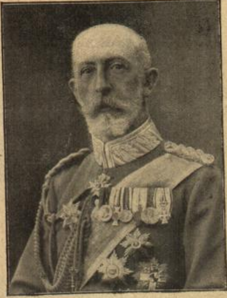
General Graf Bothmer, Führer einer deutschen Armee im Kampfe gegen die russische Offensive.

Doch da kam Glanz in des Mannes Augen. Fest zog er die Schluchzende ans Herz.