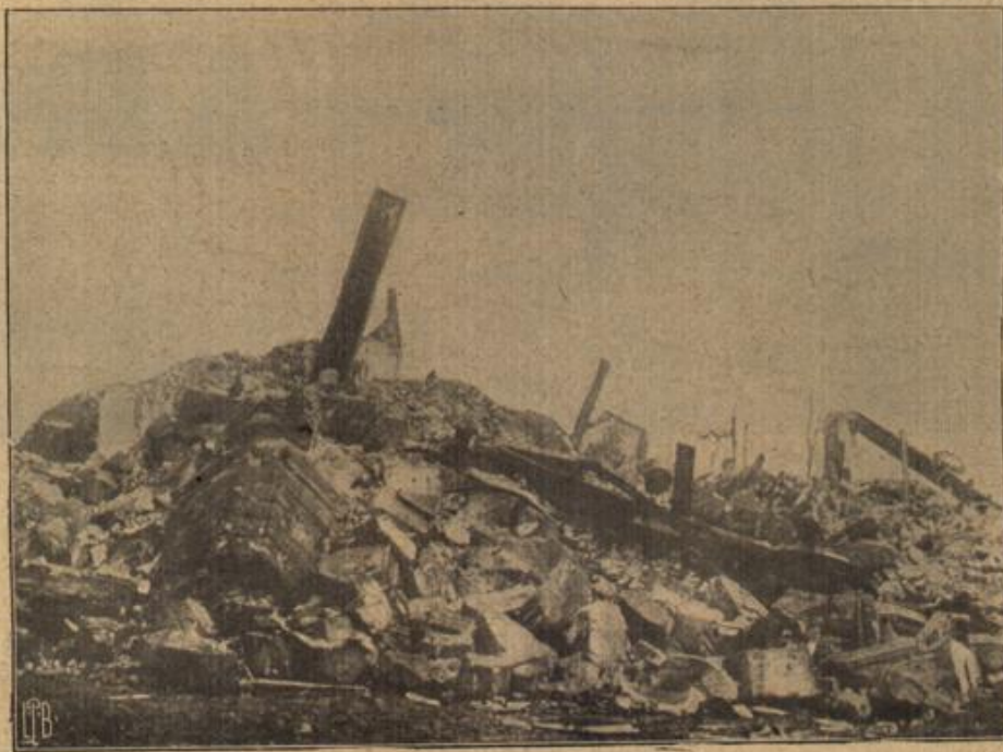
Zur Eroberung des Forts Chiamont.

Hannes im Lodenrock, die Hahnenfeder fed auf dem Hütel, machte den Kutscher.