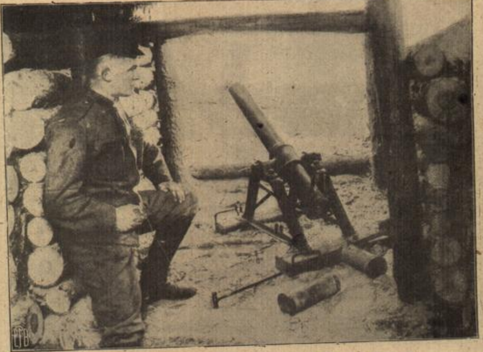
Vor einem Un erkand in Wolhynien aufgestellter Minenwerfer.

Was mochte in Josephs Seele vorgehen? Seine Augen blickten düster, seine Lippen zitterten in ungesprochenem Wort. Er hatte den Hut vom Kopfe genommen und ließ die Sommerluft um seine Stirn wehen. Wenn je eine Stirn den Charakter ihres Besitzers zum Ausdruck brachte, so war es diese. Edel in ihrer Form, sprach sie von Verstand und Willensstärke, aber auch von heißer Leidenschaft, wie das krause, volle Geäder an seinen Schläfen verriet.