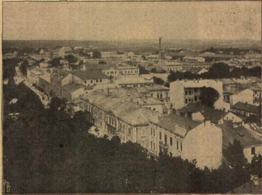
Die Stadt Tarnopol in Galizien.

„Aber sein verstellen kannst du dich, das muß wahr sein.“