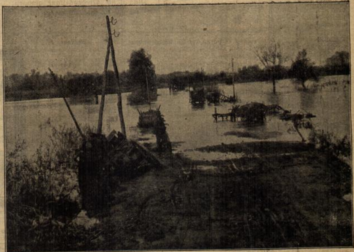
Vom Kriegsschauplatz in Serbien: Die Rückzugslinie der Serben durch eine überschwemmte Landstraße. Auf der überfluteten Straße liegen Fahrzeugreste, die die flüchtenden Serben zurückließen. vorn ein zerstörter serbischer Rückenzug, dahinter am Fluß ein deutscher Kadsfahrerpökel.

"Die Diebstähle, die ich aufklären soll, sind sämtlich im Laufe des verfloßenen Sommers in den Schlössern der Umgegend und stets während einer Festlichkeit verübt worden. Durch meinen Briefwechsel mit dem Polizeiinspektor Gruber erfuhr ich dann, daß Ihr heutiger Maskenball, Herr Ge-