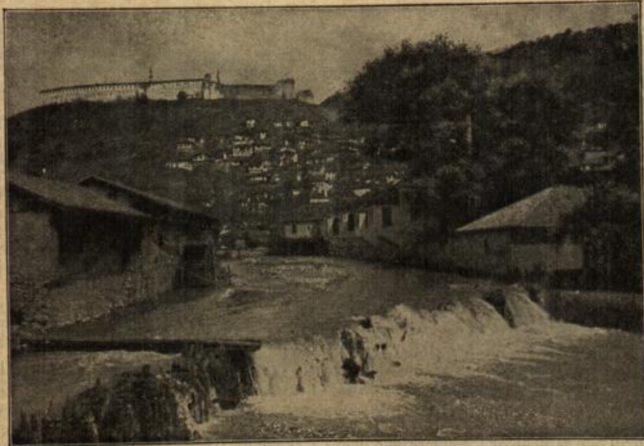
Die Stadt Prizren an der albanischen Grenze,