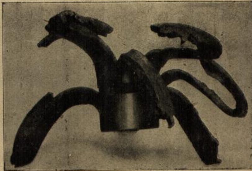
Explodierte französische 7,5-Granate.

„Ja, das habe ich gewollt!“ erwiderte das alte Männchen fast feierlich. „Denn ich habe Sie ehrlich lieb gehabt damals als kleinen Burschen, weil Sie eben so etwas Frisches, Fröhliches an sich hatten und auch zu uns Angestellten stets freundlich waren. Schade nur, daß es mir nicht gelang, in dem heranwachsenden Jüngling