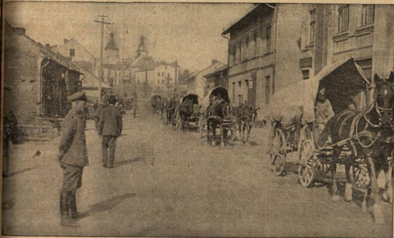
Durchzug eines österreichisch-ungarischen Bagagetrains durch Neu-Sandec (Galizien).

Die Russen mußten auf die Vorteile, die sie in Galizien errungen hatten, verzichten, dank der Tapferkeit der verbündeten Truppen. Zur Frischerhaltung der Soldaten trug viel die Regsamkeit der Bagagetrains bei, deren einen wir hier auf dem Durchzug in Neu-Sandec begegnen. Der Dunajec ist, trotzdem er bisher unserem Ohre so unbekannt war, durchaus nicht etwa ein kleines Bächlein. Er ist vielmehr ein ganz respektable Strom, was wir an der Brücke erkennen können, die unsere Pioniere errichten mußten, damit deutsche Artillerie bei Neu-Sandec den Dunajec überqueren konnte.