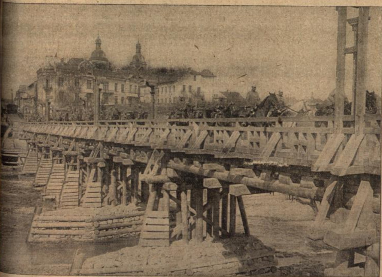
Deutsche Artillerie beim Ueberschreiten einer neuerrichteten Brücke über den Dunajec (Neu-Sandec, Galizien).

Die Russen mußten auf die Vorteile, die sie in Galizien errungen hatten, verzichten, dank der Tapferkeit der verbündeten Truppen. Zur Frischerhaltung der Soldaten trug viel die Regsamkeit der Bagagetrains bei, deren einen wir hier auf dem Durchzug in Neu-Sandec begegnen. Der Dunajec ist, trotzdem er bisher unserem Ohre so unbekannt war, durchaus nicht etwa ein kleines Bächlein. Er ist vielmehr ein ganz respektable Strom, was wir an der Brücke erkennen können, die unsere Pioniere errichten mußten, damit deutsche Artillerie bei Neu-Sandec den Dunajec überqueren konnte.