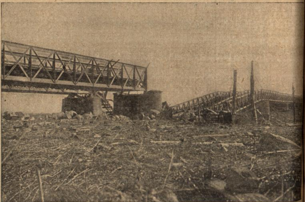
Von den Russen gesprengte Eisenbahnbrücke über den Dunajec.

ihrer Berichte u. a.: „Während zuges unserer dritten Armee vom gegen den San haben wir 50 Geschütze zurückgelassen, die die meisten durch schwere feindliche Schosse vernichtet waren und gebracht werden konnten.“