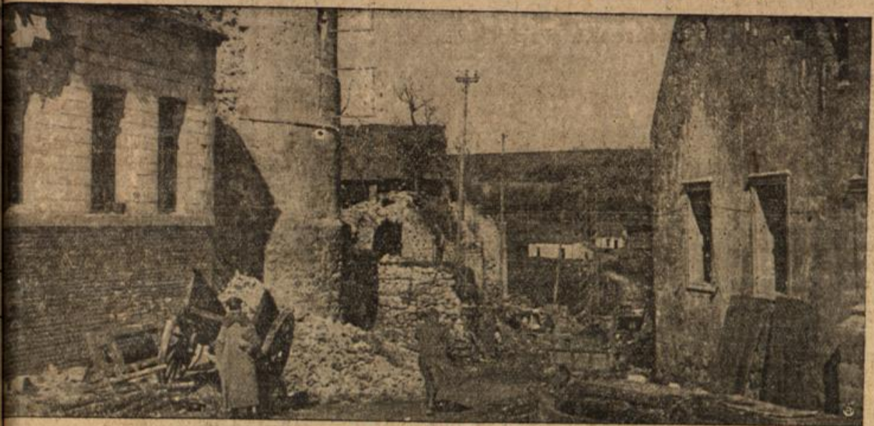
Zusammengehoffene Straße in Carency.