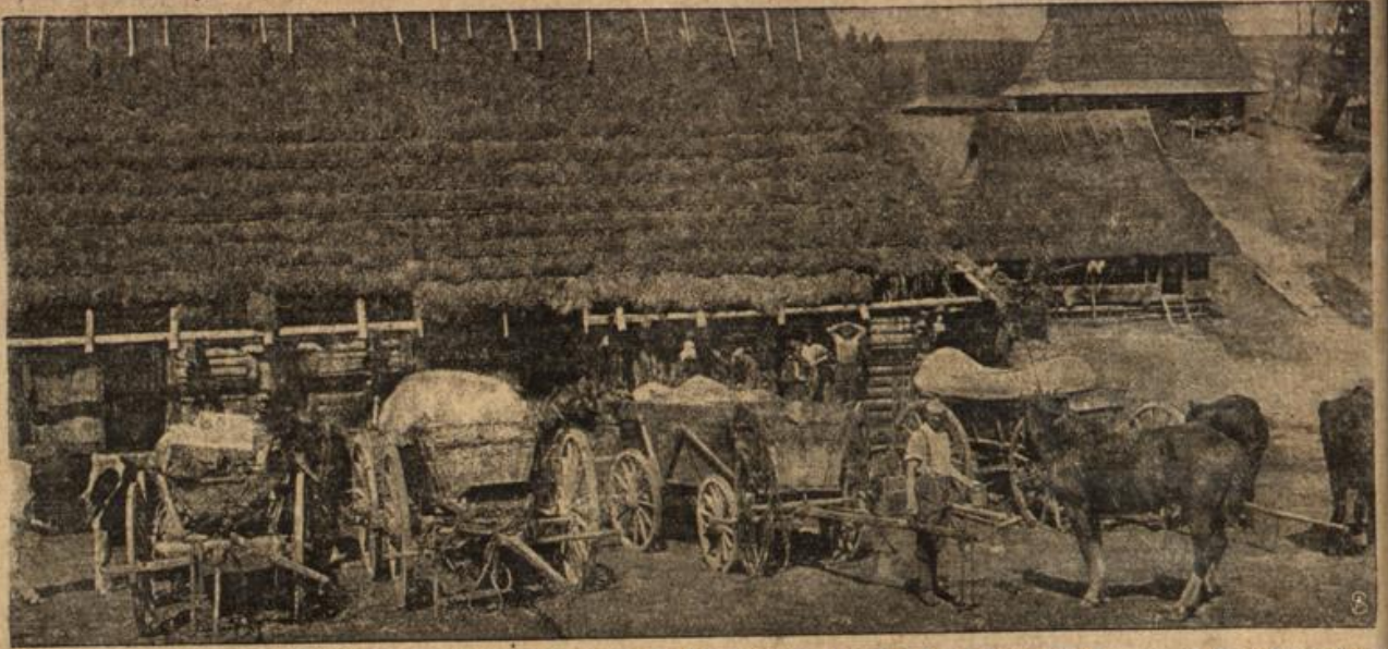
Einquartierte Reserven der deutschen Südmarmee in den Karpathen.

Ich trug damals die himmelblaue fundanermütze. Die Aussicht, nach als drei Jahren, wenn alles gut geht, irgend einer hohen Schule Deutscher Mühe und Band tragen zu können, uns ungeduldigen Jungen ein zu geben, Trost, und wir gründeten die obliegende Verbindung. Man mag darüber sagen, was man will, und Herrmann werden als königlich preussischer Gymnasial-Professor ja auf der Ge-