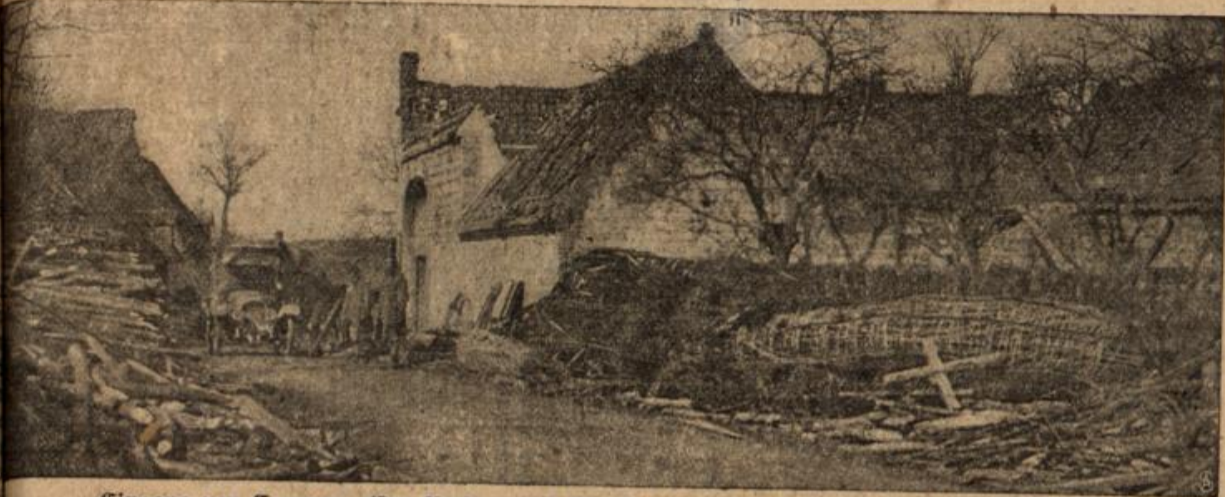
Eingang von Carency. (Im Vordergrund Pioniermaterial: Holz und Drahthindernisse.)