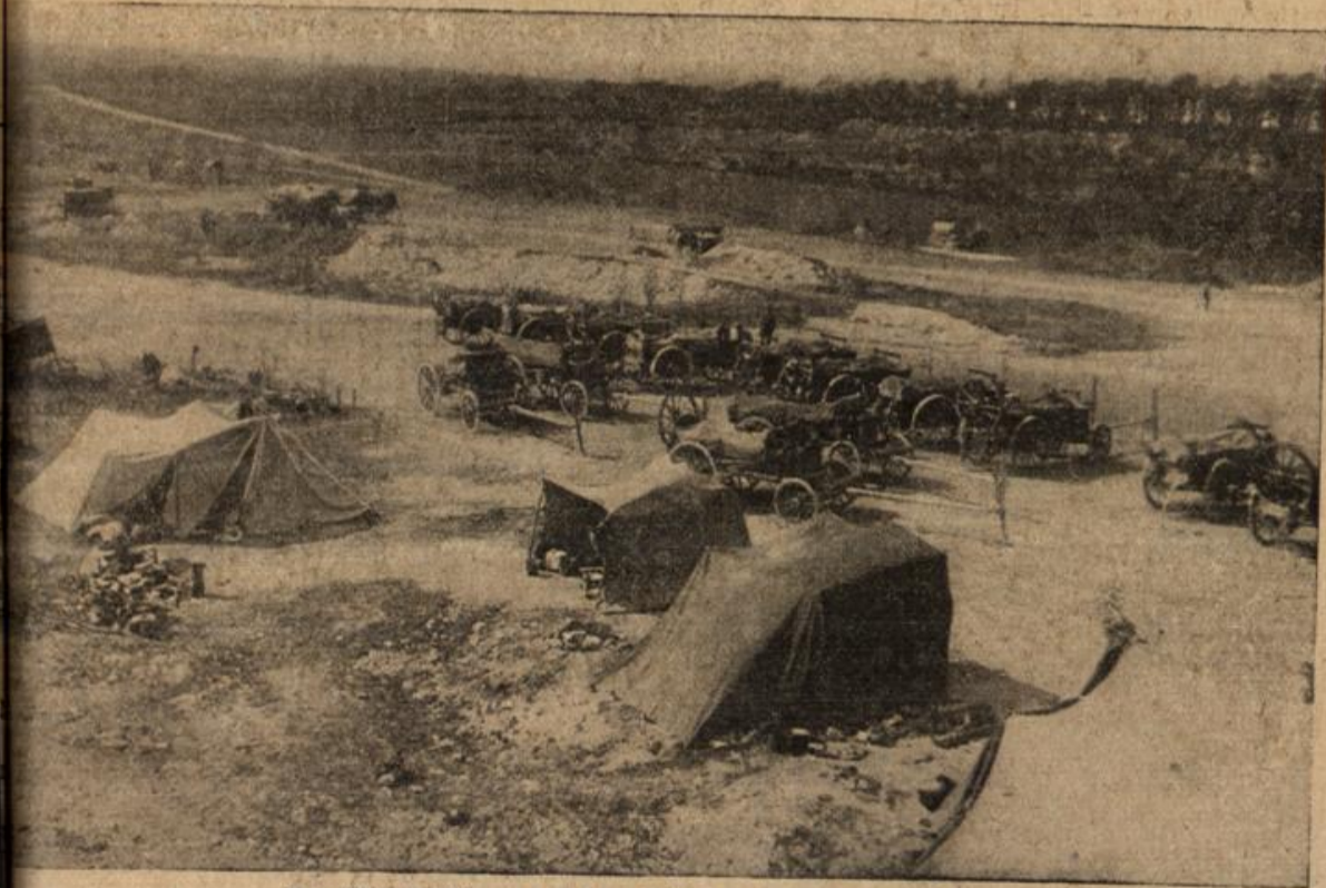
Deutsches Feldlager auf dem Gipfel der Côte Vorraine.