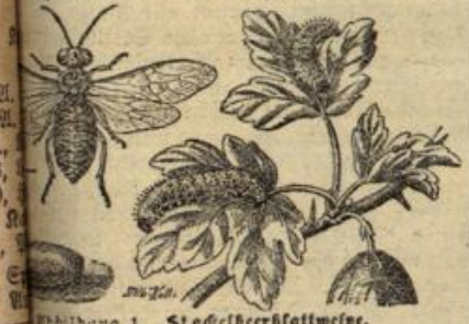
Abbildung 1. Stachelbeerblattwespe.

Unter den tierischen Schädlingen, die den Stachelbeerbush heimsuchen, ist die Stachelbeerblattwespe (Abb. 1) die häufigste und auch am verderblichsten. Ihre große Schädlichkeit beruht nicht zum Teil darin, daß sie jährlich in zwei Generationen erscheint. Die Raupen der ersten Generation zeigen sich Mitte Mai bis Mitte Juni, die der zweiten Juli—August. Sie sind zu verschiedenen Zeiten verschieden gefärbt. Das ist daher, daß sie sich häuten. So sind die Raupen der ersten Generation dunkelgrün, teilweise gelblich-grün, die der zweiten Generation schwarz. Der Kopf ist schwarz, der ganze Körper ist mit schwarzen Warzen bedeckt. Das Weibchen legt zahlreiche Eier an die Unterseite, die Blattrippen entlang, ab. In wenigen Tagen erscheinen die Raupen der ersten Generation, machen sich über die Ober- und Unterseite her und fressen schließlich auch die Früchte verschmähen sie nicht.