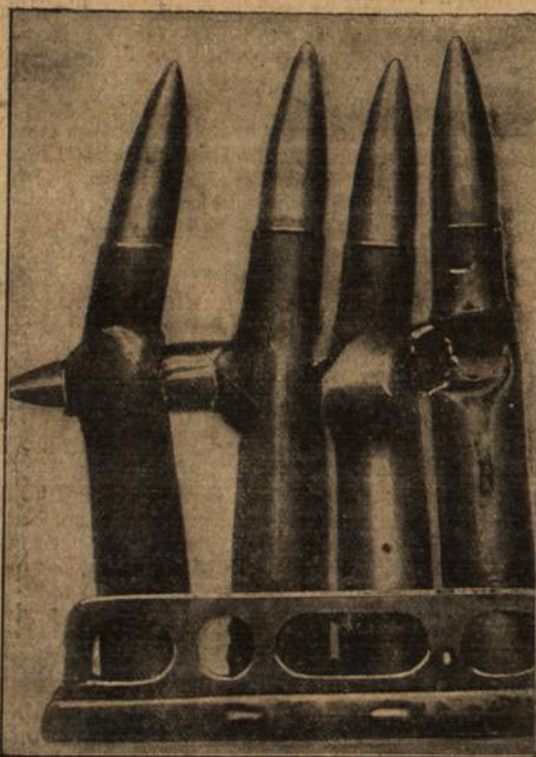
Die Durchschlagkraft des deutschen Gewehrgehosses.