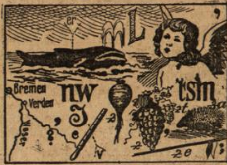
(Auflösung folgt in nächster Nummer.)

biete. Weder Kälte noch Regen konnten Masinissa, den König von Numidien, bewegen, sein Haupt zu bedecken. Kaiser Severus hatte seinen Kopf ebenfalls so abgehärtet, daß er im ärgsten Schneegestöber keine Bedeckung aufsuchte.