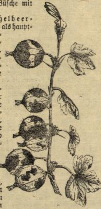
Abbildung 4. Amerikanischer Stachelbeermeltau.

Vom Stachelbeermeltau, den wir als hauptsächlichste Pilzschädigung erwähnen wollen, gibt es zwei Formen, die europäische und die amerikanische. Weit aus am gefährlichsten ist der amerikanische Stachelbeermeltau (Abb. 4), der auch andere Ribes-Arten, so auch Johannisbeeren, befallt. Erst vor wenigen Jahren nach Deutschland verschleppt, ist er jetzt dort schon häufig zu finden. Im ersten Stadium, wo er Blätter, Triebe und Früchte mit weißem, mehlartigem Belag überzieht, unterscheidet er sich nur schwer vom europäischen Stachelbeermeltau. Bald jedoch färbt er sich bräunlich und ist auch durch seine filzartige Beschaffenheit vom gewöhnlichen Meltau verschieden. Besonders kenntlich ist er durch den Befall der Beeren (siehe die Abbildung), die mit braunen, filzartigen Flecken besetzt sind. Die Früchte bleiben unreif und sind ungenießbar. Die Triebspitzen kümmernd und sterben im Winter ab. Eine durchgreifende Bekämpfung ist unbedingt geboten. Der Bezug von Pflanzen aus verseuchten Baumschulen ist zu vermeiden. Bei Krankheitsverdacht in vor-