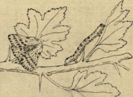
Abbildung 2. Stachelbeerspanner.

Der Stachelbeerspanner (Abbild. 2), auch Harlekin genannt, ist nicht so häufig, kann aber auch ziemlich gefährlich werden. Die Raupe ist weiß mit schwarzen Flecken, unten gelb. Sie bewegt sich mit ihren zehn Füßen nach Spannerart. Der