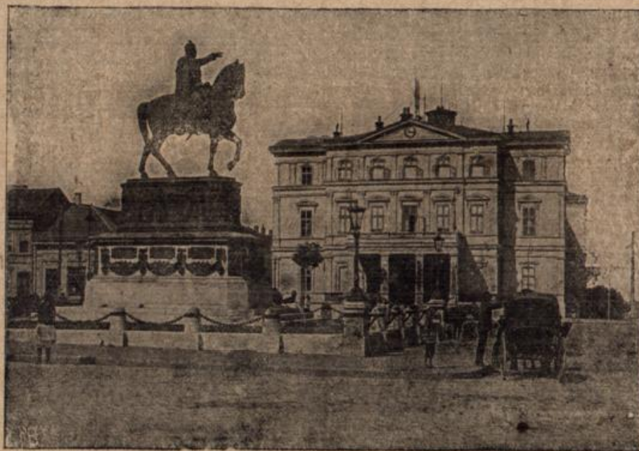
Staudbild des Miloš Obrenowitsch in Belgrad.