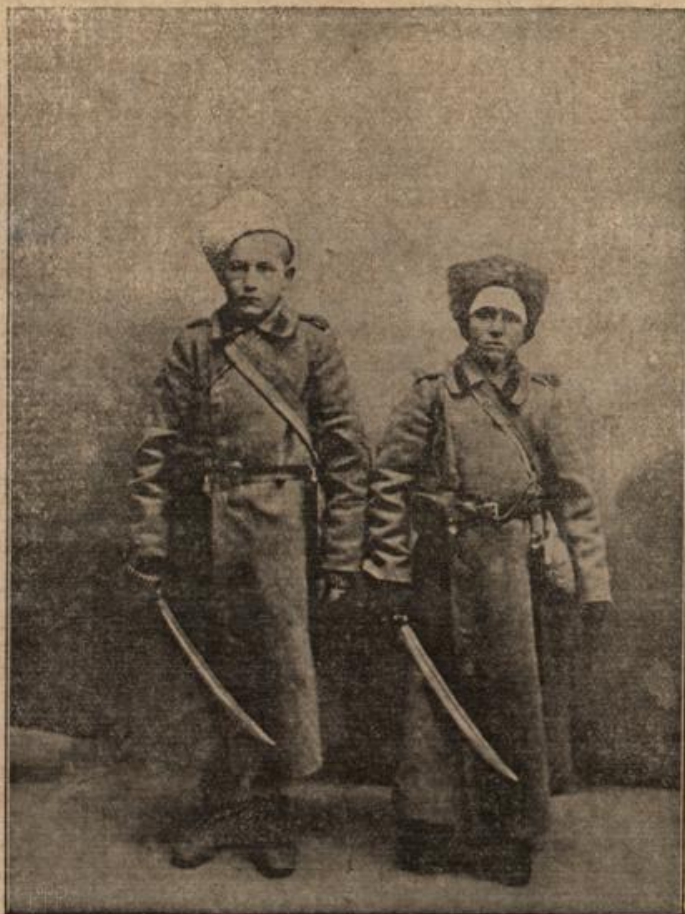
15 und 14½ Jahr alte Kosaken. (Foto: ...)

Is nach dem Bukarester Frieden die Griechen mit Serben einen Geheimvertrag offen, das Saloniki, den neu gewonnenen griechischen Hafen zu Serbien ausliefert, ahnte niemand, welche Bedeutung gerade der Punkt des Vertrages einst gewinnen würde. Griechenland und Serbien hatten damals sehr wohl, daß Bulgarien die Wiedergewinnung von Saloniki nur aufgeschoben hat. Das Bündnis, das beide Mächte eingegangen, sah also in erster Linie den Fall eines bulgarischen Angriffes auf eines der beiden Länder vor. Der zweite Punkt des Vertrages gewährte Serbien Saloniki eine Art Freihafen, gleich aber bestimmte er, daß Serbien ungehindert die griechischen Waren auf der Bahn Saloniki-Nisch befördern dürfe. Der Weltkrieg, der ja so seltsame Dinge gewandelt hat, brachte eine neue Auslegung des Vertrages — und zwar durch den Wiener Vertrag, der in Saloniki, auf griechischem Boden, die Bahn für Serbien landete. Das untere Bild zeigt die Zitabelle, die einstens, als die Türken und Venetianer um den Besitz der Stadt rangen, ihre Bedeutung hatte, heute kaum zur Verteidigung