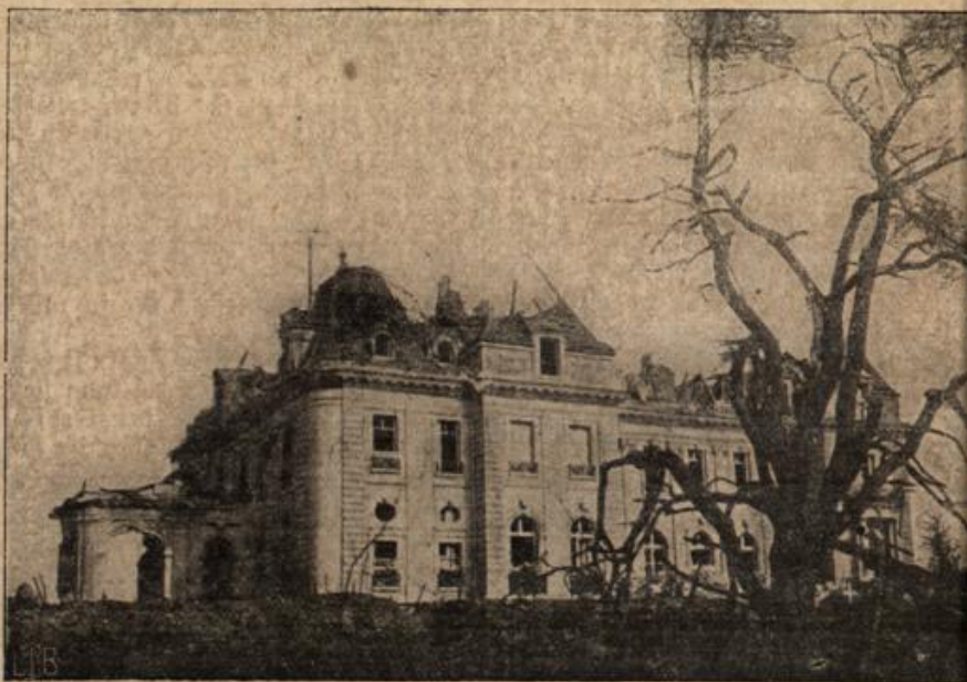
Schloß Hollebeke bei Tveru in Belgien.

Alle schrien durcheinander. Friß drang zuerst mit seiner riesigen Stimme durch. Weinahe verächtlich kräuselte sich sein