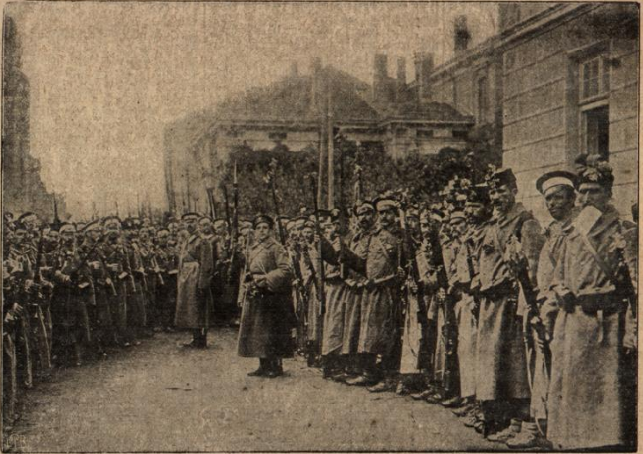
Bulgarische Regimenter, feldmarschmäßig ausgerüstet und zum Ausmarsch geschmückt, auf dem Hauptplatz in Sofia. Bulg. Presse-Büro.