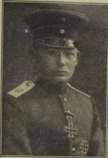
Ein Unteroffizier mit dem Eisernen Kreuz erster Klasse ausgezeichnet.

der Erbauer des 42 cm-Vöröfers, Mitglied im Direktorium der Firma Krupp, Schöpfer des sogenannten 42 cm-Vöröfers, erhielt für die wertvollen Dienste das Eiserne Kreuz.