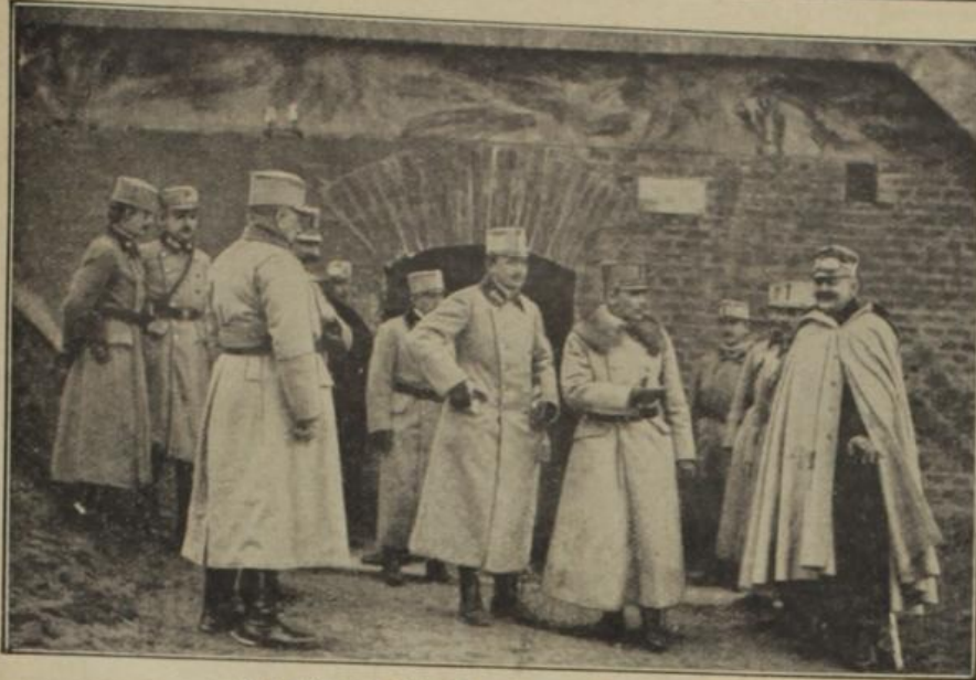
Der österreichische Thronfolger in Przemyśl.

Wir sehen den österreichischen Thronfolger, Erzherzog Karl Franz Josef (links) und den heldenmütigen Verteidiger von Przemyśl, Feldmarschall-Lieutenant Hermann von Kusmanek (rechts), während einer Besichtigung der Festung Przemyśl.