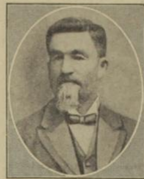
Christian de Bel, der „Schwarze Teufel“ des Burenkrieges, der Feind Bojhas und Englands.