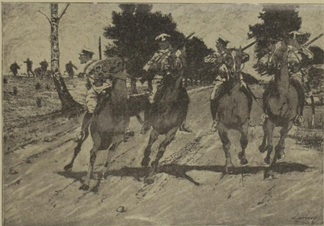
Kosakenpatrouille, von deutscher Infanterie überrascht.