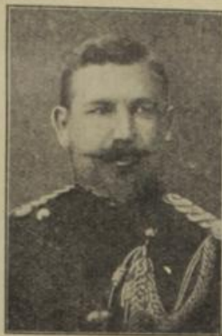
General Meyers, einer der Führer der auf- ständischen Buren.