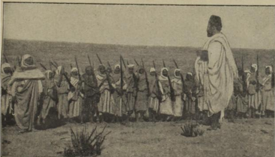
Der heilige Krieg in Nordafrika.

Wir zeigen in unserem Bilde den überaus schwierigen Transport eines österreichischen schweren Geschützes auf den grundlosen Wegen des russischen Kriegsschauplatzes. Schon das war ein Grund für unsere Truppen, bei dieser schlechten Verfassung der Wege sich eine günstigere Kampfesstellung zu suchen, deren vorteilhafte Wirkung in den letzten Kämpfen zu Tage trat.