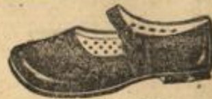
Leder-Sandalen von M. 3.50 an

Kinder-Stiefel in braun 275 od. schwarz . . . von 2 an Damen-weiße Halbschuhe 1.90 genähte Ledersohle, v. 4 an Damen-schwarze Spangen- schuhe, gestiftet . für 3.90