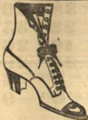
In Chevreaux od. Boxkalt

Sowelt unsere noch vorteilhaft eingekauften Vorräte reichen, bieten wir in