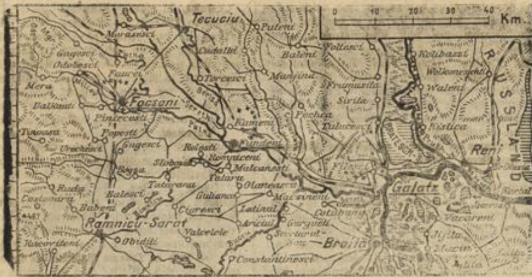
Unsere heutige Kartenlitze veranschaulicht das Gelände der gegenwärtigen Kampfhandlungen.