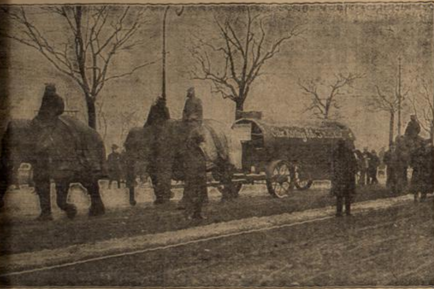
Elefanten als Zugtiere in den Straßen Berlins. Bei dem starken Schneefall wurden die Elefanten des Tierparks Hagenbeck als Zugtiere herangezogen.