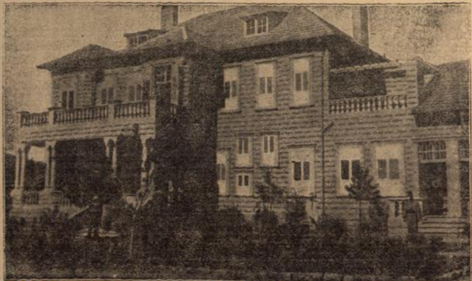
Das deutsche Konsulatsgebäude in Haifa in Kleinasien, das während des Krieges vollendet wurde.