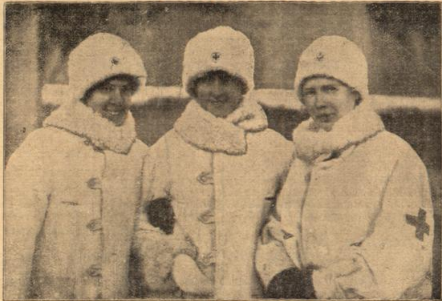
Schwedische Rot-Kreuz-Schwester von dem schwedischen Lazarettschiff „Neolus“.

Die Erfüllung schwerer Pflichten — das ist's. Aber das wagte ich Ihnen nicht zu reichen. Noch nicht. Der Wunsch, uns aus unserer schönen Traumwelt loszulösen und uns einen Platz im Wirklichkeitsleben zuerringen, muß aus uns selbst kommen. Sonst werden wir leicht zur Maschine, und die Heilwirkung, die innere Beglückung, bleibt aus. — Inzwischen ist ja auch jede weitere Erwägung überflüssig geworden. Sie sind glücklicher daran, wie ich seinerzeit. Sie brauchen nicht außerhalb Ihres Hauses und nicht bei fremden Menschen Heilung suchen, Sie können sie nun in Ihren eigenen vier Wänden finden. Darum rief ich Ihnen ein „Glückauf!“ zu, als ich Ihnen die Wiederkehr Ihres Gatten ankündigte, Frau Hermine.“