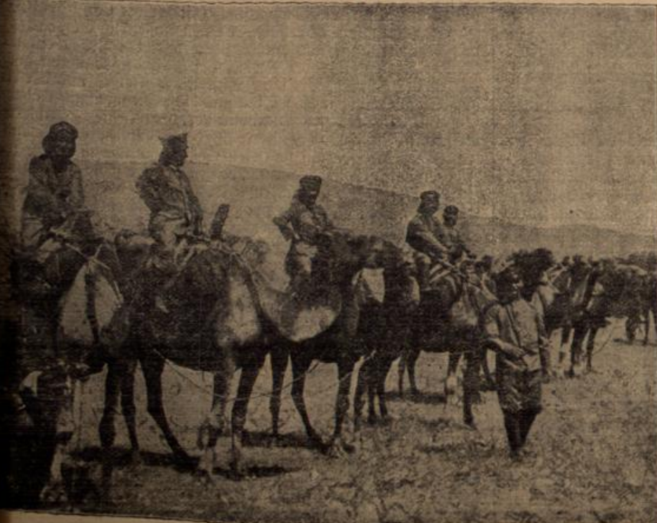
Deutsche Feldgrane als Kamelreiter an der mazedonischen Front.