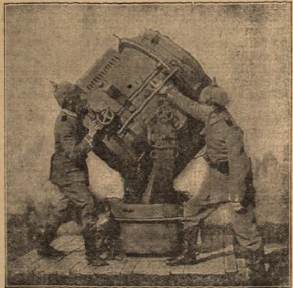
Bei einer Fliegerabwehrabteilung: Scheinwerfer einer Fliegerabwehrkanonenabteilung.