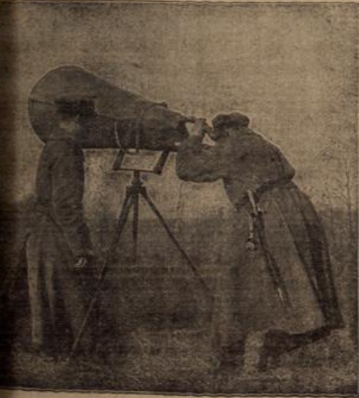
Suchapparat, mit dem die Annäherungsrichtung feindlicher Flugzeuge festgestellt wird.